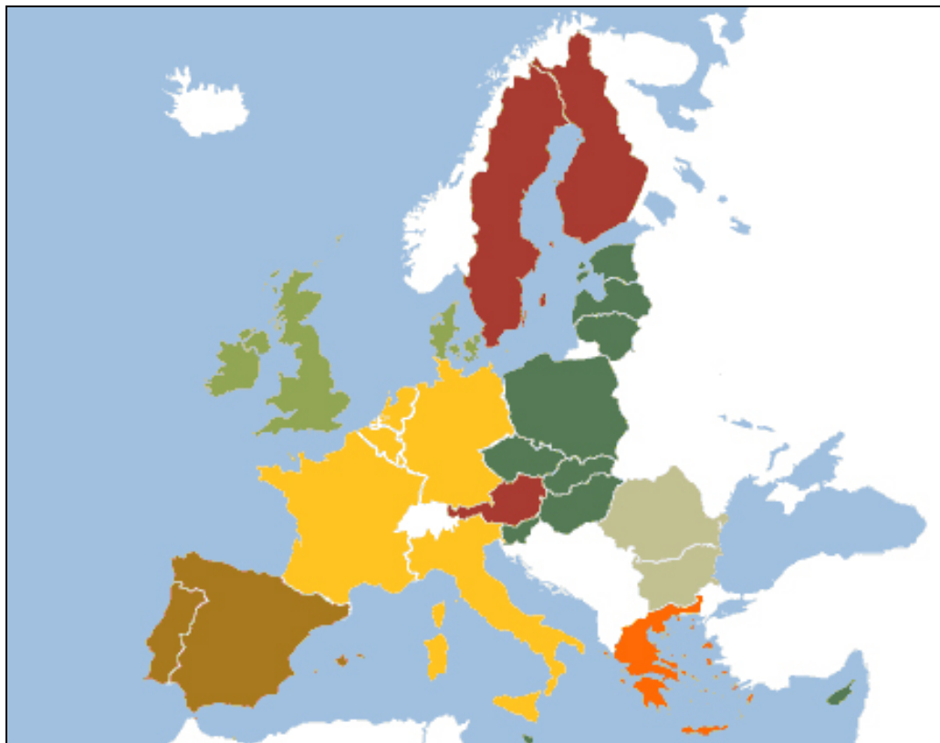
Příloha 1: Mapa rozšiřování Evropské unie k roku 2007