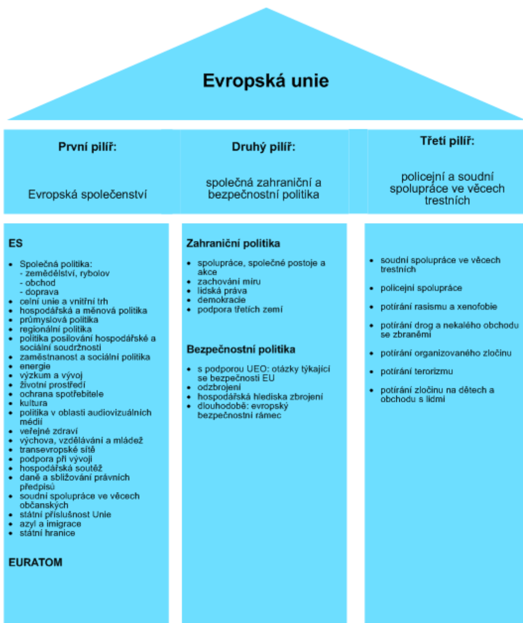
Obrázek 1: Pilířová struktura EU (Maastrichtský chrám) 18