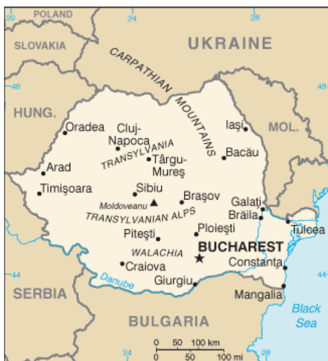
Obrázek 2: Mapka Rumunska 81

Rumunsko a někdy také Rumunská republika je tedy republikou s hlavním městem Bukurešť, v jejímž čele stojí prezident Traian Basescu. Leží na území Balkánského poloostrova a svou rozlohou a počtem obyvatel se řadí mezi středně velké země. Přijetím 1.1.2007 do Evropské unie se Rumunsko stalo osmou největší a sedmou nejlidnatější zemí EU. Zároveň se tím otevřela Evropské unii cesta k Černému moři. Kromě EU je Rumunsko také členem např. organizací OSN, NATO, OBSE, SEI, CEFTA, přidruženým partnerem ZEU a plnoprávným účastníkem Paktu stability pro jihovýchodní Evropu.