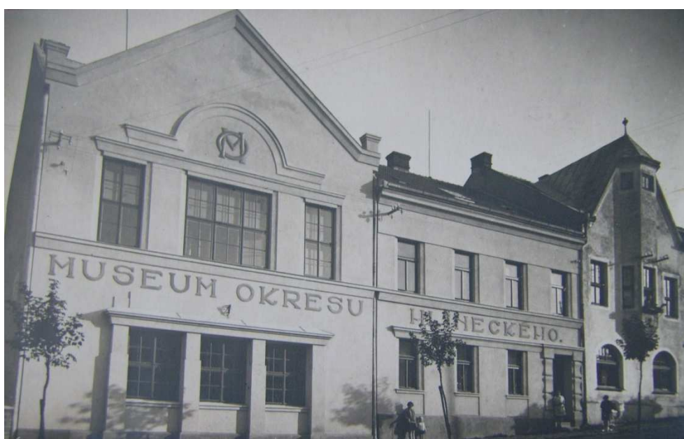
Budova hlineckého muzea po úpravě (30. léta 20. století) 495