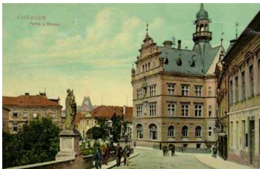
Renesanční část budovy chrudimského muzea na počátku 20. století 496