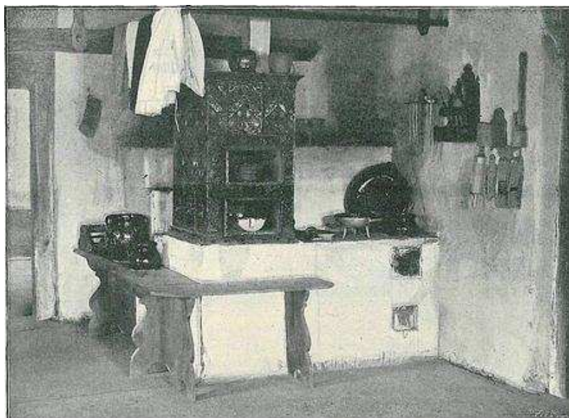
Světnice východočeského statku na Národopisné výstavě československé v Praze roku 1895 493