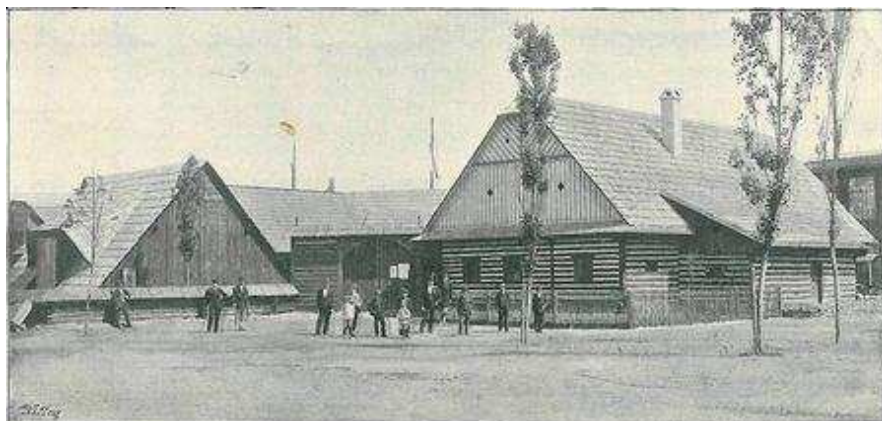
Východočeský statek na Národopisné výstavě československé v Praze roku 1895 492