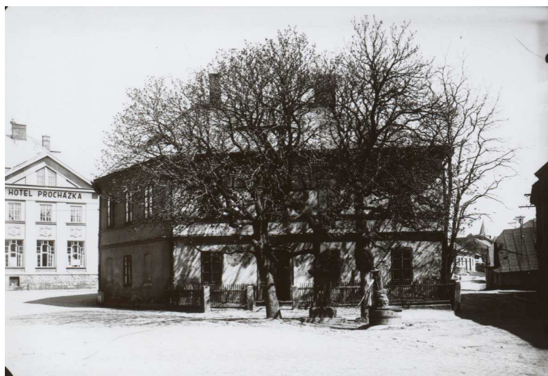
Adámkův dům v Hlinsku v 1. polovině 20. století 491