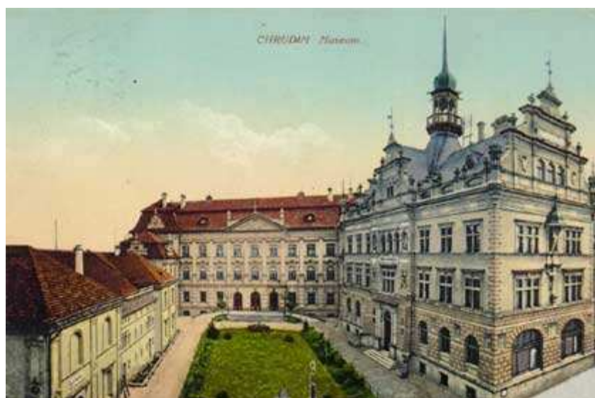
Budova chrudimského muzea na počátku 20. století 497