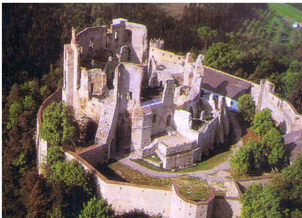
PŘÍLOHA č. 1: