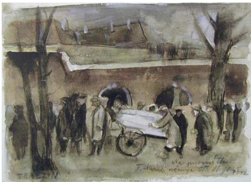
Varování před nákazou Tyfu, který se v Terezíně rozšířoval