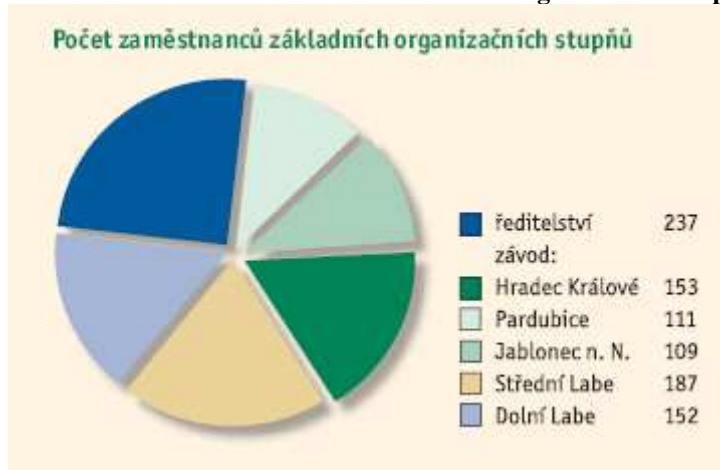
Obrázek 7-3 Počet zaměstnanců základních organizačních stupňů