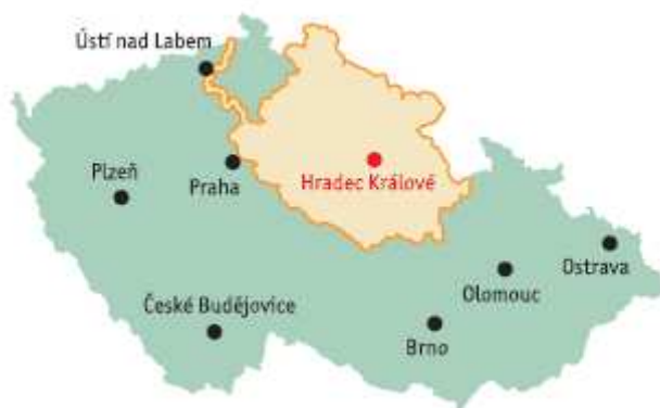
Obrázek 7-1 Územní vymezení