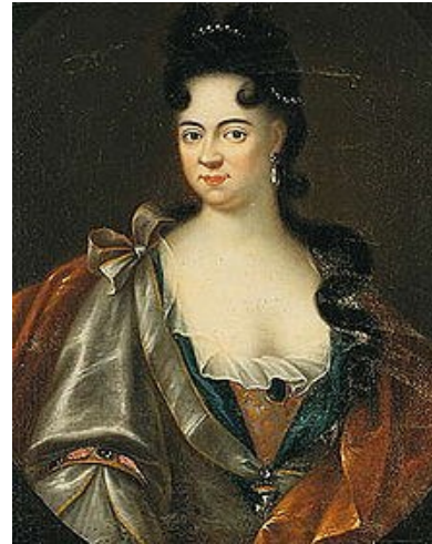
Obr. 15: hraběnka Marie Aurora z Königsmarcku (1662-1728)