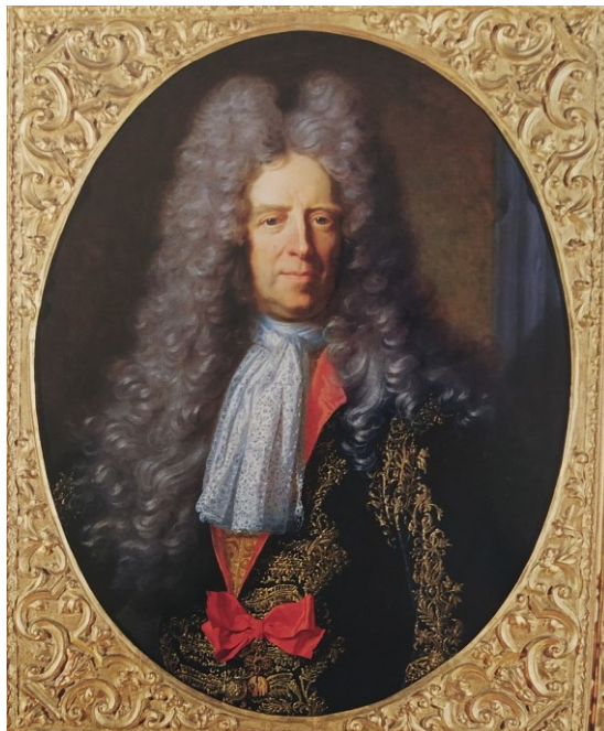
Obr. 6: Ferdinand Bonaventura, hrabě z Harrachu (1637-1706), na portrétu z roku 1698.