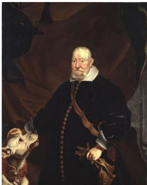
Obr. 2: Jan Jiří I. saský se psem. Autor: Frans Luycx, 1652.

Nový kurfiřt, Jan Jiří II. (1613-1680), potvrdil stavům jejich práva a společně se svými bratry slíbil, že v budoucnu už nedojde k dalšímu rozdělení saského kurfiřtství. 69 Jan Jiří II. vedl velmi rozmařilý život. Téměř neustále se účastnil lovů, 70 pořádal karnevaly, hostiny, turnaje, ohňostroje či bály. 71 Začal s barokní přestavbou Drážďan, na níž se podílel také architekt Wolf Caspar Klengel, který v letech 1664–1667 budoval drážďanské divadlo, které mělo kapacitu 2000 diváků. 72 Za kurfiřtovy vlády vzrostl významně počet dvořanů. Kurfiřt zaměstnával hodně zahraničních umělců, kteří většinou pocházeli z Itálie, Chorvatska a Francie. V roce 1657 čítala kurfiřtská dvorní kapela 31 členů, z nichž bylo 13 Italů. 73 Většina nově příchozích cizinců byli katolíci a víme, že již od roku 1661 se v Drážďanech konaly tajně katolické bohoslužby. Někteří současníci pochybovali dokonce o pevnosti kurfiřtovy luteránské víry. 74 Náklady na udržování velkého dvora do značné míry přiměly kurfiřta opustit