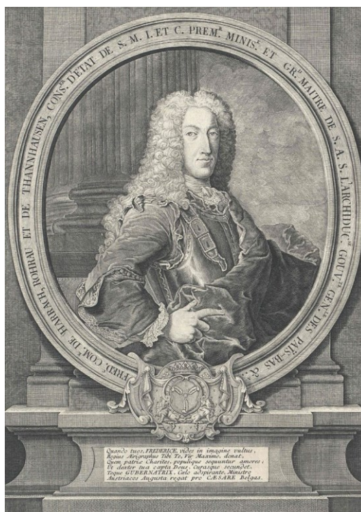
Obr. 8: Friedrich August, hrabě z Harrachu (1696-1749), jako nejvyšší hofmistr Marie Alžběty Rakouské.

Marií Eleonorou Karolinou z Lichtenštejna, s níž měl celkem 16 dětí. V roce 1726 byl vyslán jako císařský vyslanec do Turína na dvůr sardinského krále, který dokázal využít rozkolů mezi mocnostmi ve svůj osobní prospěch a obával se, že Harrach má svým působením jeho plány zjistit a hlásit je císaři. Proto se hraběti nedostalo na sardinském dvoře vřelého přijetí a nedokázal se s tamním dvorem sžít. V srpnu následující roku byl kvůli zdravotním problémům odvolán. 159 Pak absolvoval další diplomatickou misi, když byl v letech 1728–1733 českým kurfiřtským vyslancem na říšském sněmu v Řezně. Od roku 1732 působil na dvoře v Bruselu u místopředsedkyně Rakouského Nizozemí Marie Alžběty Rakouské 160 jako nejvyšší hofmistr a nejvyšší komoří. Po její smrti se ujal funkce místopředsedy sám a nahradil ho zde až v roce 1744 vévoda Karel Lotrinský. 161