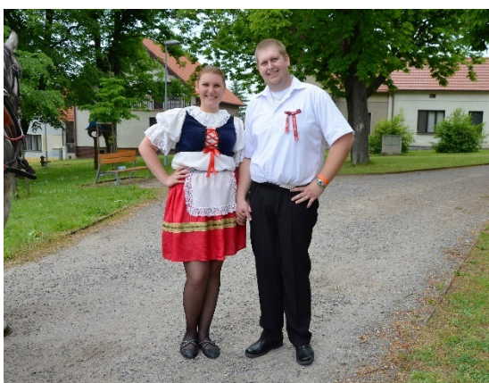
Dívčí krojový kostým, Staročeské máje v Ovčárech, 2016.

(LANGHAMMEROVÁ, Jiřina. Lidové kroje z České republiky . Praha: Nakladatelství Lidové noviny, 2001. Dějiny odívání.)