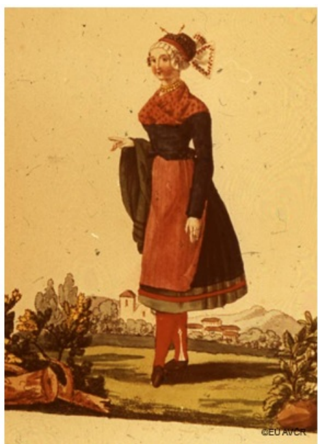
Sváteční oděv dívky z Čáslavska, Grüner: Böhmisches Volkstrachten, 1810, Praha. Repro D. Havránková.

(LANGHAMMEROVÁ, Jiřina. Lidové kroje z České republiky . Praha: Nakladatelství Lidové noviny, 2001. Dějiny odívání.)