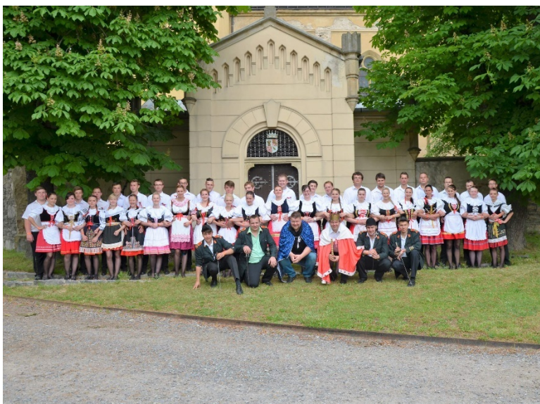
Ověčáry, 2016. (oficiální foto akce)