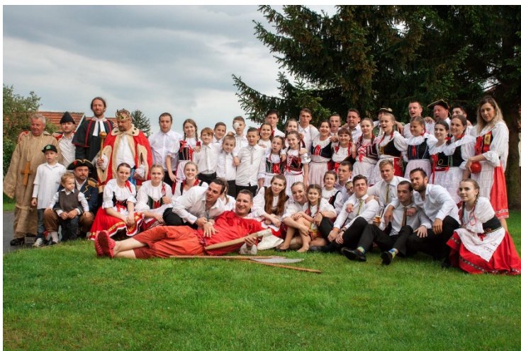
Jestřabí Lhota, 2017. (oficiální foto akce)