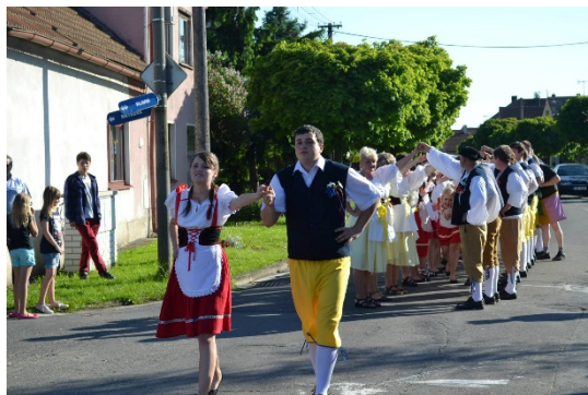
Pár v krojových kostýmech, Staročeské máje v Sendražicích, 2013. (oficiální foto akce)