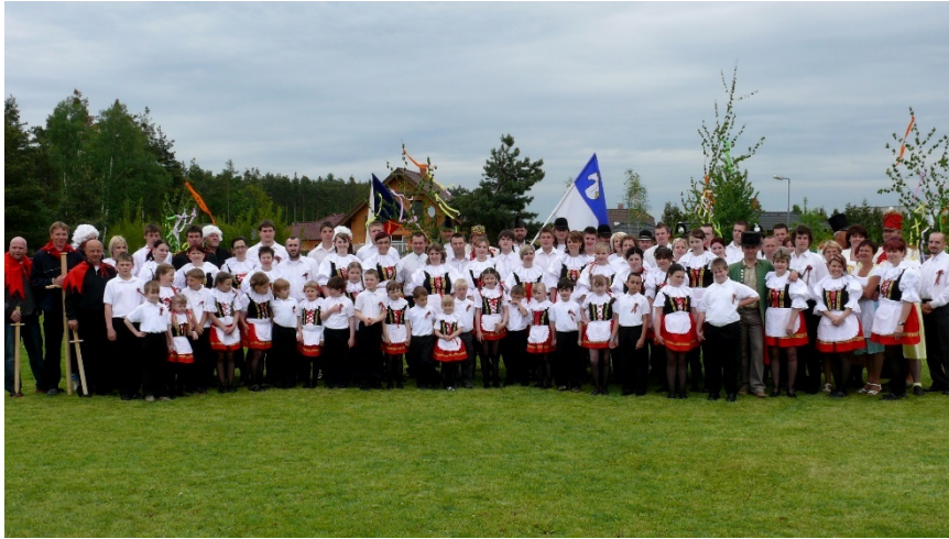
Konárovice, 2013.