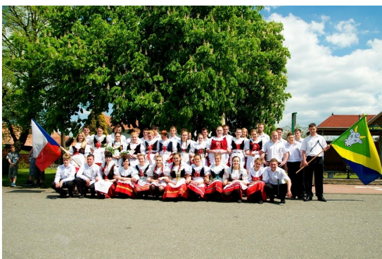
Volárna, 2016. (oficiální foto akce)