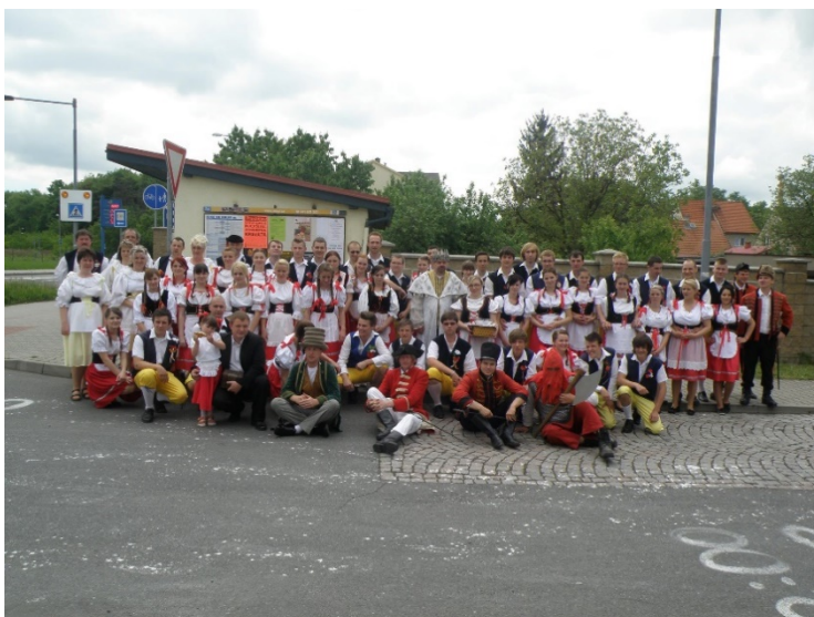
Sendražice, 2016. (oficiální foto akce)