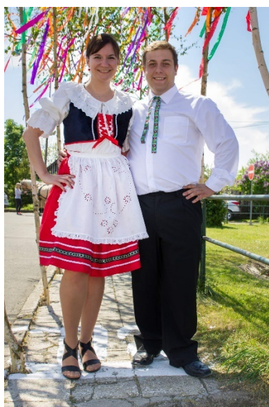
Dívčí krojový kostým, Staročeské máje v Jestřabí Lhotě, 2017. (oficiální foto akce)