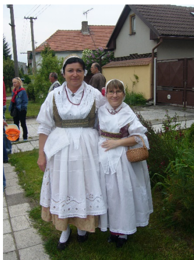
Doprovodné postavy v krojích vdaných žen, Jestřabí Lhota, 2010.