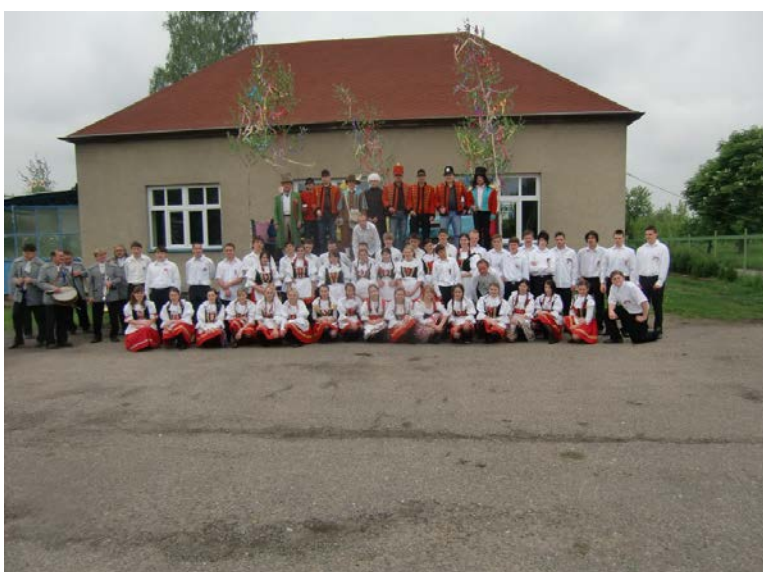
Veltruby, 2014. (oficiální foto akce)