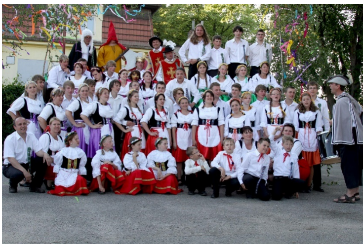
Velký osek, 2015. (oficiální foto akce)