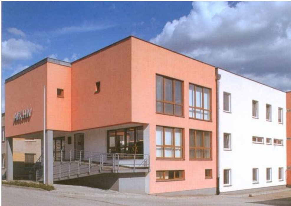
Obrázek 4 – Nová budova v ulici Bratří Čapků