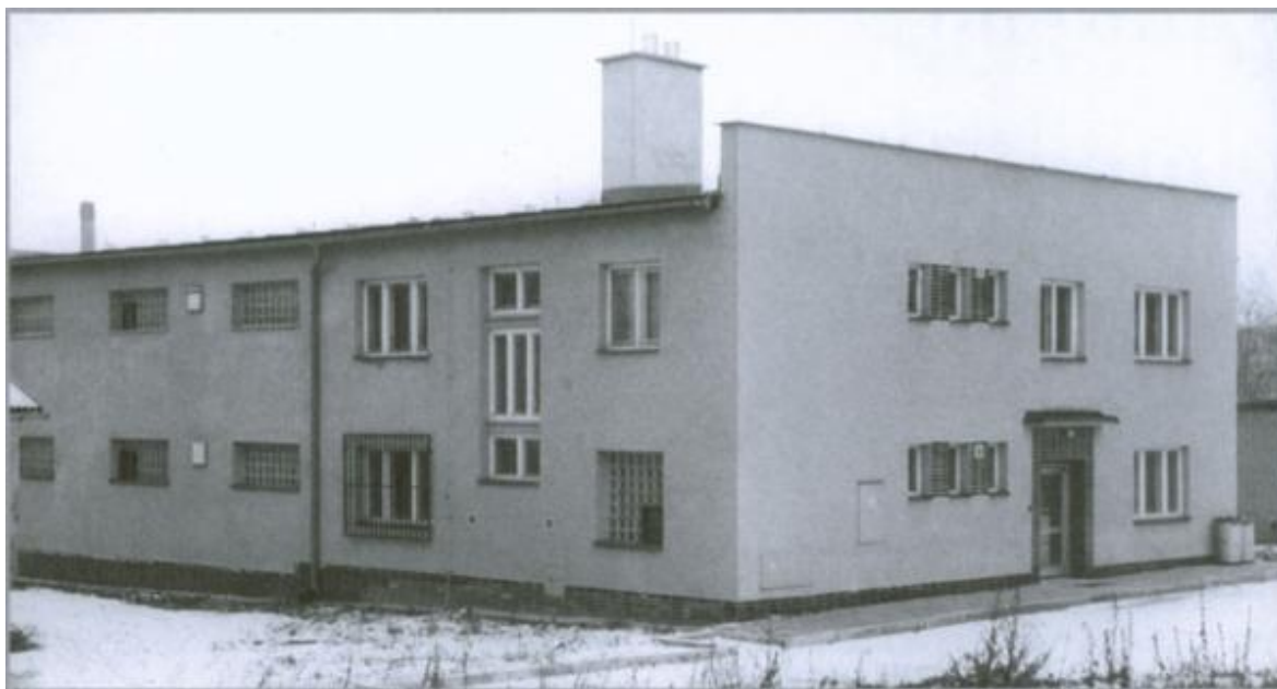
Obrázek 3 – Původní budova v ulici Bratří Čapků