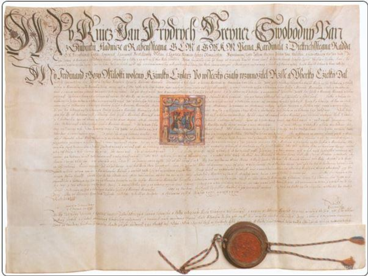
Obrázek 6 - Listina Ferdinanda I.