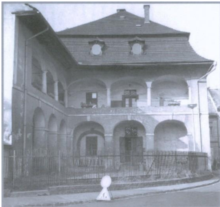
Obrázek 2 – Budova v Kladské ulici