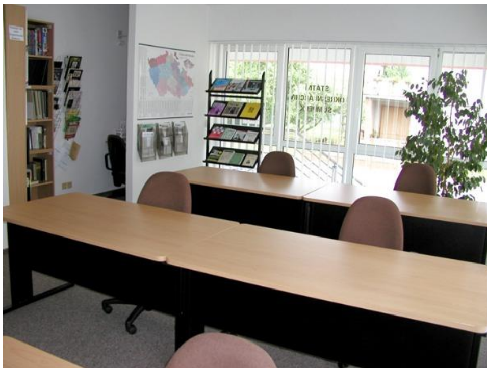
Obrázek 5 – Badatelna