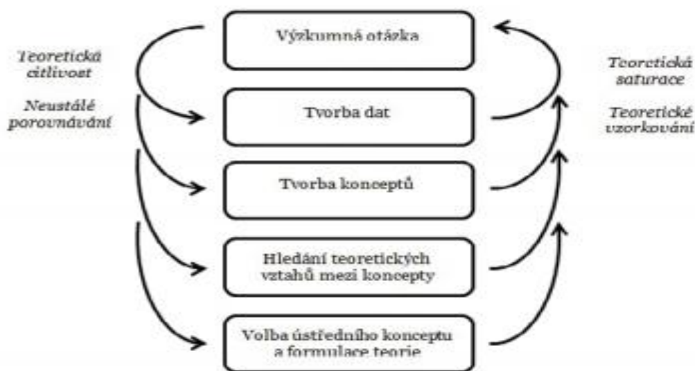
Obrázek č. 1: Schéma výzkumného procesu u metody zakotvené teorie 29

k axiálnímu kódování. Axiálním kódováním se snaží výzkumník o vytvoření souvislostí mezi kategoriemi. Na závěr výzkumník přistoupí k selektivnímu kódování, při kterém jde o identifikaci hlavních témat a zaměřuje se na grafické znázornění jevů. Následně se výzkumník snaží o konceptualizaci příběhu (Švaříček, Šed'ová, 2007: s. 90 – 92) .