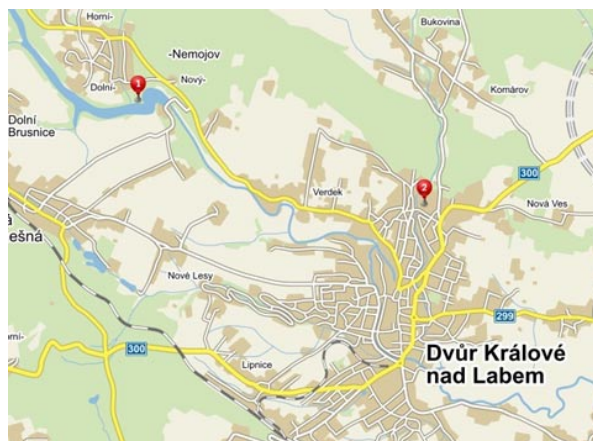
Obr. 4. Lokality odběrů vzorků; 1 – přehrada Les Království, 2 – rybník Podhart'

Cílem této práce bylo ověření možnosti stanovení \text{NO}_3^- přenosným analyzátozem Fotometr PF-12 a porovnání této metody i dosažených výsledků s dalšími postupy stanovení \text{NO}_3^- ve vodách. Vedle Fotometru PF-12 byla použita FIA a SSSNM. Stanovení \text{NO}_3^- bylo nejdříve testováno na modelových roztocích o koncentraci 50 a 15 \text{ mg l}^{-1} . Tyto koncentrace byly vybrány vzhledem k hygienickým limitům pro \text{NO}_3^- v pitné vodě 2 . Dalšími vzorky byly balená voda a pitná voda z veřejné vodovodní sítě. Balená nesycená voda značky ARO od výrobce FONTEA a.s. měla výrobcem deklarovanou koncentraci 11,2 \text{ mg l}^{-1} \text{ NO}_3^- . U vodovodní pitné vody odebrané z veřejné vodovodní sítě na Univerzitě Pardubice nebyl