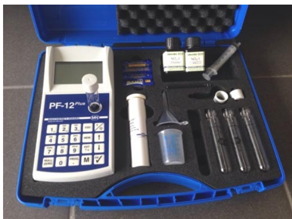
Obr. 1. Přenosný fotometr PF-12 se sadou VISOCOLOR ECO pro stanovení \text{NO}_3^-

pro SSSNM napojená na mikroampérmetr a zahříváná topným tělesem (obr. 2, cit. 10 ) a průtokový analyzátor FIA Compact (MLE, Německo) vybavený softwarem FIA Control 1.0. Pro přípravu standardních roztoků \text{NO}_3^- byly používány analytické váhy (Denver Instrument, USA) a pro dávkování roztoků mikropipety Biohit (Biohit PLC, Finsko). Měření, s výjimkou terénních analýz, probíhala za laboratorní teploty ( 23 \pm 2 °C). Pro měření reakčního času sloužily stopyky.