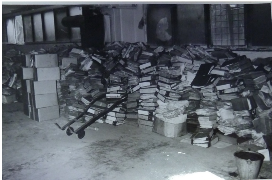
Obrázek 2 Nevhodné a neuspořádané uložení archivního materiálu