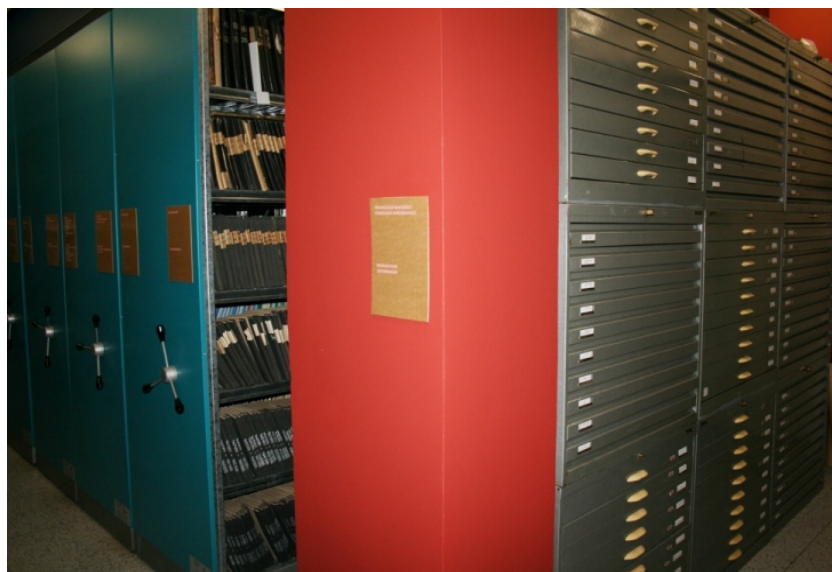
Obrázek 4 Moderní ukládací prostory archivu Škoda Auto