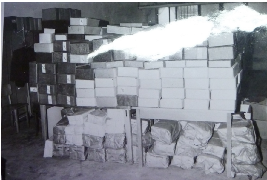
Obrázek 1 Ukládací prostory archivu Škoda Auto Mladá Boleslav v 60. letech