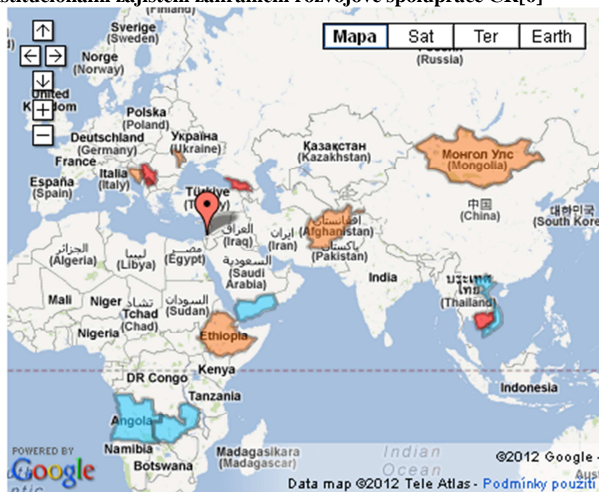
Obrázek 2: Země, ve kterých pomáhá ČRA [3]