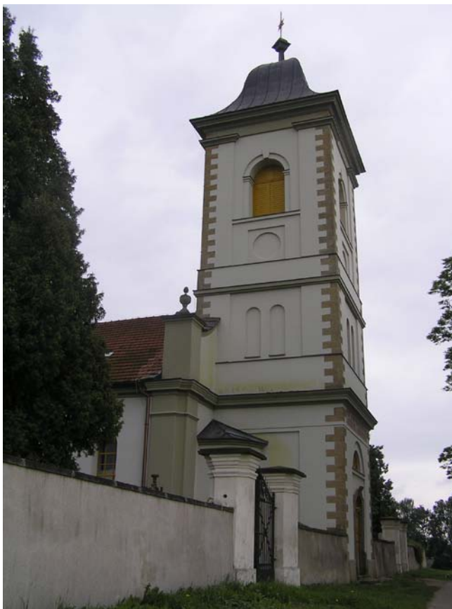
Obr. č. 4