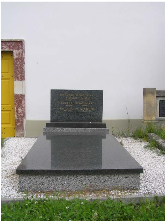
Obr. č. 8