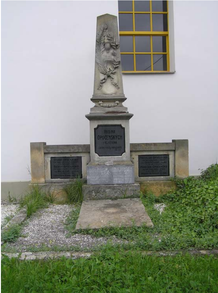
Obr. č. 7