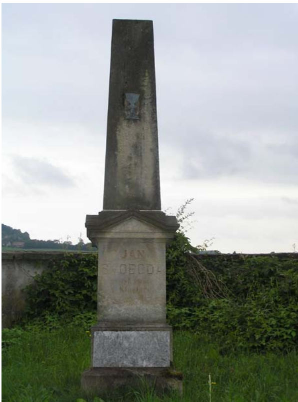
Obr. č. 6