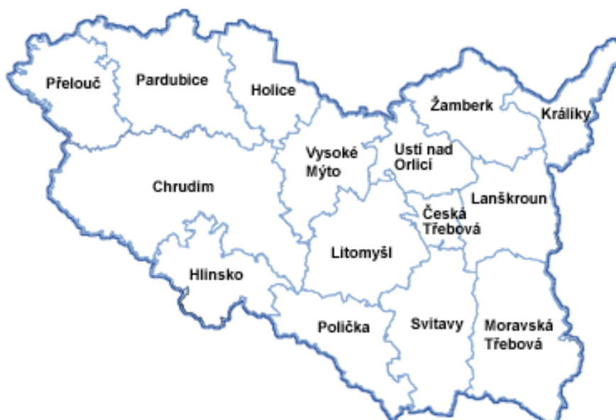
Obrázek 2: Mapa Pardubického kraje

Město Přelouč leží na levém břehu Labe v nadmořské výšce 220 m a je vzdálené 17 km od Pardubic. Na rozloze 30,5 km 2 žije přibližně 10 tis. obyvatel. Převážná část obyvatel žije přímo ve městě a asi 1 tis. obyvatel žije v sedmi místních částech venkovského typu – Klenovka, Lhota, Lohenice, Mělice, Štěpánov a Tupesy. V současné době je Přelouč úřadem III. stupně, tj. obcí s rozšířenou působností pro cca 25 tis. občanů ze 42 okolních obcí. Rozvíjí se zde průmyslová výroba, kultura, ale město žije i sportem [7].