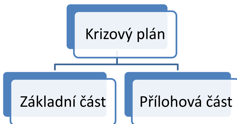
Obrázek 1: Struktura krizového plánu

Krizový plán se zpracovává ve standardizované písemné a elektronické podobě a skládá se ze základní a přílohové části. Povinnost zpracovávat krizový plán mají ústřední orgány státní správy, ministerstva a územně samosprávné celky (kraj, obec). Právnické a podnikající fyzické osoby krizový plán zpracovávají jen na výzvu příslušného orgánu krizového řízení, jinak vypracovávají plán krizové připravenosti, jehož struktura je srovnatelná s plánem krizovým [28].