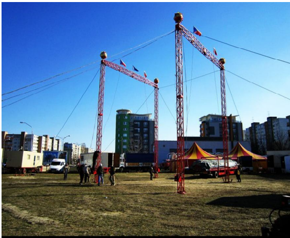
Obrázek 1 Při stavbě šapitó, se jako první vztyčují hlavní stožáry