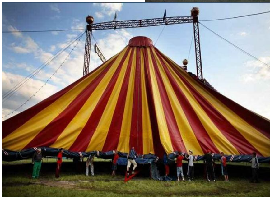
Obrázek 4 Natahování cirkusového šapitó, je jednou z nejtěžších věcí. Najednou jsou kolem něho desítky chlapů