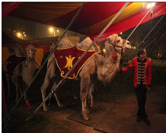
Obrázek 1 Příprava na vystoupení s velbloudy