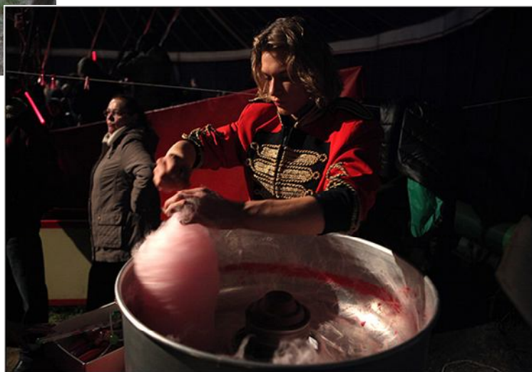
Obrázek 4 Možnost občerstvení během přestávky a po představení