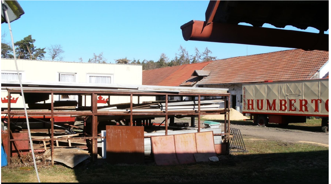
Obrázek 6 jsou zde uloženy všechny věci na sezónní opravy