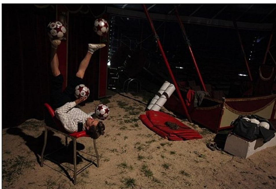
Obrázek 4 trénink nožního žonglování