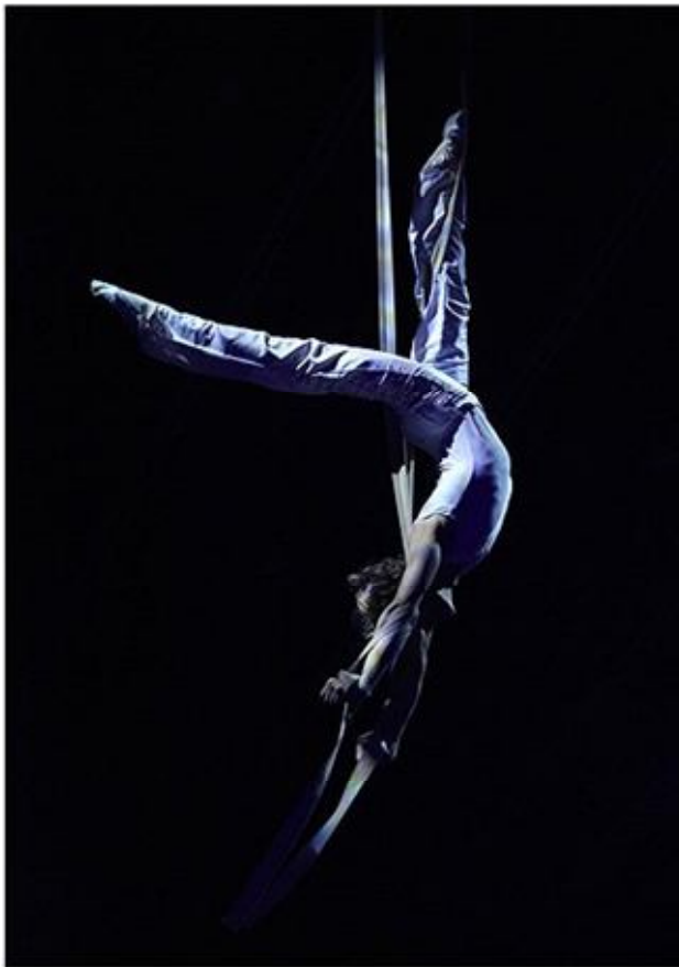
Obrázek 4 Představení Antonia s číslem Washington Trapez