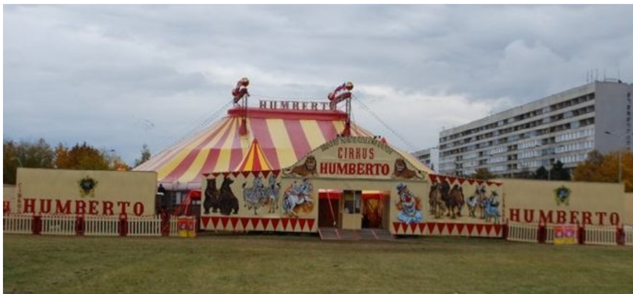
Obrázek 1 Cirkus Humberto na Proseku