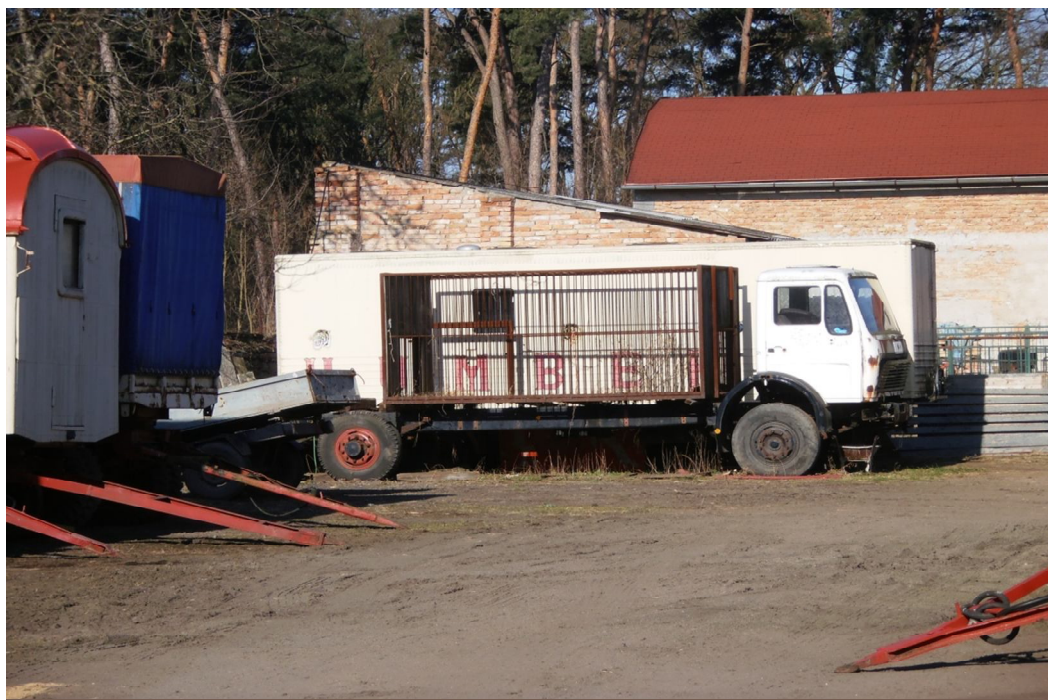
Obrázek 4,5 Odstavené vozy, čekající na opravy