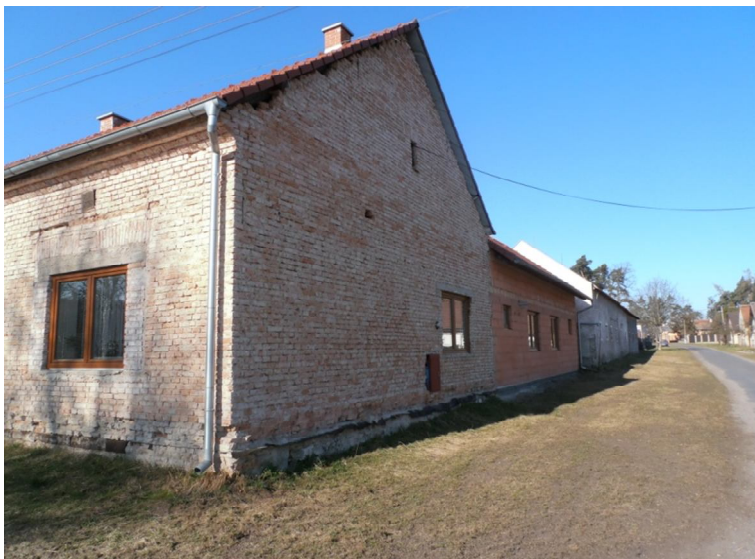
Obrázek 1,2 Bytové prostory