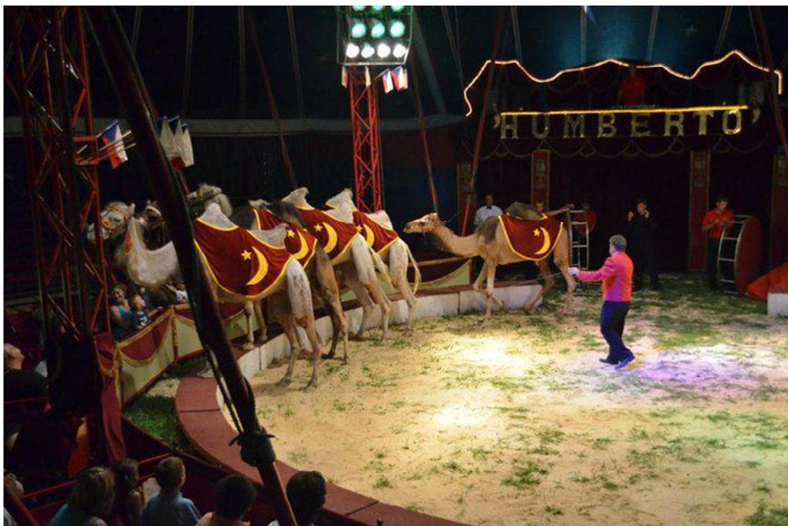
Obrázek 1 Vystoupení s velbloudy pod vedením Hynka Navrátila st.