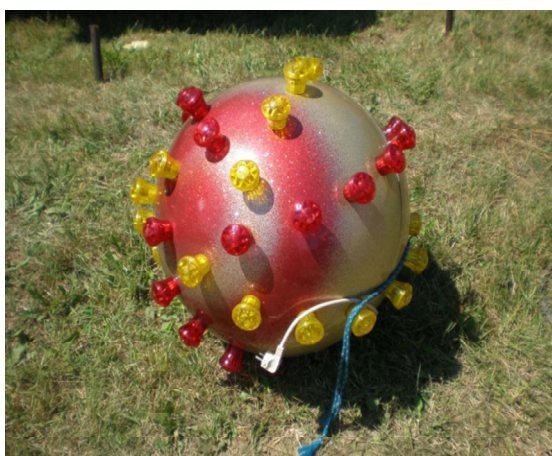
Obrázek 3 Svítící koule, jež se tyčí na stožárech