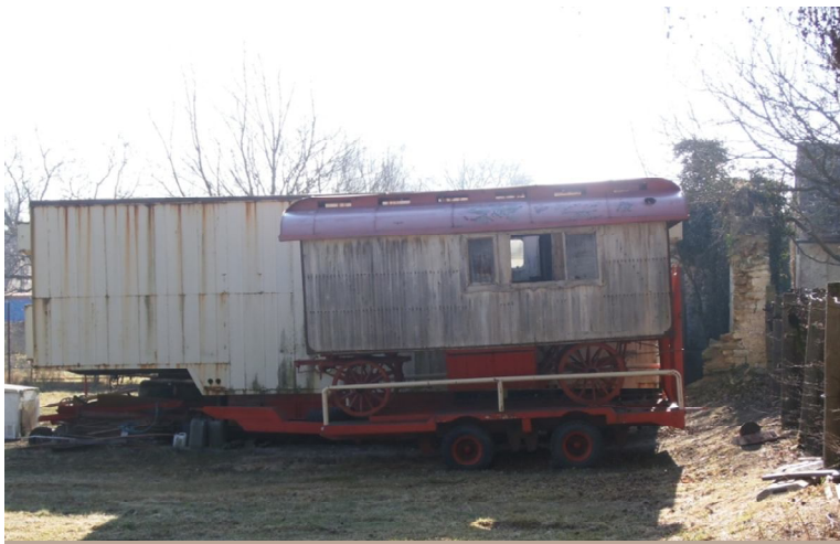
Obrázek 7,8 vozy, které potřebují opravit