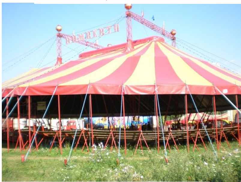
Obrázek 6 Vrchní část stanu s galerií