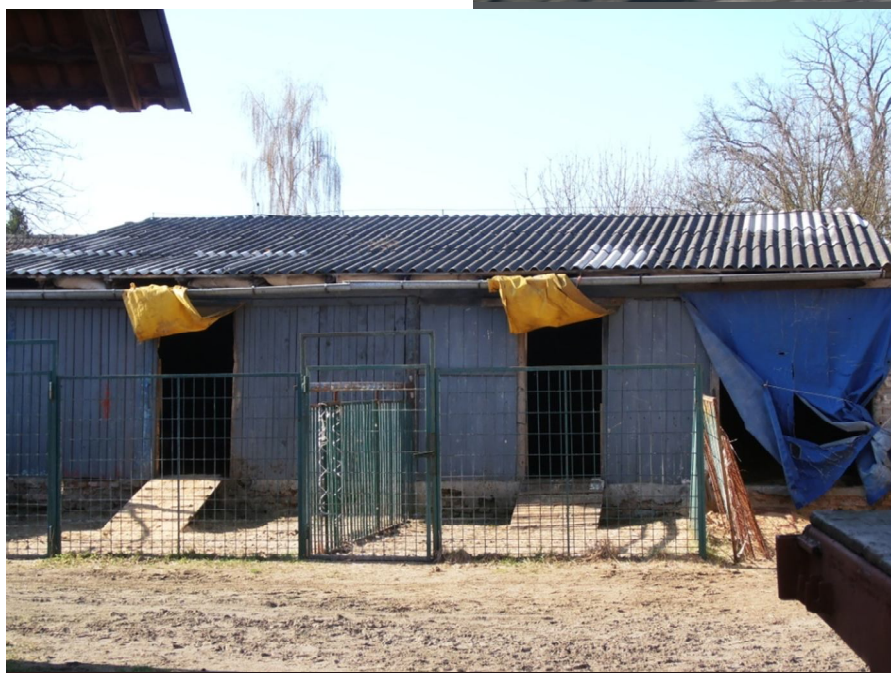
Obrázek 3 Ustájení pro zvířata