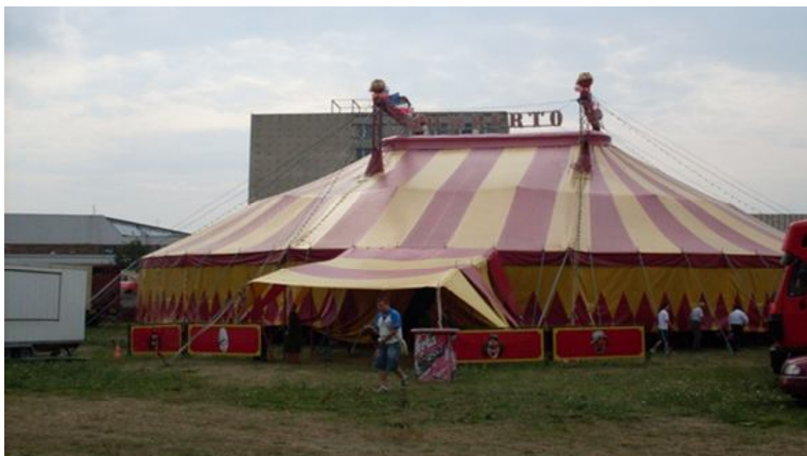
Obrázek 7 Celé dílo je hotovo