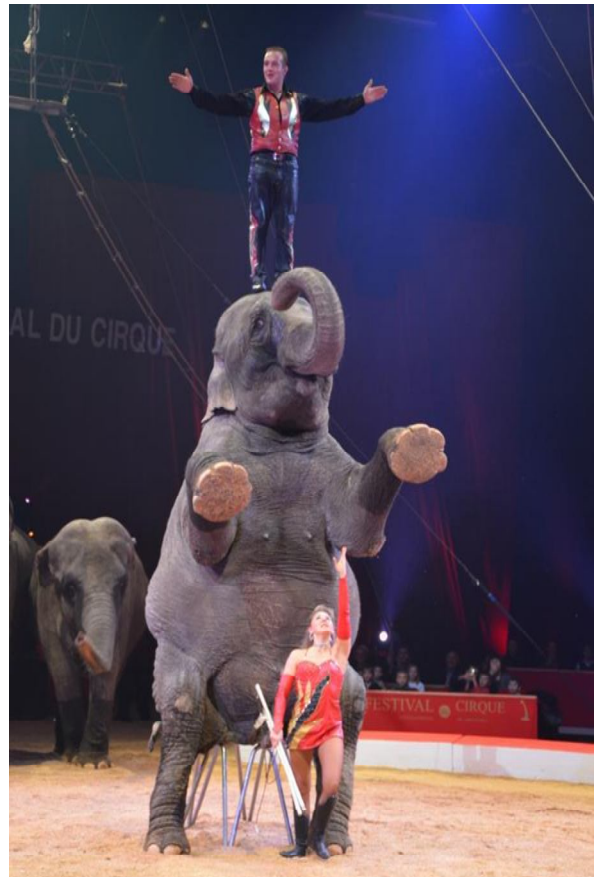
Obrázek 5 Vystoupení manželů Spindler se slony