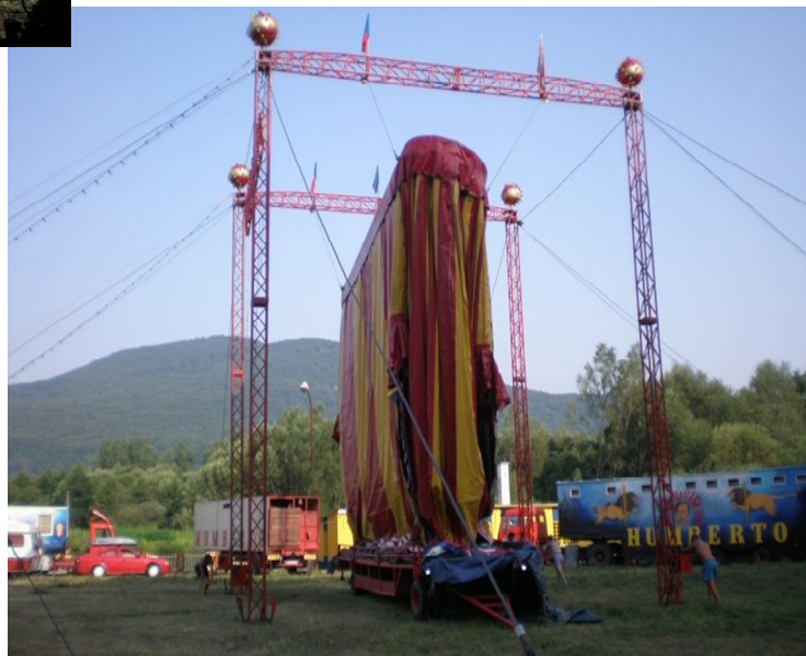
Obrázek 2 Poté je vše připravené k zvednutí šapitó