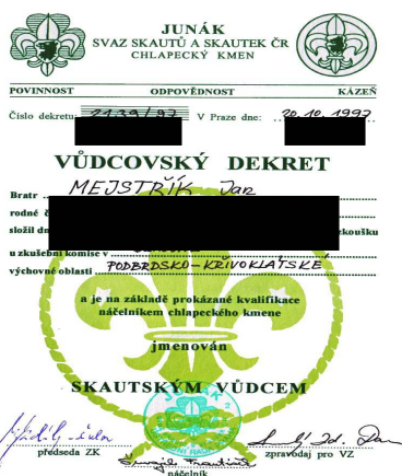
obr. č. 6 Osvědčení o vykonané vůdcovské zkoušce