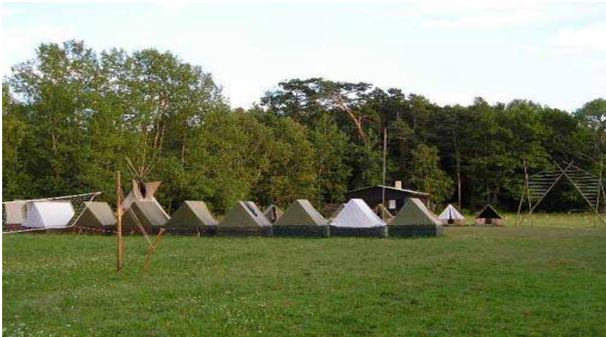
Obr. č. 2 Skautská základna Žumberk