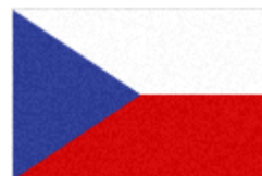
obr. č. 8 Velký státní znak obr. č. 9 Malý státní znak obr. č. 10 Státní vlajka