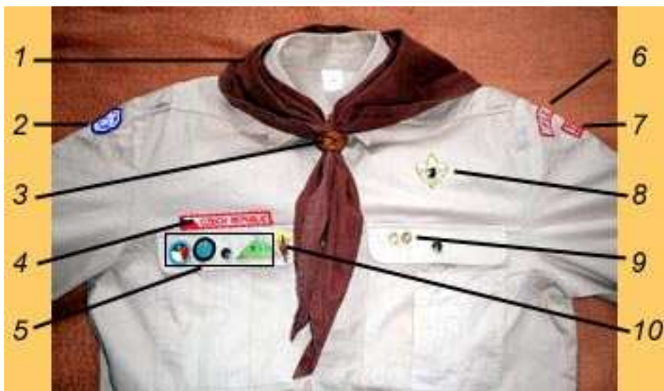
Obr. č. 7 Skautský kroj 63 autor: Alena Gígalová, vedoucí pardubických skautek