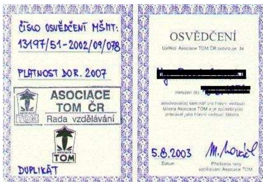
obr. č. 4, Osvědčení A-TOM ČR o absolvování kurzu hlavního vedoucího