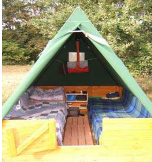
obr. č. 1 Podřadový stan