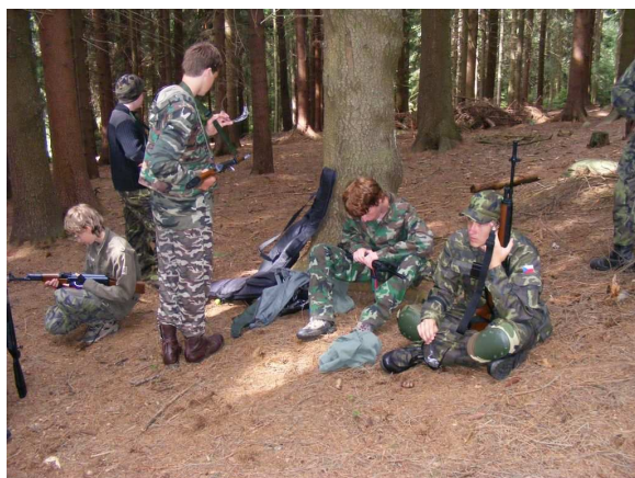
Obr. č. 3 Děti v lese hrají airsoftové hry

jejich programu i duchovní rozvoj, je samozřejmostí vyprávění duchovních příběhů, které mají nějakou pointu. V chaloupkách jsou děti vedeny a vychovávány v duchu křesťanských hodnot. Tyto tábory však nejsou určeny pouze pro děti z křesťanských rodin. Na chaloupky jezdí také mnoho nevěřících dětí, ať už proto, že mají rády atmosféru, která na nich panuje, nebo kvůli kamarádům. Nevěřící děti do náboženských aktivit nenutí. Navíc modlitby probíhají formou zpívaných písniček, účast na nich je dobrovolná. Stejně tak i o nedělích, kdy jsou mše svaté. Místo účasti na mši je možný jiný program.