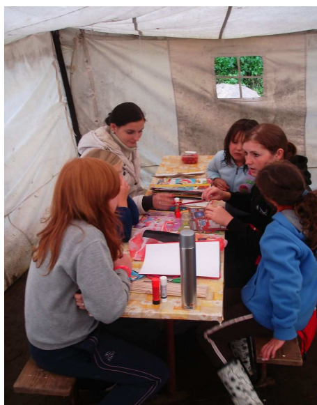
Obr. č. 7 Rukodělné práce, výroba korálků z papíru autor: Jiří Šembera, táborový vedoucí

Program se kvůli počasí a nenadálým situacím může různě měnit, když je pěkné počasí, děti se chodí koupat do místního koupaliště, během tábora proběhne několik výletů. Program také zpestřují návštěvy šermířských nebo airsoftových skupin. Program bývá velmi rozmanitý.