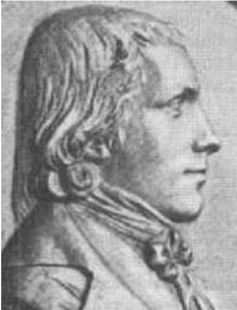
Wilhelm Heinrich Wackenroder