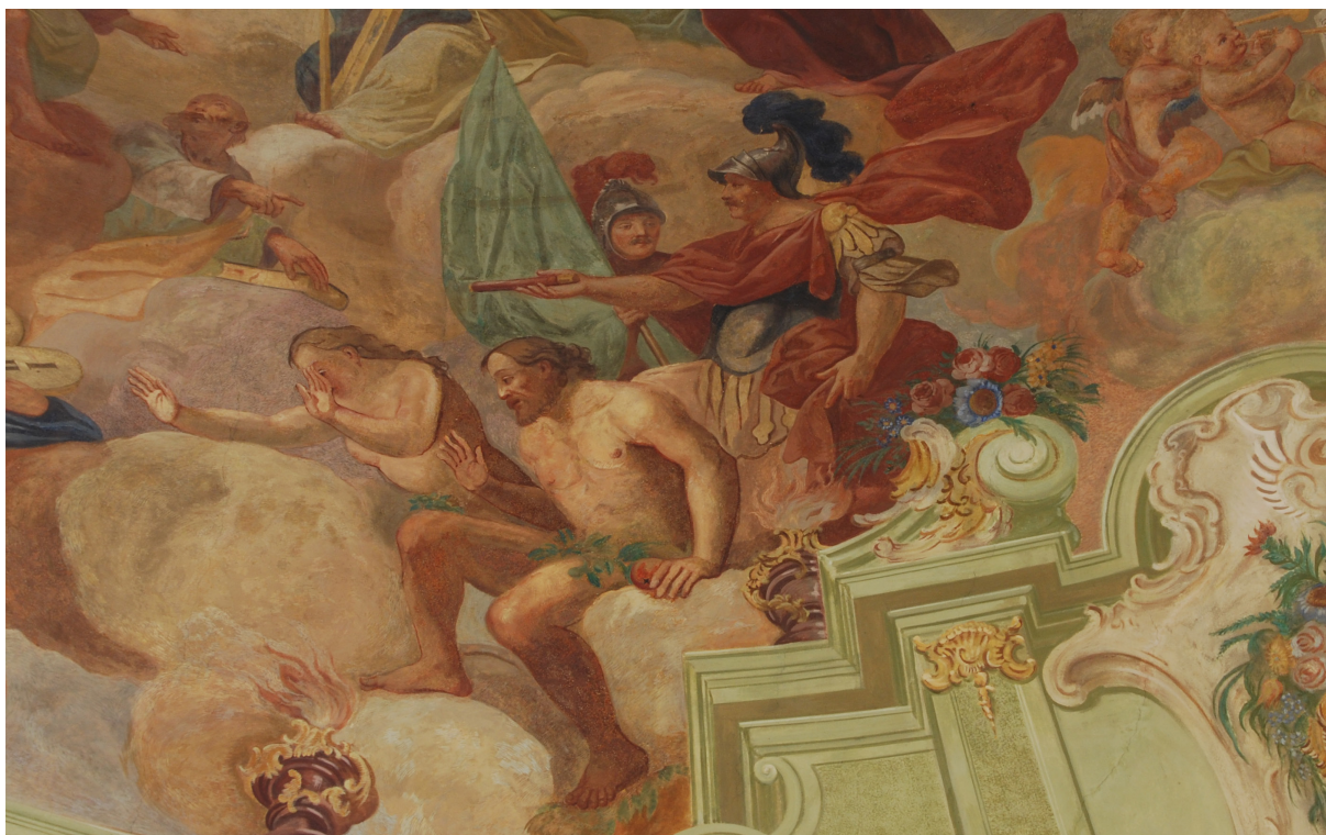
Obr. 52: Část malby v klenbě lodi, dva vojáci a Adam s Evou. V restaurátorské dokumentaci z roku 1991 zkouškou čištění zjištěno, že se jedná z velké části o rekonstrukci od. H. A. Joukla. Zaretušované zkoušky čištění viditelné v přilbě a praporu levého vojáka a před obličejem pravého.