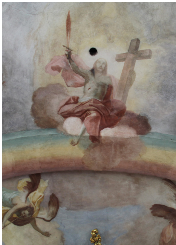
Obr.40: J. T. J. Supper, Kristus ve scéně Posledního soudu v kapli Panny Marie Ochránitelky v Tatenici. Světlá místa jsou rekonstrukce z restaurování v roce 1994.