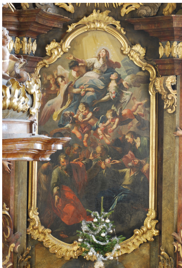
Obr. 29: Detail oltářního obrazu Nanebevzetí Panny Marie.