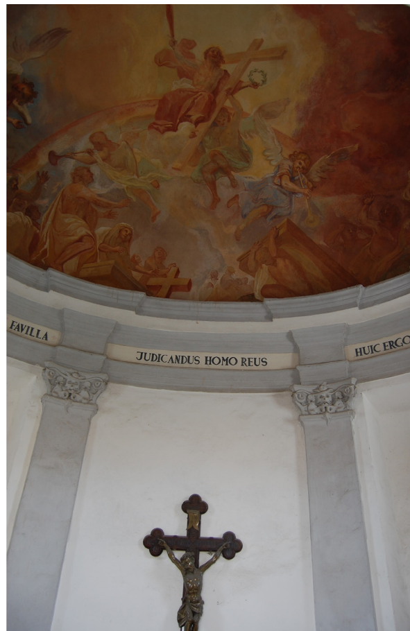
Obr. 34: Pohled na část klenby na přední straně kostnice.