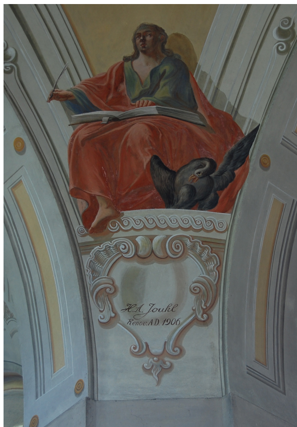
Obr. 66: Kostel sv. Ducha v Libáni, detail nástropní malby. V kartuši pod postavou apoštola sv. Jana podepsán autor opravy H. A. Joukl.