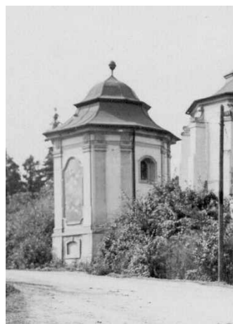
Obr. 6: Detail čelní strany kostnice.

Ve štukovém rámu je patrná již polozničená freska, pravděpodobně Ukřižování. 2