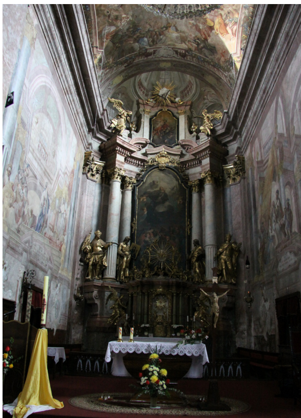
Obr. 36: Presbytář kostela Nanebevzetí Panny Marie v Moravské Třebové. Nad oltářem olejomalba od J. T. J. Suppera. Nad ní iluzivní průhled do kupole s kuželkovou balustrádou.