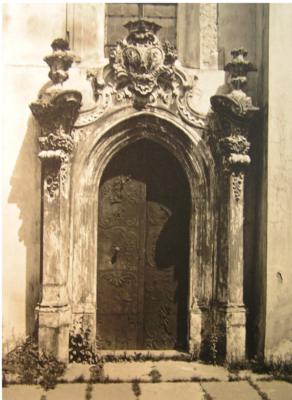
Obr. 11: Gotizující profilovaný portál na jižní straně kostela. Po stranách polopilíře s rokajovou dekorací a s vázami nahoře. Uprostřed štítu v kartuši erby.