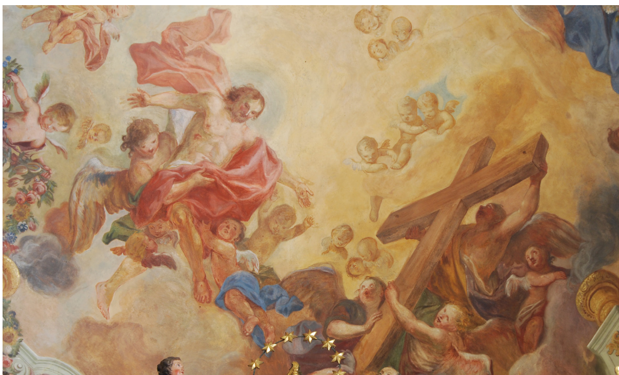
Obr. 38: Detail Krista a kříže na malbě v klenbě presbytáře kostela Nanebevzetí Panny Marie ve Slatinách.