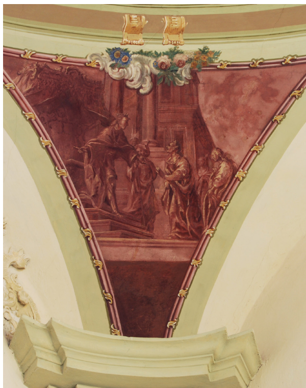
Obr. 23: Bestabé před Šalamounem.

Monochromní malby v pendantivech kupole: Čtyři ženy jako předobrazy Panny Marie ve Starém Zákoně.