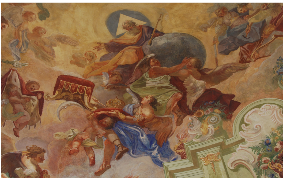
Obr. 44: J. T. J. Supper, postava Boha Otce ve stejné pozici. Detail ze scény Salve Regina v klenbě lodi kostela ve Slatinách.