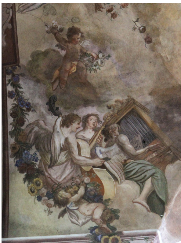
Obr. 45: J. T. J. Supper, andělé hrající na varhany a basu. Detail z klenby presbytáře farního kostela v Moravské Třebové.