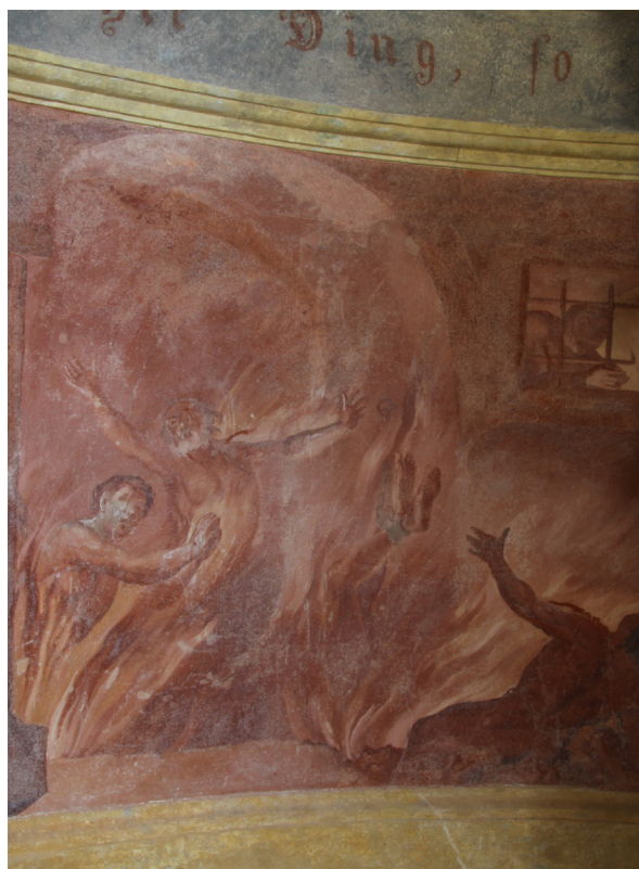
Obr. 51: J. T. J. Supper, zobrazení pekla, detail levé části stěny za oltářem v kapli Panny Marie Ochránilky v Tatenici.