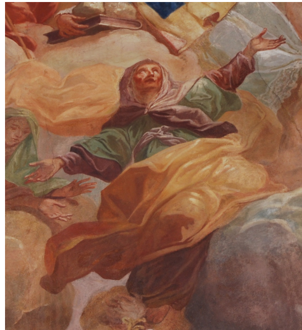
Obr. 21: Sv. Anna, matka Panny Marie. Detail ze scény Salve Regina.