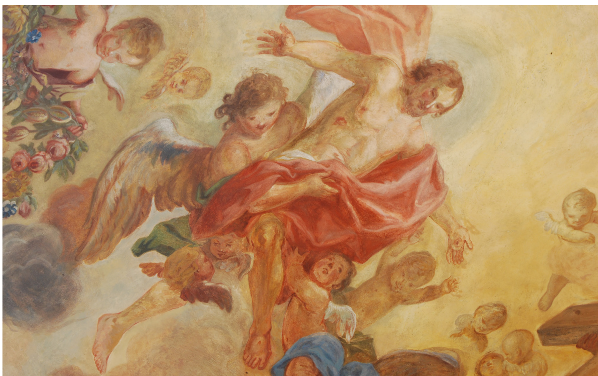
Obr. 61: Kristus, malba v presbytáři kostela. Podle restaurátora Miroslava Křížka je tato postava zachovaná originální malba od J. T. J. Suppera. Zřetelné jsou pentimenti za dlaněmi Krista.