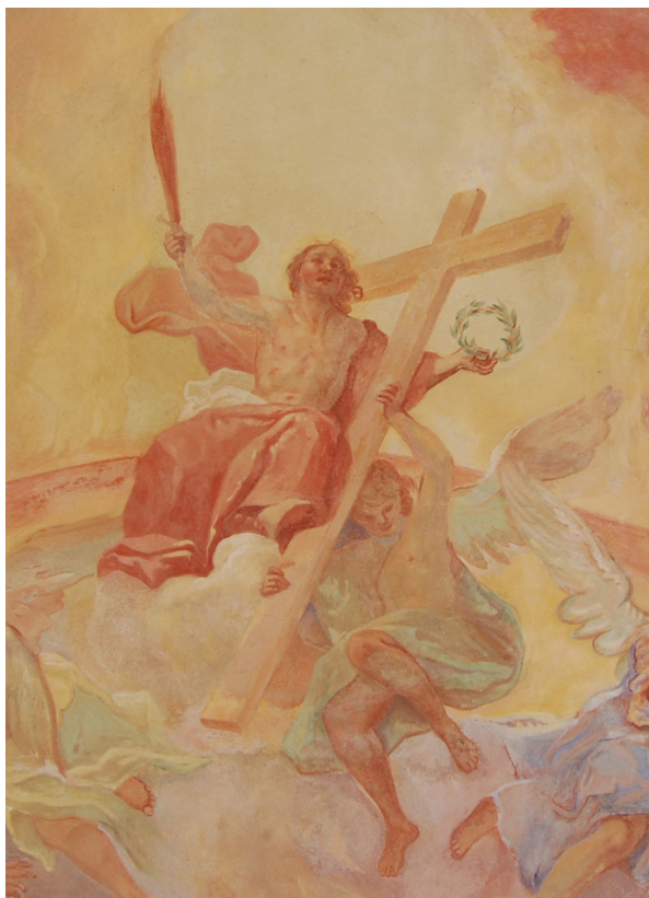
Obr. 39: J. T. J. Supper, Kristus na duze ve scéně Posledního soudu v kostnici ve Slatinách.