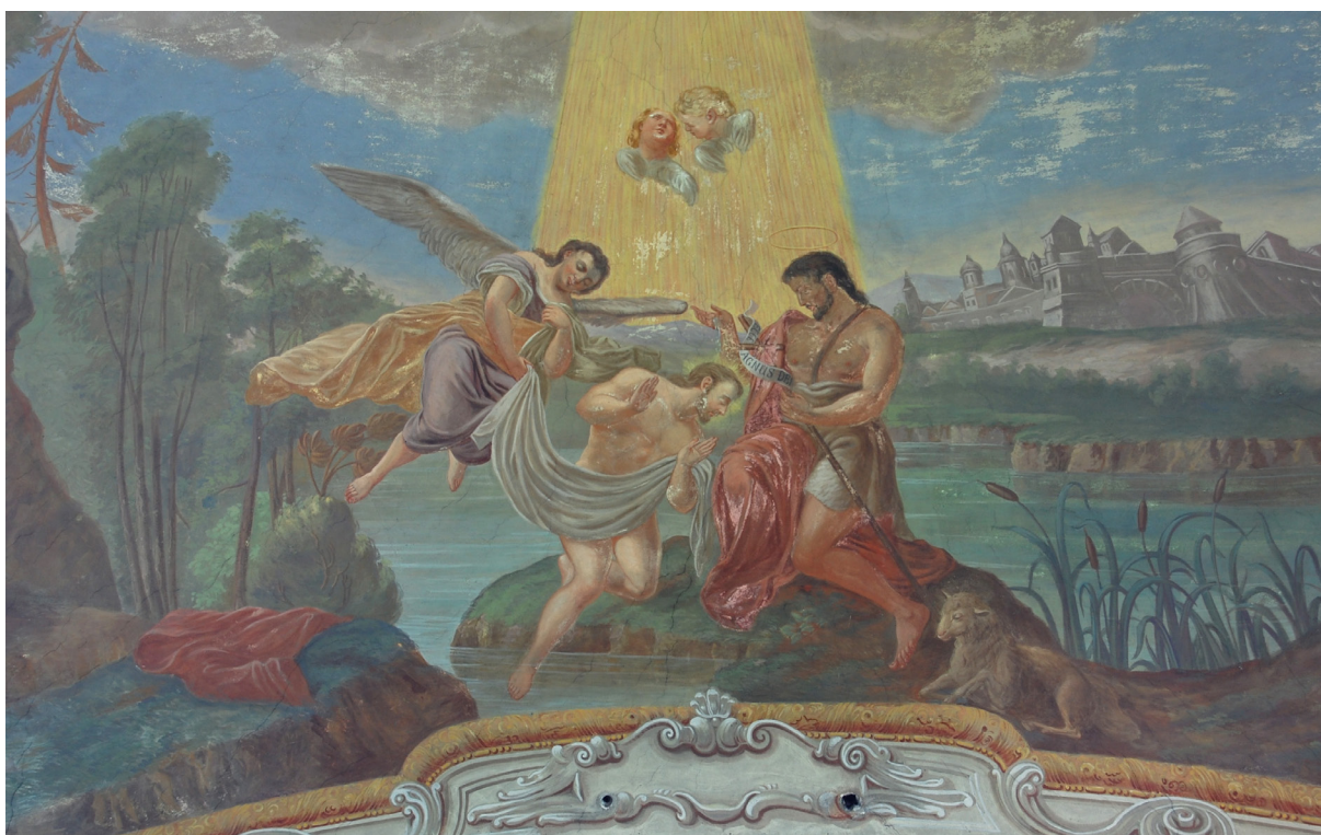
Obr. 64: Kostel sv. Ducha v Libáni u Jičína, nástropní malba Josefa Haagera z roku 1755, detail. Malba restaurována v roce 1906 H. A. Jouklem, pravděpodobně přemalována. Zřetelné poškození barevné vrstvy, malba se odlupuje.