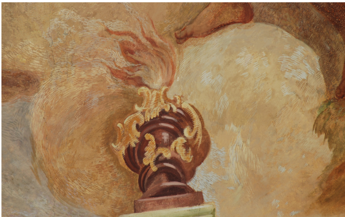
Obr. 60: Čárková retuš, detail z klenby lodi. Restaurátorský zásah z roku 1992. Foto z roku 2009.