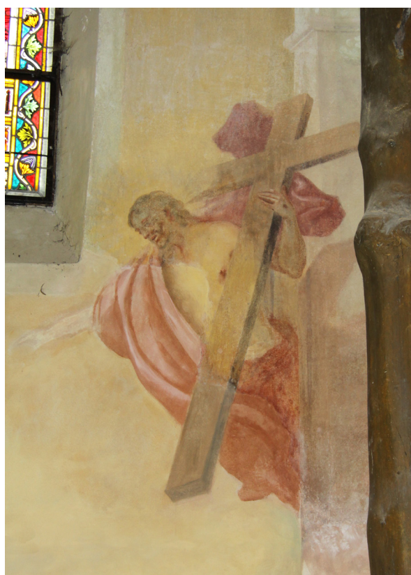
Obr. 42: J. T. J. Supper, Kristus na stěně presbytáře kostela Nalezení sv. Kříže v Moravské Třebové. Světlá místa jsou patrně rekonstrukce z restaurování v roce 1996.