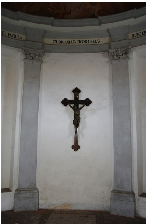
Obr. 33: Vnitřní čelní strana kostnice. Pilastry zdobené vlysem s lebkou.