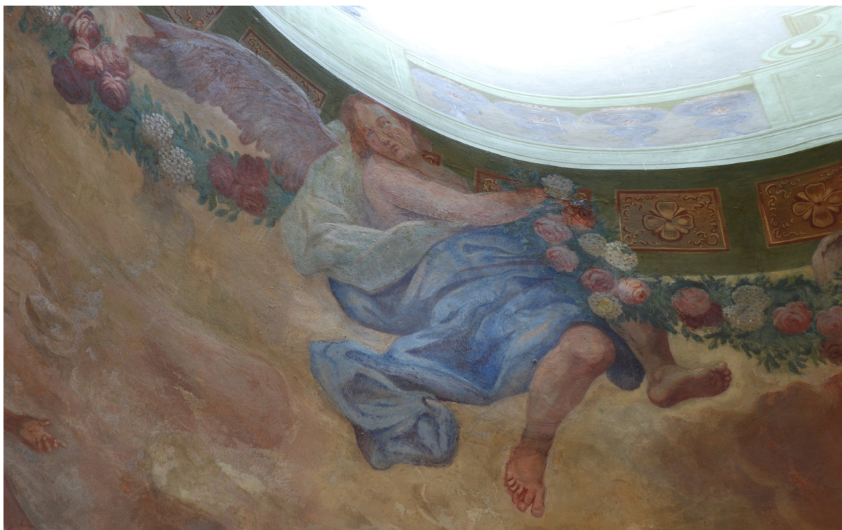
Obr. 58: "Anděl s šesti prsty na pravé noze." Detail z horní části klenby lodi. Přes kotník nohy anděla lze vidět hranici mezi světlejší, dobře zachovalou částí malby nahoře a tmavší a více poškozenou malbou dole. Tyto části se liší i v malířském stylu. Podle restaurátora Miroslava Křížka je vrchní, dobře zachovalá část malby pravděpodobně originální malba J. T. J. Suppera.