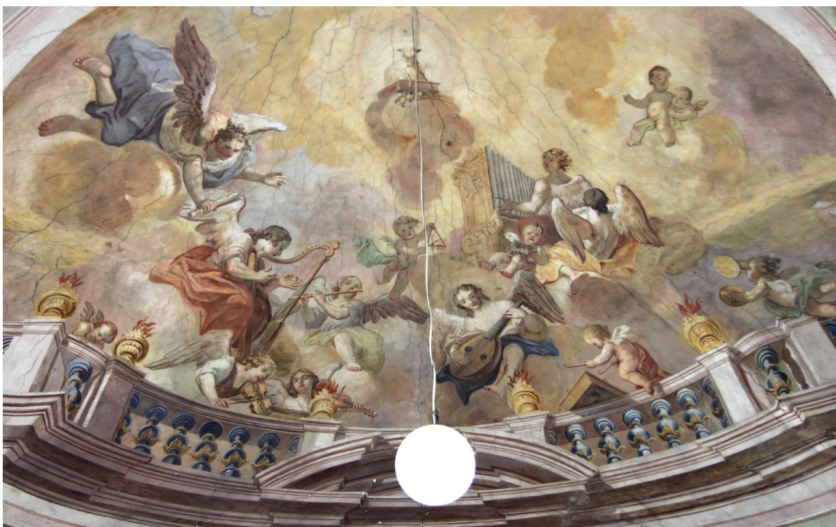
Obr. 47: J. T. J. Supper, skupina hrajících andělů, vymalováno v klenbě nad kůrem kostela sv. Jana křtitele v Tatenici.