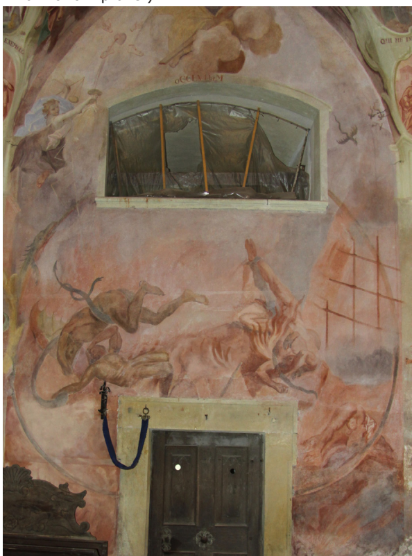
Obr. 50: J. T. J. Supper, duše úpící v pekle. Pravá stěna presbytáře v kostele Nalezení sv. Kříže v Moravské Třebové.