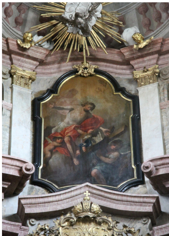
Obr. 37: Obraz Vzkříšení Krista 4 od J. T. J. Suppera v presbytáři kostela Naneb. P. Marie v Moravské Třebové. Kristus zobrazen ve stejné pozici, jako na klenbě presbytáře kostela ve Slatinách. (4: Petr Šabaka, výklad ikonografie maleb v kostele)