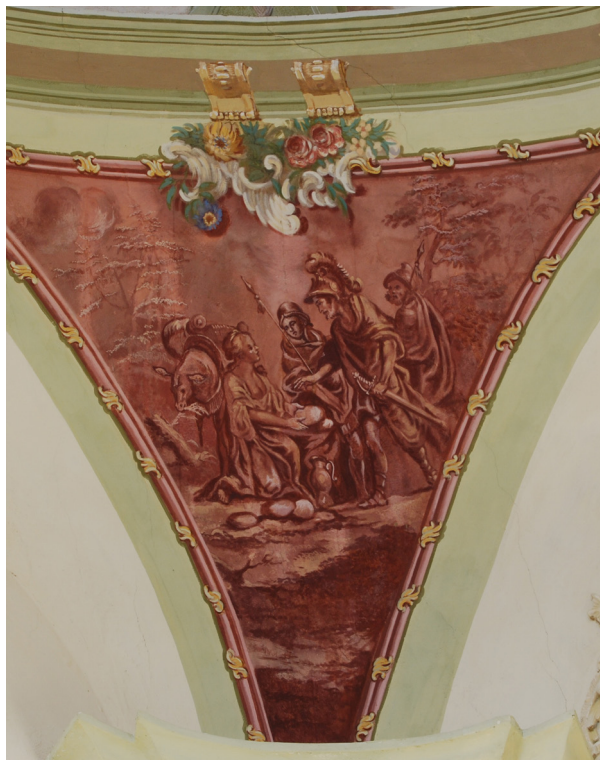
Obr. 25: Abigail klečící se smírnými dary před králem Davidem.