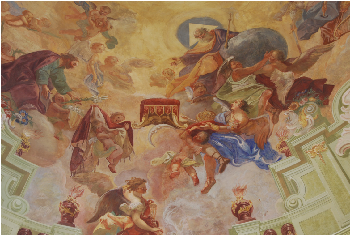
Obr. 15: Hlavní událost na východní straně kupole: Na srpku měsíce trůn připravený pro Pannu Marii, okolo andělů nesoucí hermelínový plášť, korunu a žezlo. Nad trůnem se naklání Bůh Otec se žezlem v ruce, opírající se zeměkouli, zleva sv. Josef s lilíí.