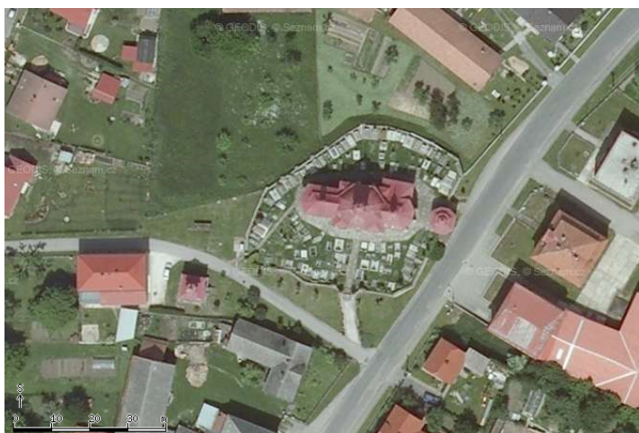
Obr. 2: Letecký snímek areálu kostela a hřbitova ve Slatíně.

Kostel je orientovaný presbytářem na východ, vhlavní vstup do kostela se nachází na jižní, podélné straně lodi. Rokoková kovexně-konkávně prolamovaná kamenná zeď s hlavní bránou je dochovaná v autentické podobě na jižní straně 1 . Na východní straně za presbytářem je zachovaná jedna z původních čtyř kaplí.