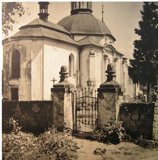
Obr. 8: Předsíň kostela, v popředí branka na západní straně hřbitovní zdi, pilíře zakončené lebkami.