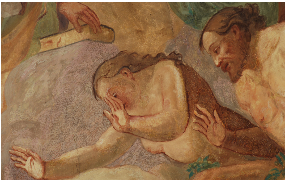
Obr. 53: Adam a Eva, detail. Rekonstrukce H. A. Joukla z konce 19. století. V pozadí viditelná světle fialová čárková retuš z roku 1992.