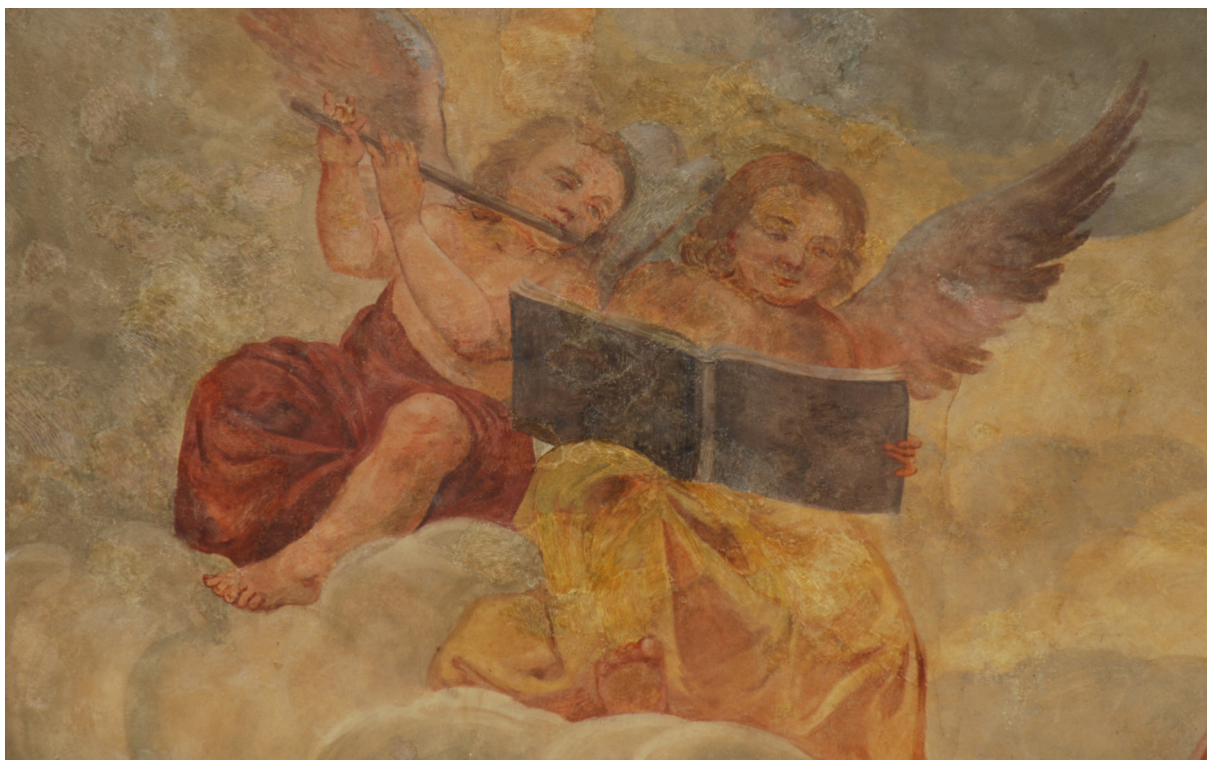
Obr. 56: Detail hrajících andělů v zadní části klenby lodi, rekonstrukce H. A. Joukla. Velké procento tmelů a retuší pochází z posledního restaurátorského zásahu v roce 2004.