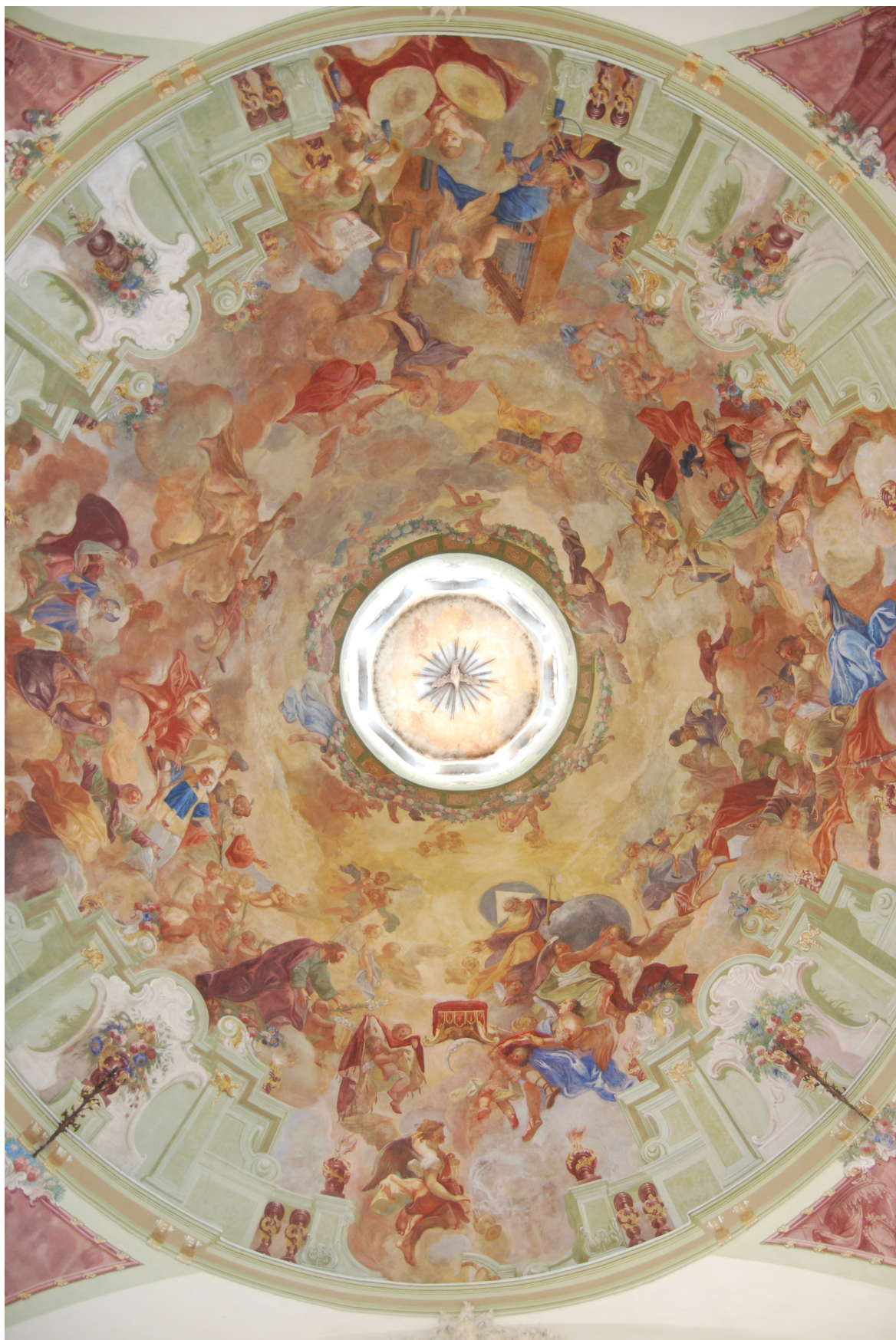
Obr. 14: Malba v oválné kupoli hlavní lodi, výjev Salve Regina. Na pravé straně, směrem k presbytáři kostela, anděl s kadidelnicí, nad ním trůn připravený pro Pannu Marii a skupina postav s Bohem Otcem. Na levé straně, směrem ke kůru, skupina zpívajících a hrajících andělů oslavujících Pannu Marii. Uprostřed průhled do lucerny, v ní namalování andělů a ze dřeva vyřezaná podoba Ducha svatého jako holubice. Okolo celého výjevu v kupoli, iluzivního průhledu do nebe s postavami svatých a andělů, obíhá iluzivní malovaná architektura a kuželková balustráda (patrná na dalších fotografiích).