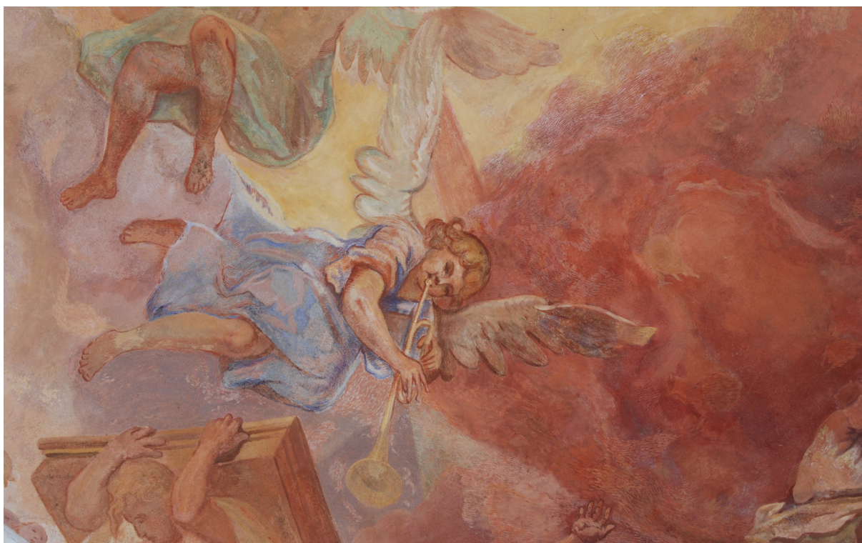
Obr. 63: Detail malby Posledního soudu v kostnici. Světlé čárkové retuše mezi přechodem červené a žluté v oblacích. Postava anděla v modrém rouchu s trubkou je z velké části rekonstrukce M. Křížka a P. Padevěta z roku 1993.