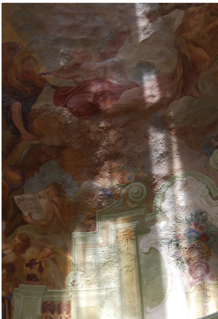
Obr. 55: Detail zadní části kupole lodi. Výrazný reliéf nerovné a poškozené omítky. Foto v přirozeném ostrém bočním světle dopadajícím okny v lucerně uprostřed kupole.