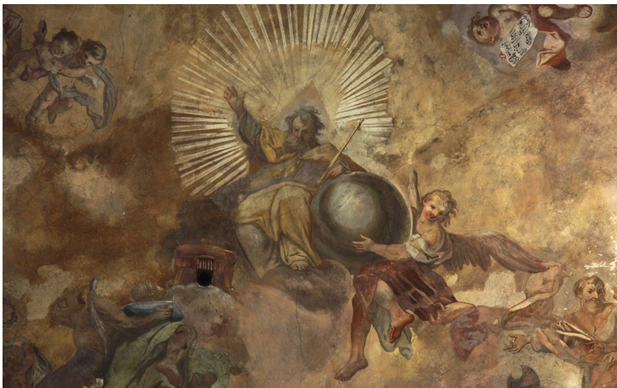
Obr. 43: J. T. J. Supper, postava Boha Otce žehnajícího trůnu, se žezlem v ruce, opírající se o zeměkouli nesenou andělem. Detail z klenby presbytáře farního kostela Nanebevzetí Panny Marie v Moravské Třebové.