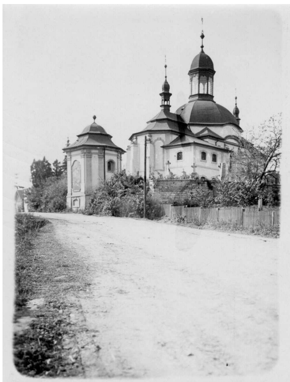
Obr. 5: Kostel a kostnice ve Slatíněch, tentýž pohled.