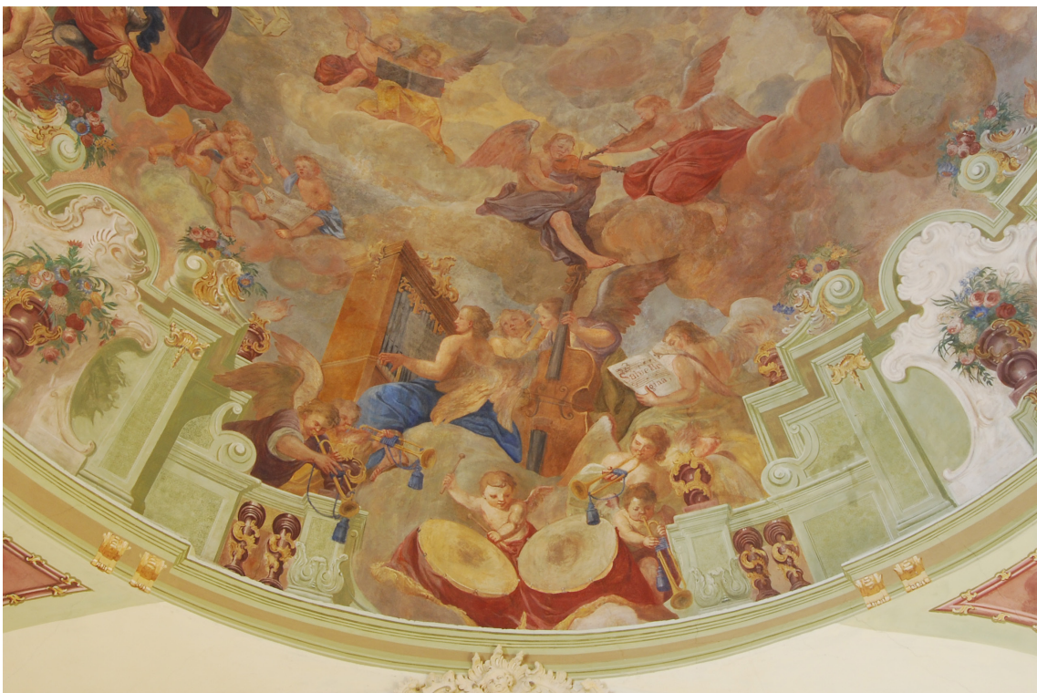
Obr. 18: Skupina zpívajících a hrajících andělů na západní straně kostela, směrem ke kůru.