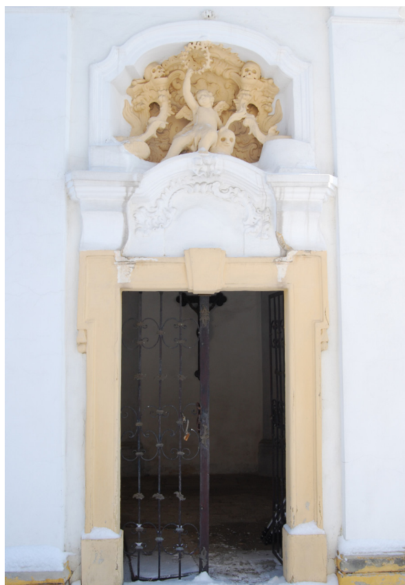
Obr. 10: Detail vstupu do kostnice. Nad vchodem reliéf s rokokovým ornamentem, lebkami a andílkem smrti.