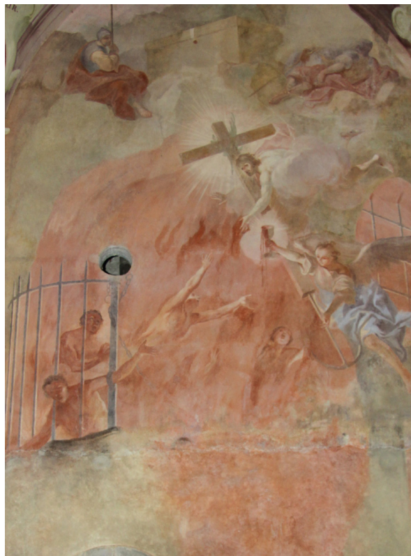
Obr. 49: J. T. J. Supper, Kristus přinášející naději duším v předpekli. Detail z levé stěny presbytáře kostela Nalezení sv. Kříže v Moravské Třebové.