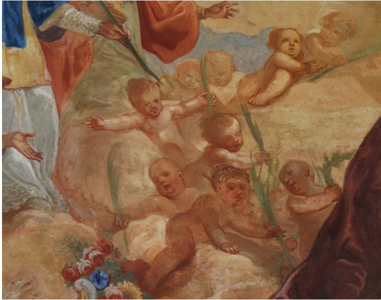
Obr. 19: Betlémská neviňátka s palmovými ratolestmi. Detail ze scény Salve Regina.