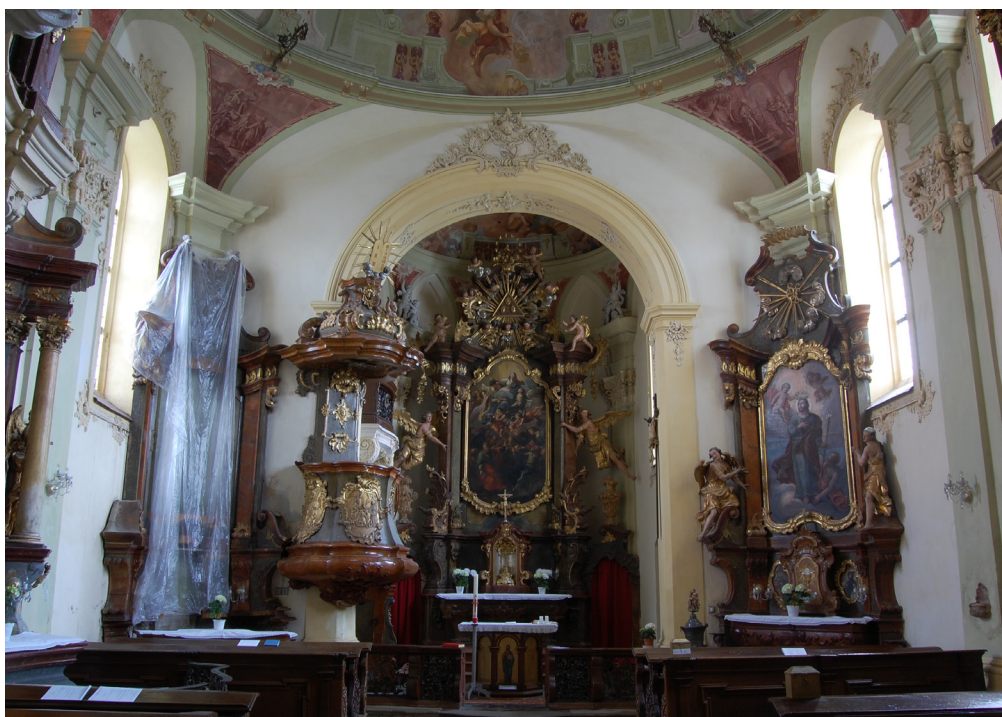
Obr. 27: Pohled do lodi a presbytáře kostela. Na pravé straně postranní oltář s obrazem sv. Josefa, pravděpodobně J. T. J. Suppera. Na levé straně straně obraz sv. Felixe, nyní patrně v péči restaurátorů. Foto z roku 2010.