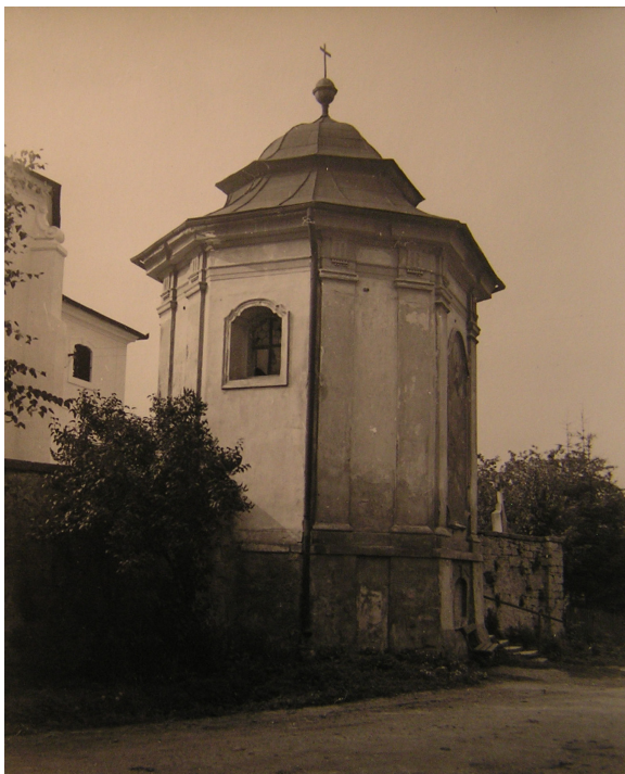
Obr. 7: Kostnice, pohled z jižní strany. Na čelní stěně malba. Foto z roku 1944.