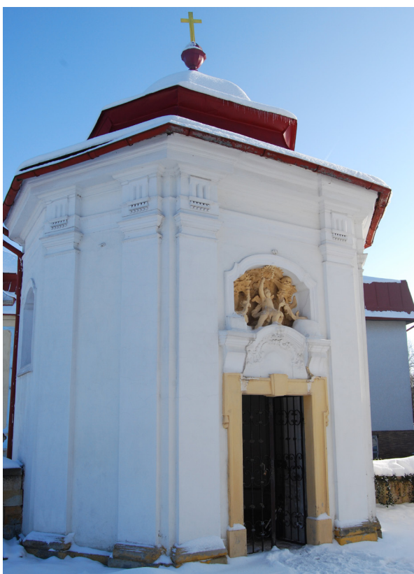
Obr. 9: Kostnice, přední strana a vstup. Pohled ze hřbitova, od kostela. Foto z konce roku 2009.