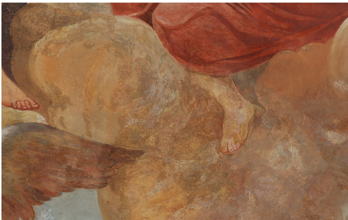
Obr. 59: Světlá čárková retuš přes ztmavlá místa malby, detail v klenbě lodi. Restaurátorský zásah z roku 1992. Foto z roku 2009.