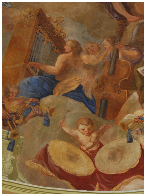
Obr. 46: H. A. Joukl podle kopií maleb J. T. J. Suppera, hrající andělé, detail západní části kupole lodi ve Slatinách, scéna Salve Regina.