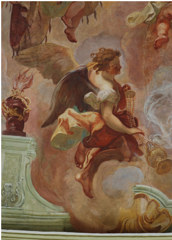
Obr. 20: Anděl s kadidelnicí. Detail ze scény Salve regina. Mezi andělem a kadidelnicí pravé části lze vidět svislou hranici dělící dobře zachovanou a pravděpodobně originální Supperovu malbu anděla a mnohem hůře zachovanou malbu pozadí vpravo.