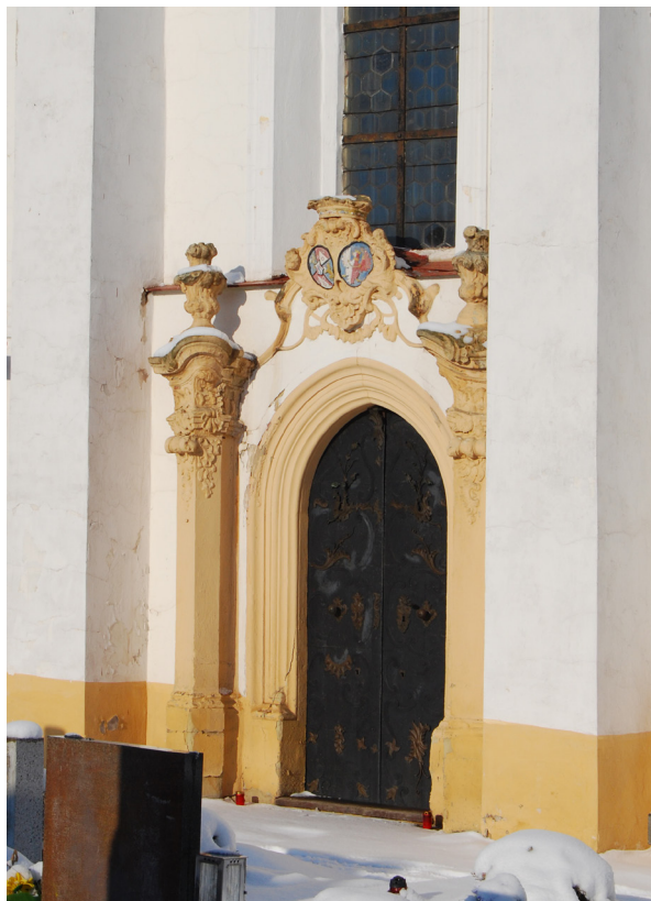
Obr. 12: Tentýž portál.