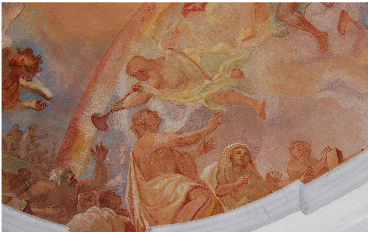
Obr. 62: Detail malby Posledního soudu v kostnici. Výrazné světlé, pravděpodobně časem barevně změněné, čárkové retuše v duze kolem trubky anděla, v modrém pozadí a na rameni probuzeného mrtvého, pocházející z resaturování v roce 1993. Foto 2009.