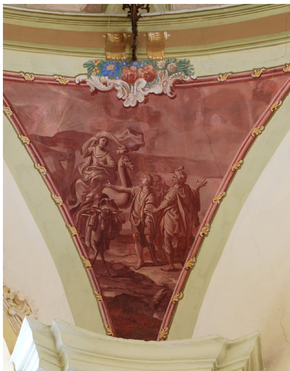
Obr. 24: Rebeka přijíždějící na velbloudu do země Kanaánu a zahalující si tvář před svým budoucím manželem Izákem.