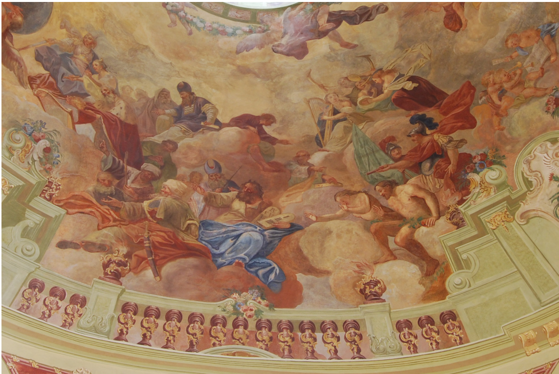
Obr. 17: Skupina postav na epištolní straně kostela. Vpravo nahoře čtyři ženy hrající na hudební nástroje, pod nimi dva vojáci a starozákonní postavy Adama a Evy. Uprostřed Mojžíš s deskami Desatera, jeho bratr Áron, nad nimi Samuel, král David s korunou a harfou, za ním sv. Helena a sv. Kateřina.