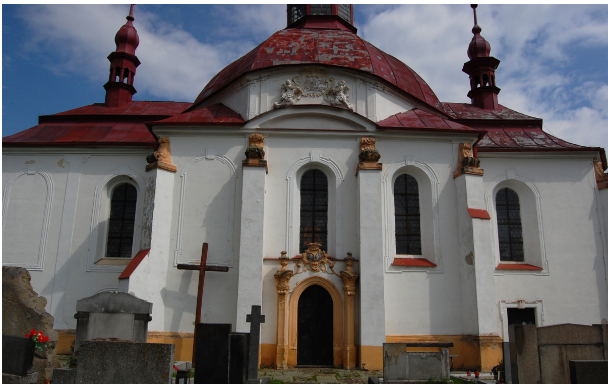
Obr. 13: Jižní průčelí kostela ve Slatinách.