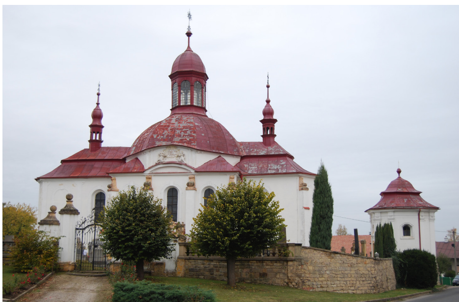
Obr. 2: Kostel Nanebevzetí Panny Marie a kostnice ve Slatíně. Pohled od jihu na průčelí kostela a na hlavní bránu. Foto z roku 2009.

(1. Poche, E.: Umělecké památky Čech, svazek 3., P-Š. Praha. 1980. s. 345)