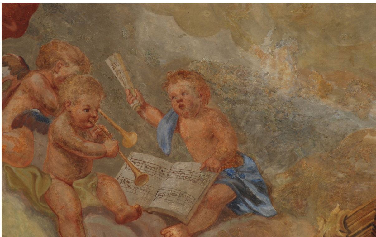
Obr. 57: Detail hrajících andílků v zadní části klenby lodi. Rekonstrukce H. A. Joukla. Velké procento tmelů a retuší pochází rovněž z posledního restaurátorského zásahu v roce 2004.