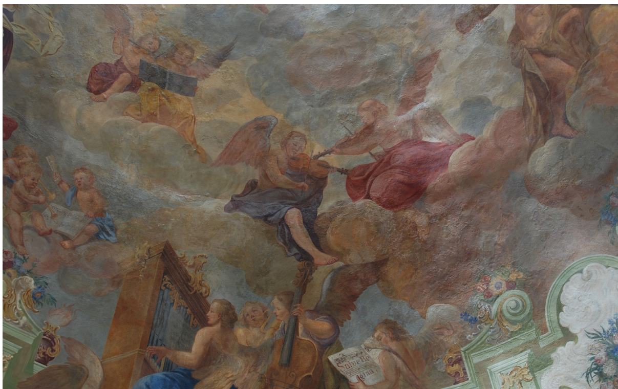
Obr. 54: Zadní část kupole lodi, kompletní rekonstrukce od H. A. Joukla. Reliéf nerovné a poškozené omítky, foto v rozptýleném denním světle.