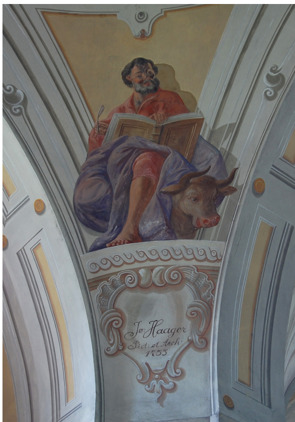
Obr. 65: Kostel sv. Ducha v Libáni, detail nástropní malby. V malované kartuši pod postavou apoštola sv. Lukáše signatura autora maleb, Josefa Haagera, malíře a architekta.