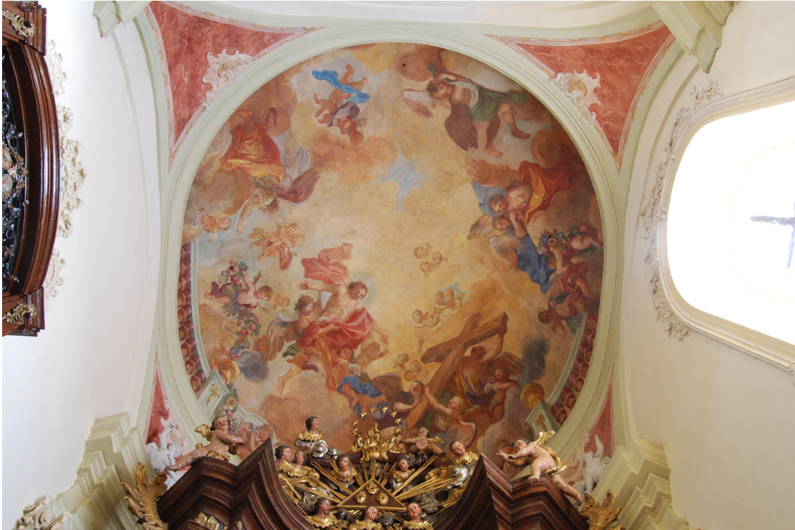
Obr. 30: Nástropní malba v klenbě presbytáře, celkový pohled. Výjev Povýšení sv. Kříže (vykládán také jako Vzkříšení Krista). V pendantivech kupole malovaný umělý mramor. Malba určena pro pohled z lodi kostela, hlavní postavy a lemování kuželkovou balustrádou proto umístěny na stranu nad oltářní stěnou.