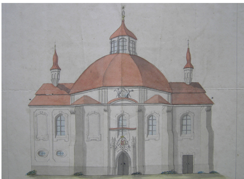
Obr. 3: Nárys kostela, jižní průčelí. Datace i autor neznámý. Z pozůstalosti prof. Mencla ve Státním Okresním archivu v Jičíně.