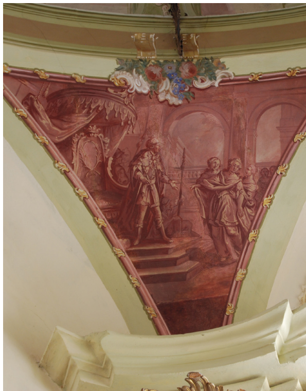
Obr. 26: Ester před Ahasverem.