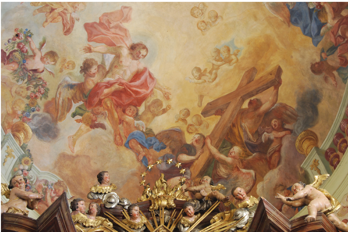
Obr. 31: Nástropní malba v klenbě presbytáře, detail. Vlevo Kristus v červeném roucho s roztaženýma rukama vynášený anděly na nebesa, vpravo andělé pozvedající Svatý Kříž. Tato malba je podle Miroslava Křížka, ak. mal. velmi dobře zachovaná a nachází se na ní pouze minimum přemaleb z 19. století.