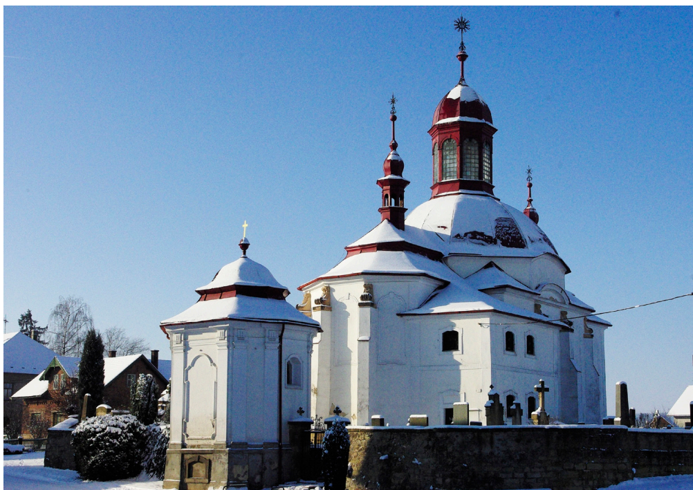
Obr. 4: Kostel a kostnice ve Slatíněch u Jičína.

Pohled od severovýchodu na presbytář, kupoli hlavní lodi zakončenou lucernou a přistavenou sakristií. Kostel leží v areálu hřbitova ohrazeném kamennou zdí, ke které východně od presbytáře přiléhá osmiboká kostnice (márnice).