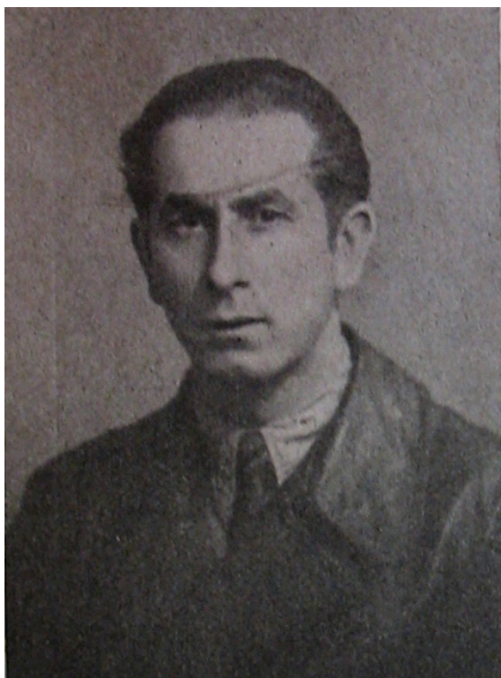
Příloha č. 10