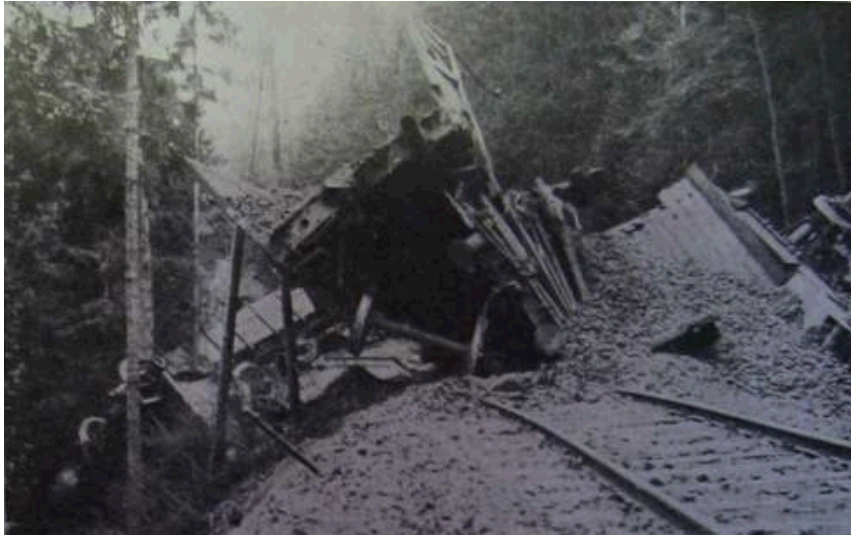
Příloha č. 12. Lomnickou odbojovou skupinou vykolejený vlak s koksem v noci z 30. dubna na 1. května 1945 v Košťálově.