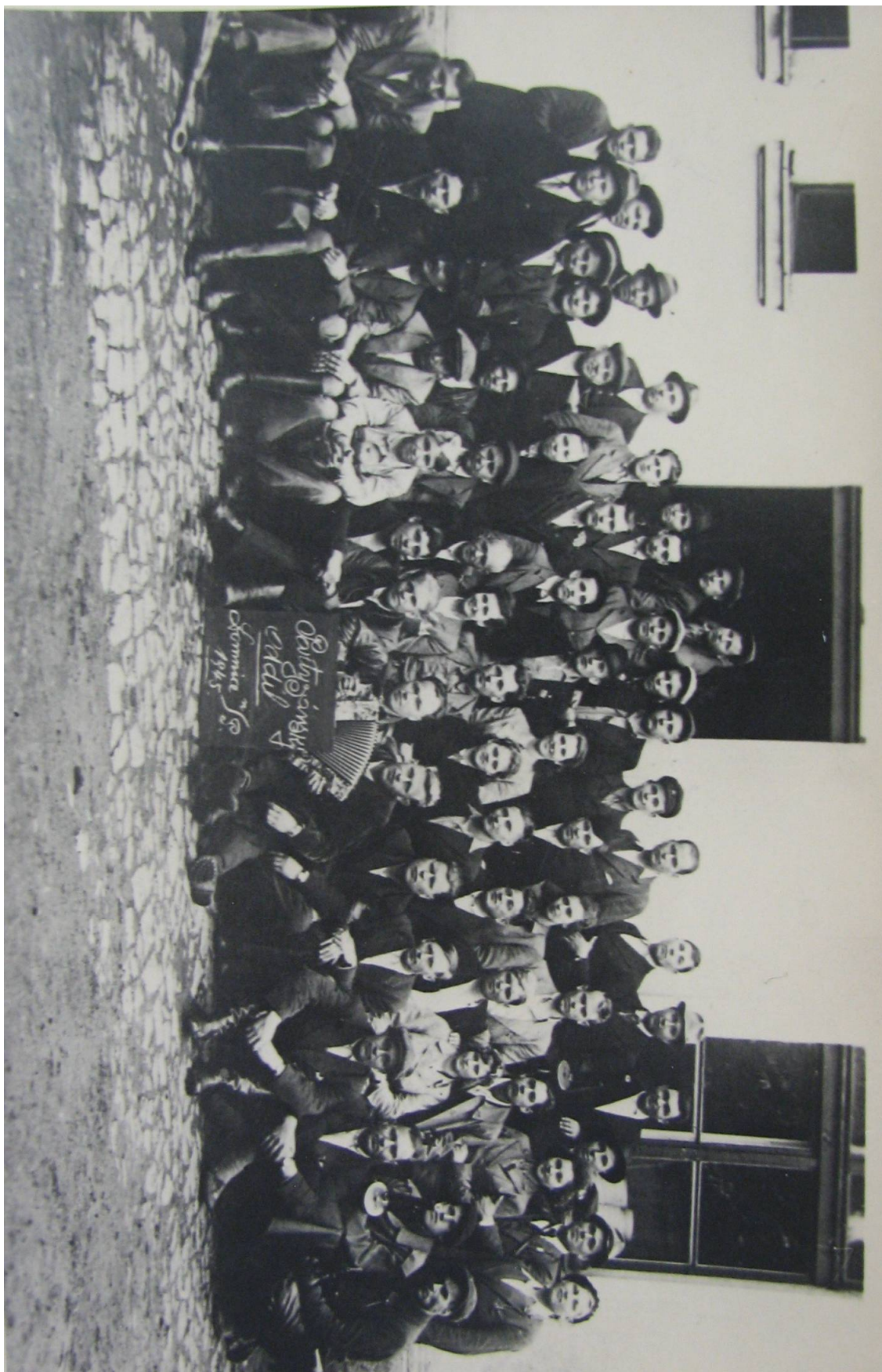
Příloha č. 5. Partyzánský oddíl Lomnice nad Popelkou.