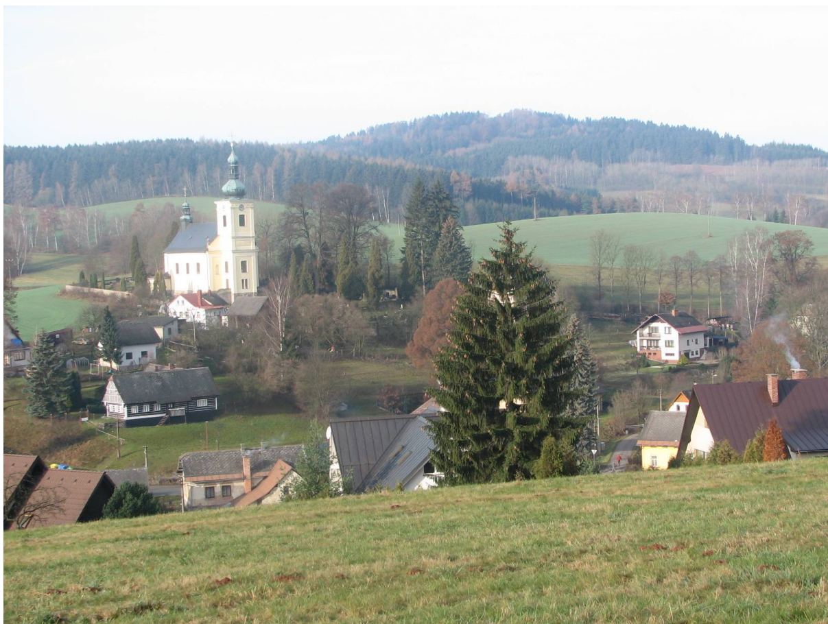
Příloha č. 19. Pohled na obec Mříčnou, v pozadí vrch Strážník. Zde se za války ukrývala řada partyzánů a členů odbojových skupin.