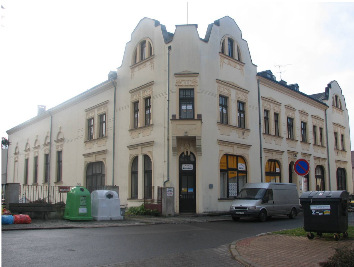
Příloha č. 15. Sokolovna v Semilech (dnešní stav). Zde se za války tiskl časopis V boj .