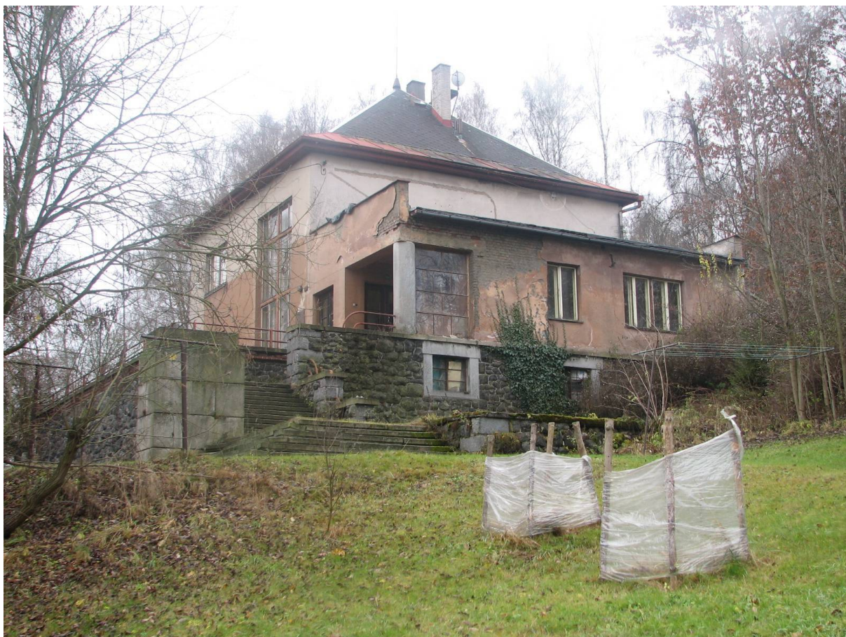
Příloha č. 17. „Kolowratova vila“ v Košťálově, čp. 220 (dnešní stav). Zde pobýval, zejména ke konci války, hrabě Jindřich Kolowrat-Krakovský, člen zpravodajské skupiny Parsifal.