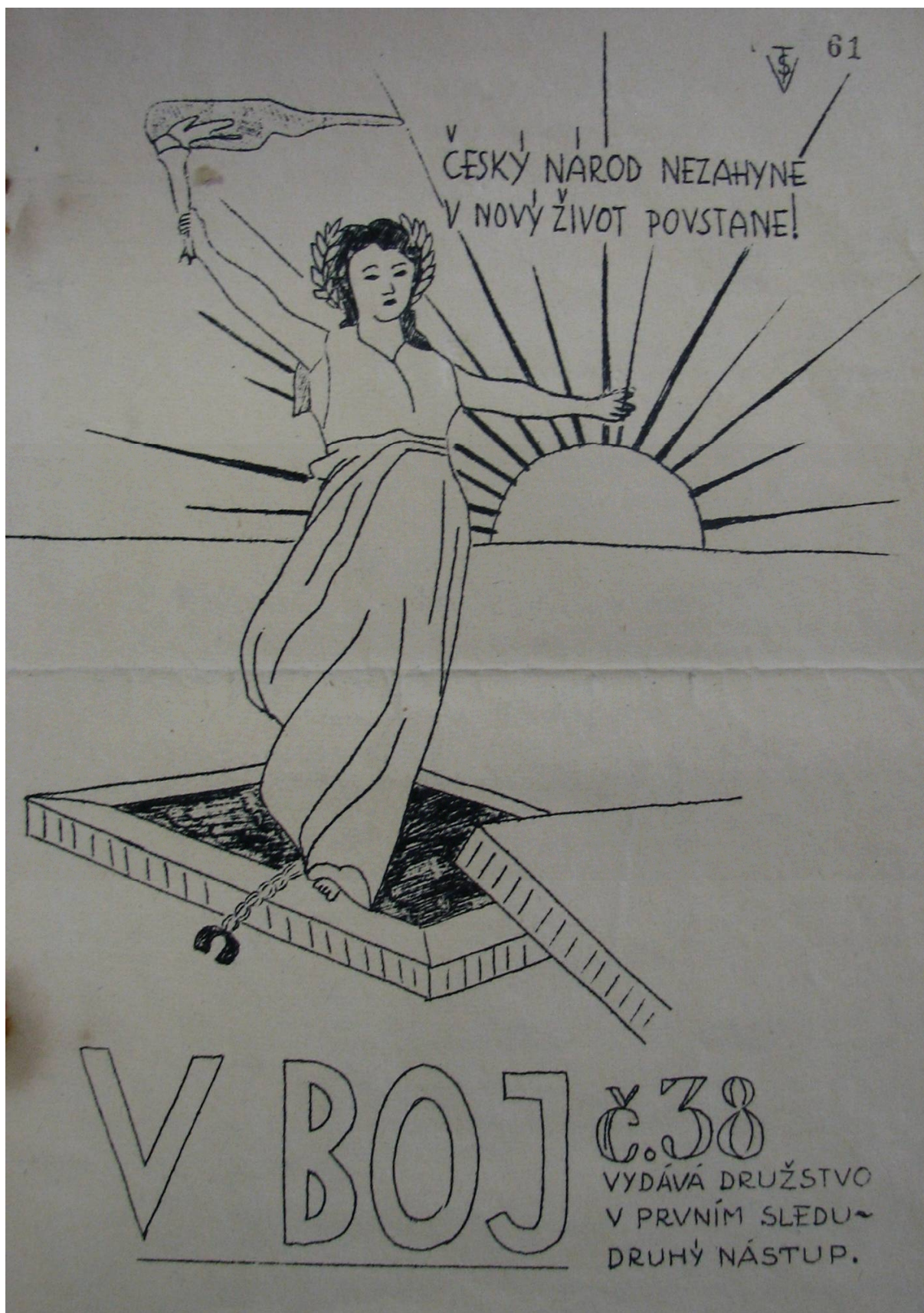
Příloha č. 1. Ukázka časopisu V boj , č. 38, vytištěn Vojenskou tiskárnou Semily.