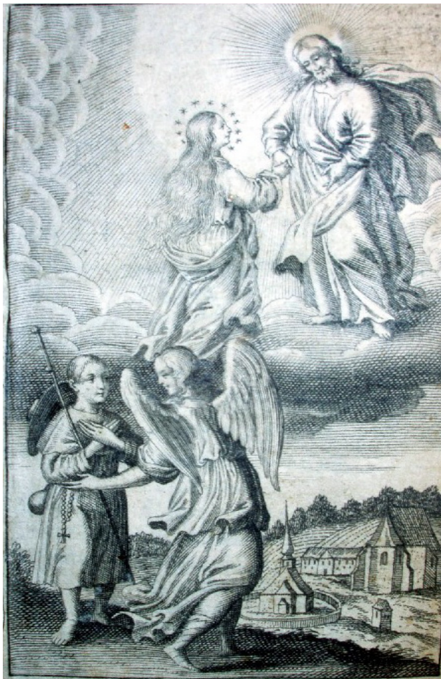
Obr. 1: Vyobrazení sodála s poutnickou holí a kloboukem ze spisu zábrdovického premonstrátského opata Godefrida Olenia Marophilus Peregrinus . (VK Olomouc sign. 37.937)