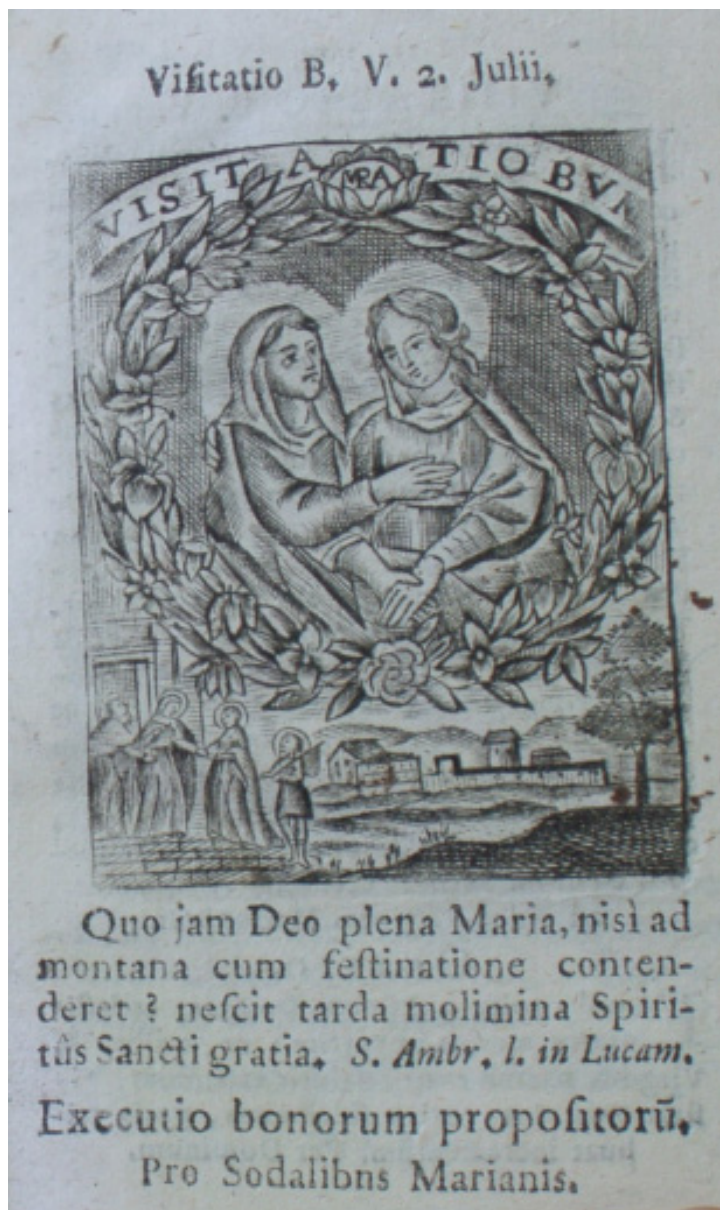
Obr. 4: Úvodní strana tisku tzv. měsíčních patronů jihlavské latinské sodalitty s vyobrazením Navštívení Panny Marie (MZA Brno E 82, sign. T53/4).