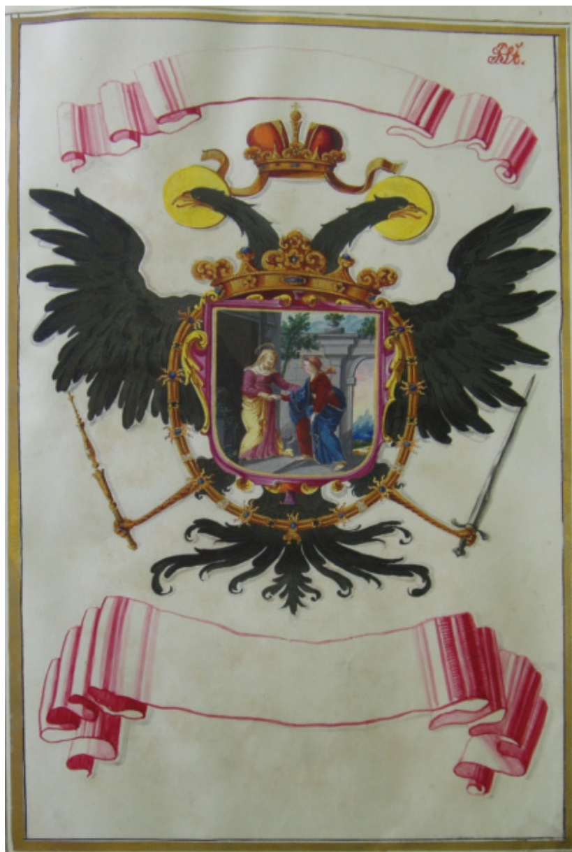
Obr. 3: Titulní list matriky jihlavské studentské družiny Navštívení Panny Marie (MZA Brno, G11 inv.č. 26).