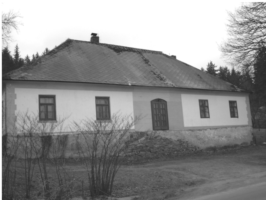
Obr. 3 a 4: Zápis o plánu výdajů na školní výlet (Z kroniky hlinecké školy. SOKA Chru- dim). Bývalá výletní restaurace Veselka dnes.