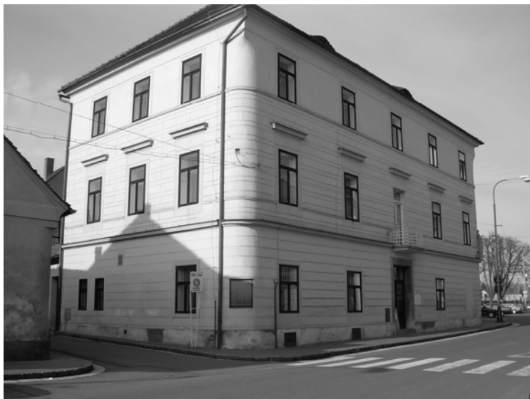
Obr. 5: V této budově se v Heřmanově Městci učilo do r. 1896.