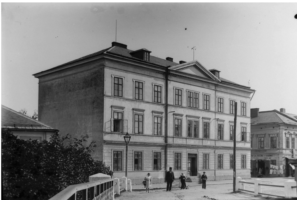
Obr. 2: Obecná a měšťanská škola v Hlinsku koncem 19. století.

školy v hlineckém regionu. 4 Škola měla dokumentovat naplňování Hasnerova zákona z roku 1869 po stránce organizační i obsahové.