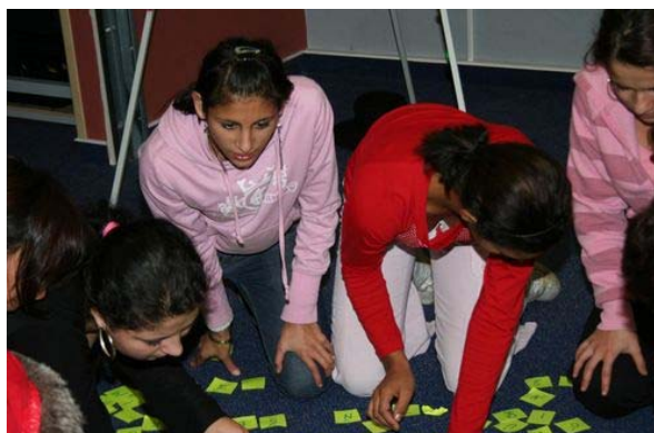
obrázek 3 Kurz rozvoje osobnosti

Velmi důležitou vlastností, která by mladému člověku neměla chybět, je vůle. Pro každého z nás je důležitá, neboť díky ní dokážeme dosáhnout svých cílů. O to hůř je tomu tak u dětí z dětských domovů, které často žádné cíle nemají. Kurz se v nich proto snaží vzbudit zájem a touhu dosáhnout nějakého vlastního cíle či snu, ať už je to zaměstnání, vzdělání či záliba. Prostřednictvím her, ukázky řemesla a dlouhých diskuzí se salesiáni pokoušejí klienta zaujmout a napomoci mu zjistit jeho vlastní životní směr a cíl.