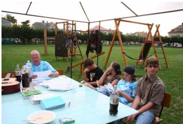
obrázek 5 Prázdninové akce ve středisku

Dle postřehů a komentářů, které jsem se dozvěděla přímo od účastníků prázdninových akcí, je tento druh aktivity velmi oblíben, neboť zde nejsou nastavena přísná pravidla ústavní výchovy a vše se děje na základě kamarádského přístupu, případné problémy jsou řešeny otevřeným způsobem prostřednictvím diskuzí a vyslechnutím názorů toho druhého a celkově se zde mladí lidé cítí příjemně, neboť všichni jsou si rovni a snaží se vytvořit harmonickou skupinu na bázi rodinné atmosféry.