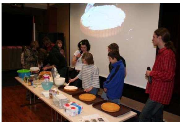
obrázek 4 Dny pro dětské domovy

Cílem těchto akcí je, aby mládež získala nové informace a vědomosti zábavnou formou. Na vlastní pěst si také vyzkouší prezentované povolání - středisko již zažilo pečení perníčků, dortů a tvořilo se také ze sádry. Dny pro dětské domovy však především napomáhají upevnit vztahy s pracovníky střediska, kteří zde mají opět prostor pro diskuzi s dětmi. Během celého dne je čas na povídání si o životě, problémech i radostech, mládež se chlubí svými úspěchy a salesiánští pracovníci ochotně naslouchají a v případě nutnosti poradí a pomůžou.