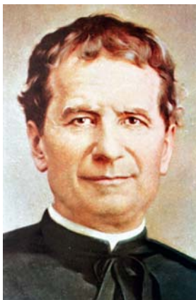
obrázek 1 Don Bosco

Další kroky směřovaly do turínského církevního konviktu, kde se kněží zasvěcují do svých povinností duchovních rádců, zpovědníků a kazatelů. Zde Bosco zahájil svůj apoštolát – zabýval se duchovní správou věznic, poskytoval duchovní rozhovory s odsouzenými, dával jim útěchu, měl vytrvalá kázání a pravidelně zpovídal. V tomto období nastal velký zlom v jeho životě. Když se jednoho dne připravoval na mši, vtrhl do kostela negramotný zednický učeň bez matky i otce. Odmítl však pomáhat při mši, a proto ho kostelník vyhnal. Bosco se ho zastal a řekl: „Je to můj přítel“. Díky tomuto chlapci nyní poznal, v čem spočívá jeho životní role 4 .