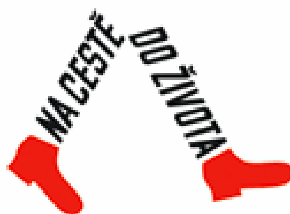
obrázek 2 Logo projektu Na cestě do života

Kromě přípravných kurzů středisko pořádá každou první sobotu v měsíci tzv. Dny pro dětské domovy, jakožto setkání několika dětských domovů za účelem navázání nových vztahů, představení určitého řemesla, soutěžení, tancování a zábavy. Každé léto potom probíhají desetidenní prázdninové pobyty pro skupinku cca deseti lidí, opět v duchu Kurzů přípravy na život, kde se mladí lidé učí zúročit své znalosti během kurzů přímo v terénu (návštěva úřadu práce, správy sociálního zabezpečení apod.)