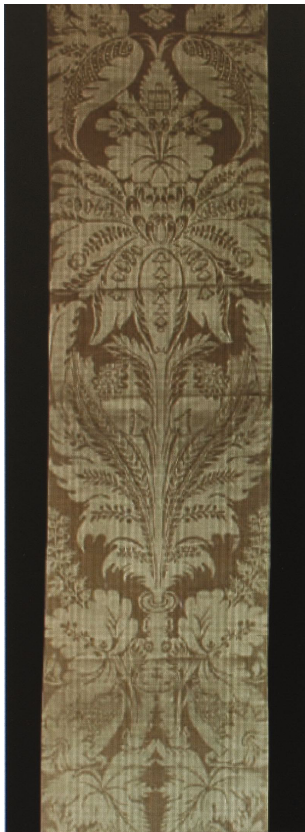
Obr. 71: Detail textilní tapety, hedvábný Damašek s rozměrným dekorem květů, listů a granátových jablek, Velká reprezentační ložnice, SZ Veltrusy, Foto: Ladislav Bezděk, Gabriela Čapková