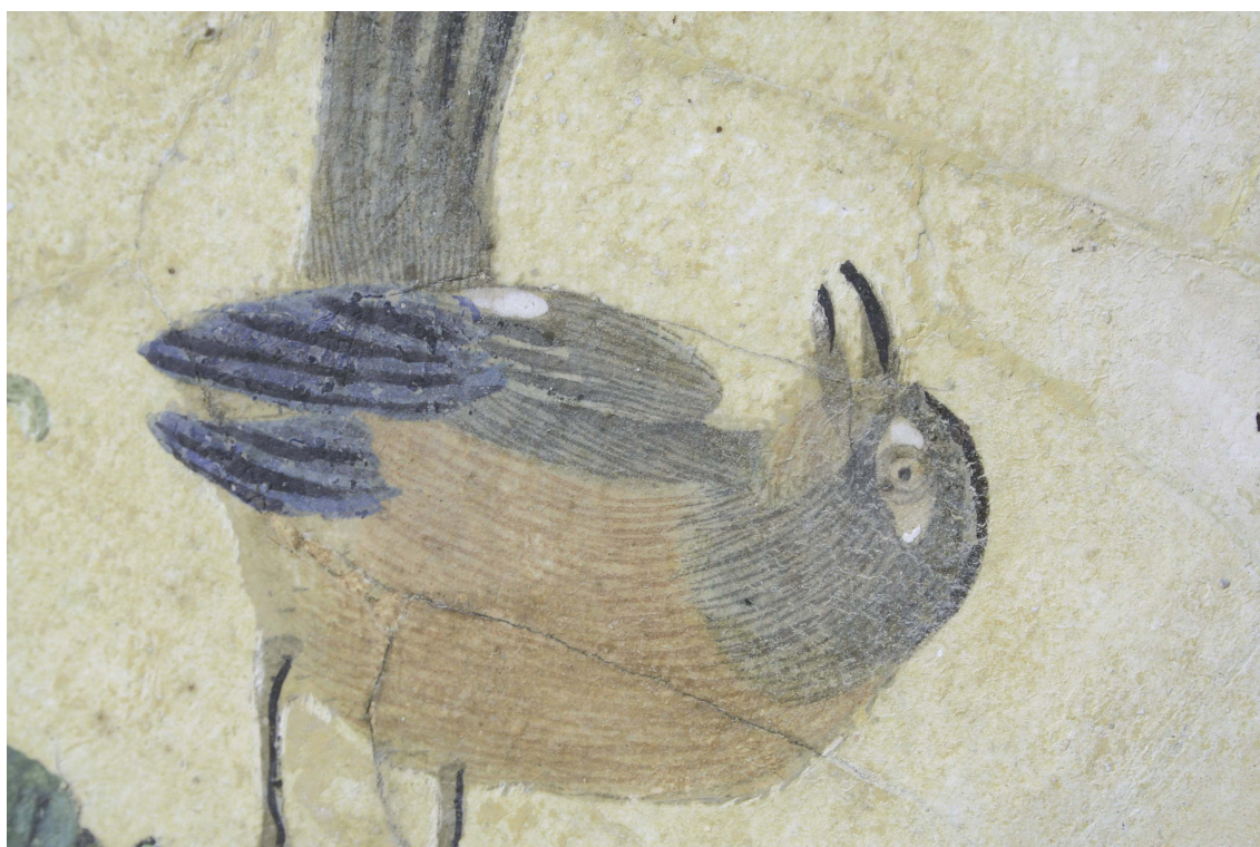
Obr.12: P13A , detail zákalu barevné vrstvy, Velký čínský salonek, SZ Veltrusy