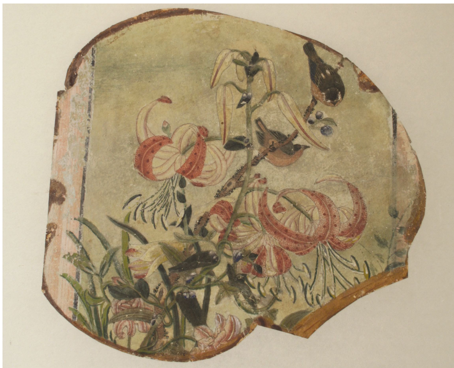
Obr. 32: P15, malá papírová aplikace, detail iluzivního dřevěného rámu původně přemalovaného, Velký čínský salonek, SZ Veltrusy, Foto: Tereza Nedbalová