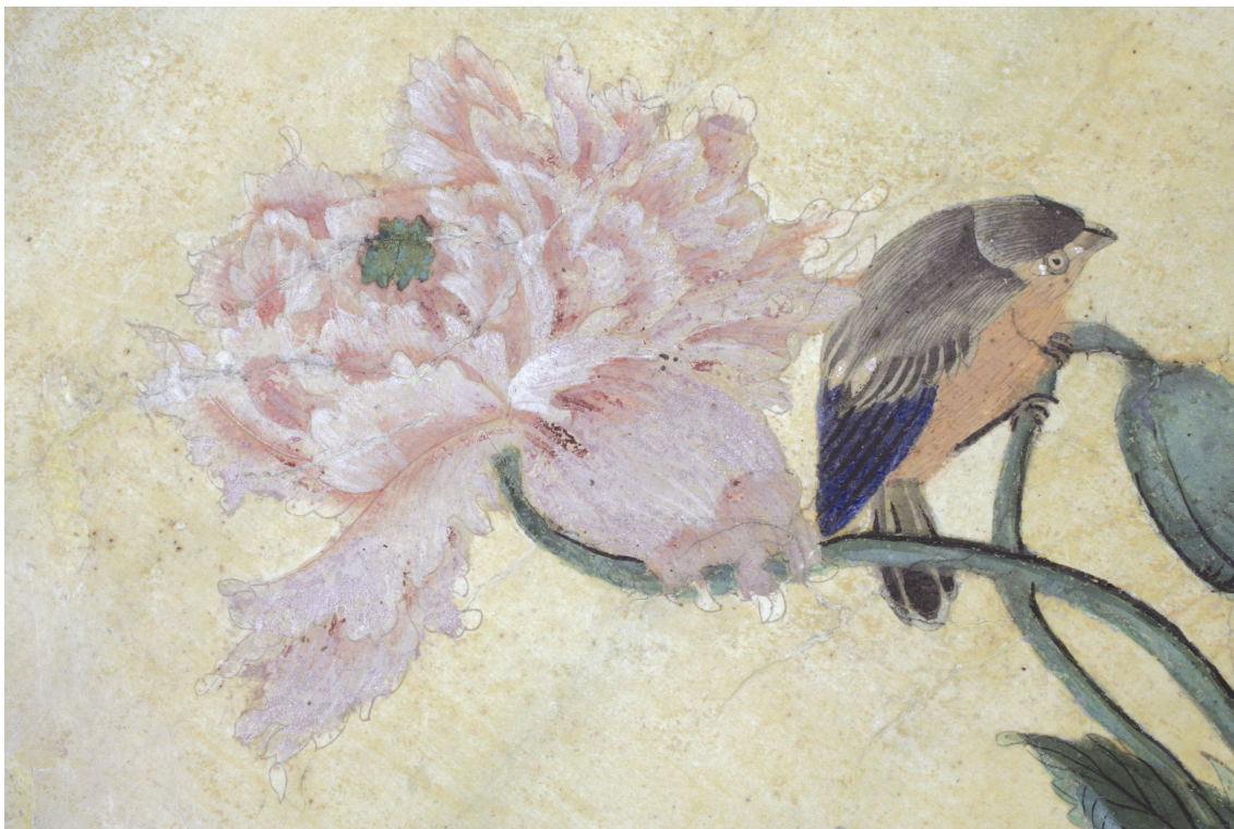
Obr. 23: P13A, detail kresby květu, Velký čínský salonek, SZ Veltrusy