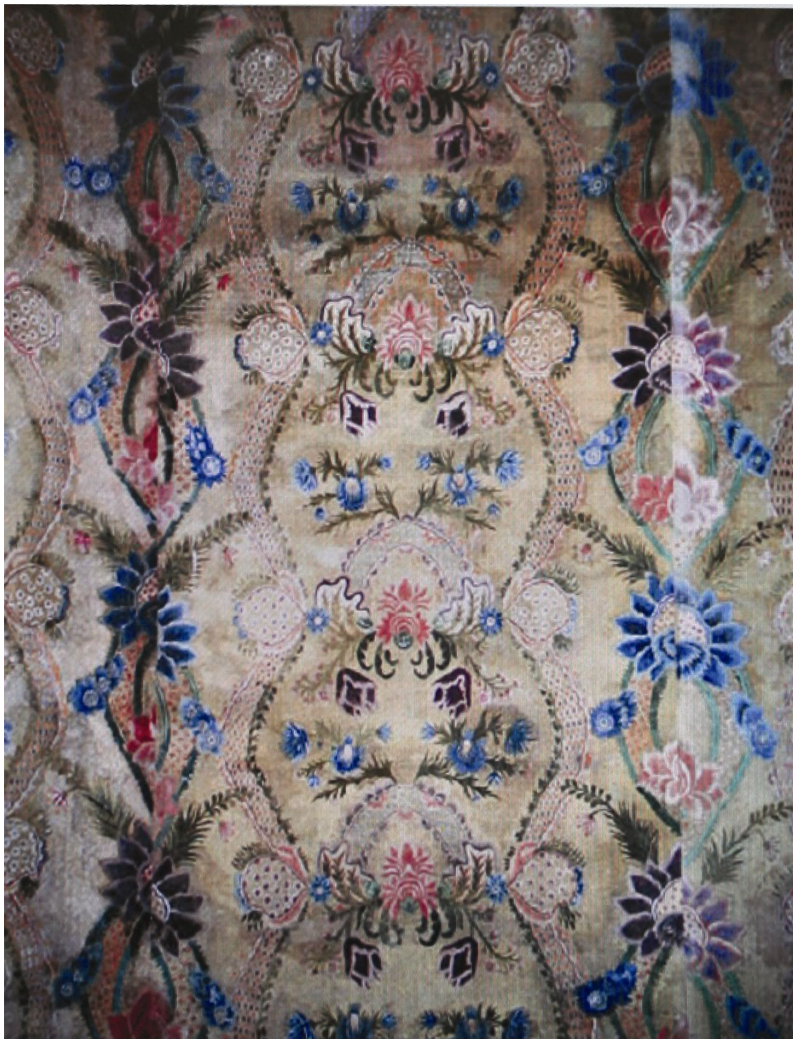
Obr. 70: Detail hedvábné tapety s malovanými rostlinnými dekory a stuhami s mašlemi evokující motiv krajky, Druhá zrcadlově orientovaná ložnice s alkovnou a kartušemi s aliančním znakem, SZ Veltrusy