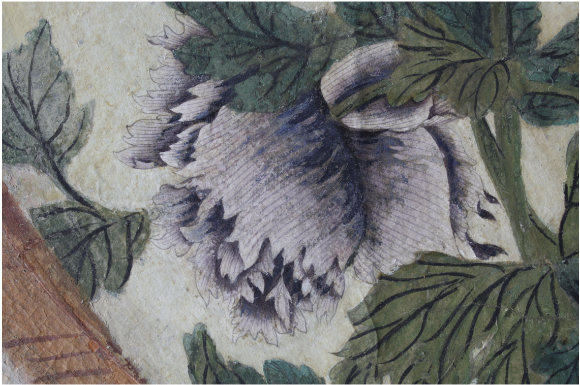
Obr. 27: P15 – detail květu, Velký čínský salonek, SZ Veltrusy