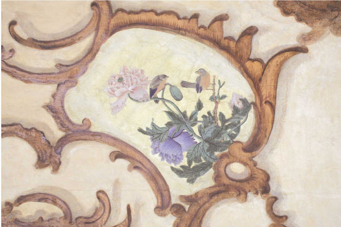
Obr. 19: P13A, iluzivní dřevěná kartuše, Velký čínský salonek, SZ Veltrusy