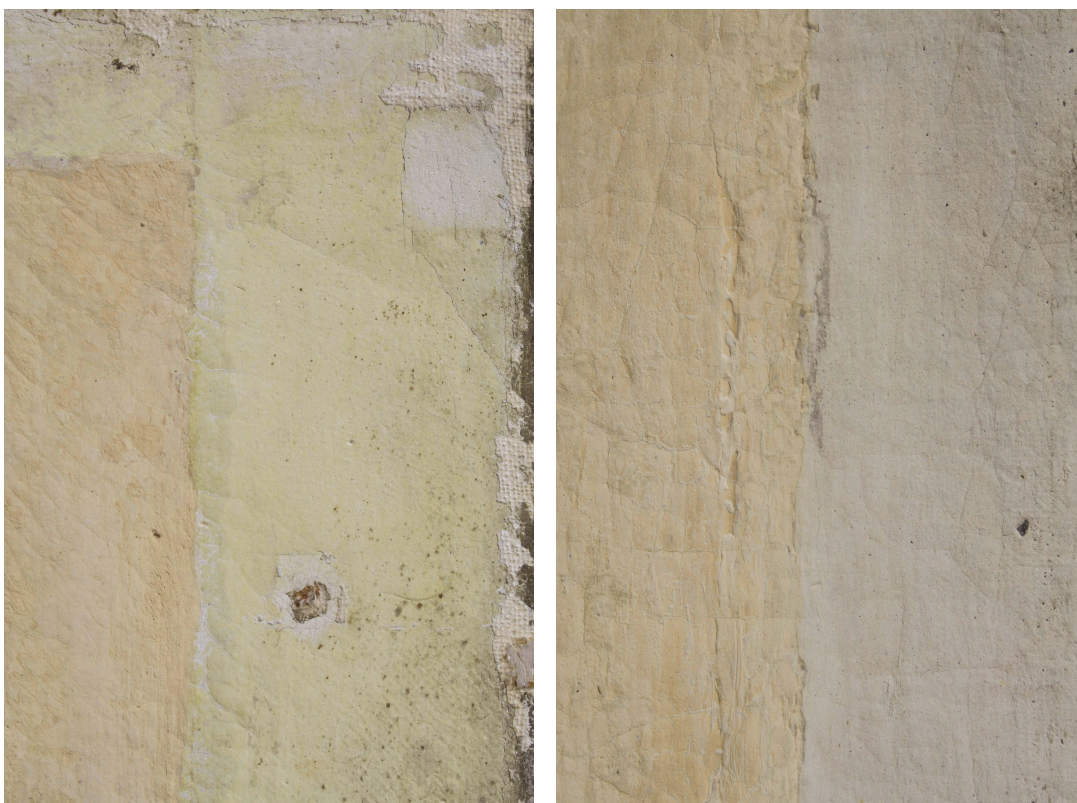
Obr.11: Detaily původní barevnosti pozadí, zleva P3, P13A, Velký čínský salonek, SZ Veltrusy