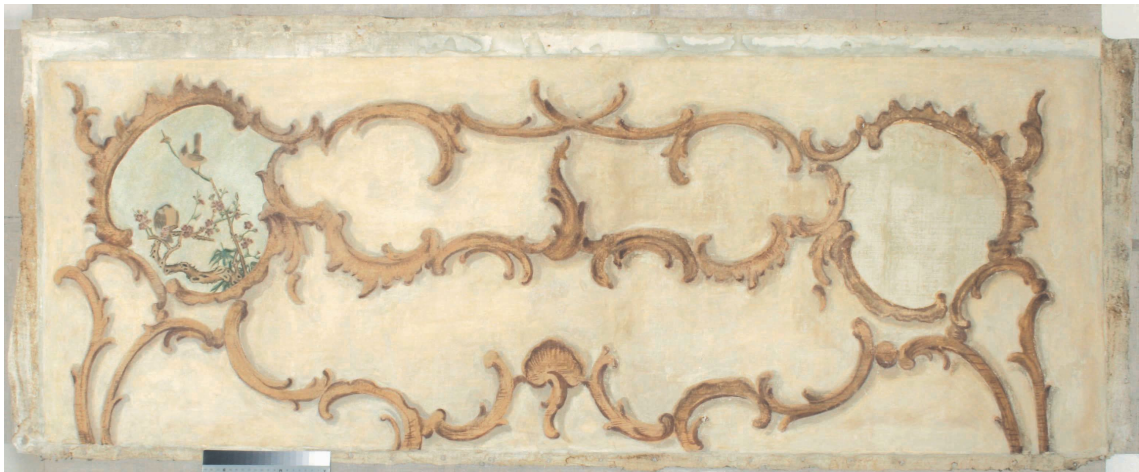
Obr.8: Panel 5 – suprafenestra, Velký čínský salonek, SZ Veltrusy, stav po restaurování