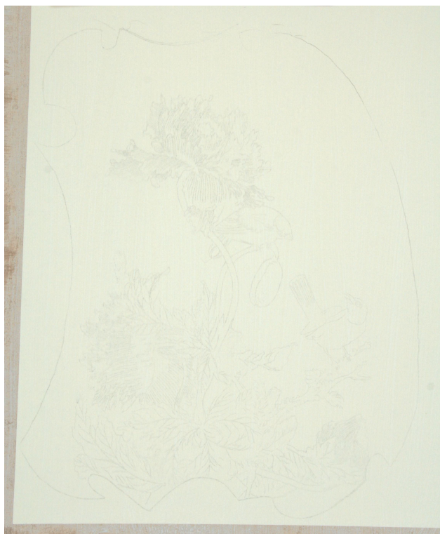
Obr. 45: Přenesená kresba pomocí pauzy, průběžný stav technologické kopie části restaurované malby tapetových dveří na mobilním panelu, Velký čínský salonek, SZ Veltrusy, Foto: Andrea Havlíčková