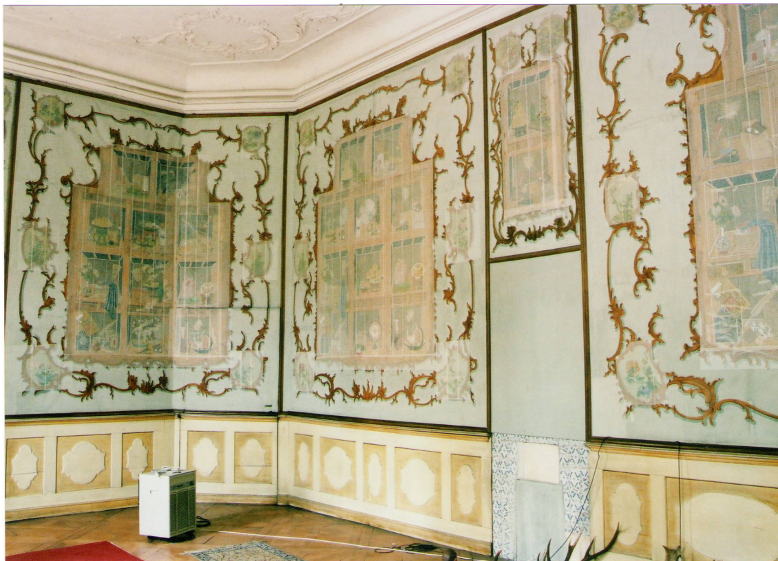
Obr. 37: Velký čínský salonek, SZ Veltrusy, pohled na severovýchodní stěnu před restaurováním tapet, Foto: Kateřina Opatová