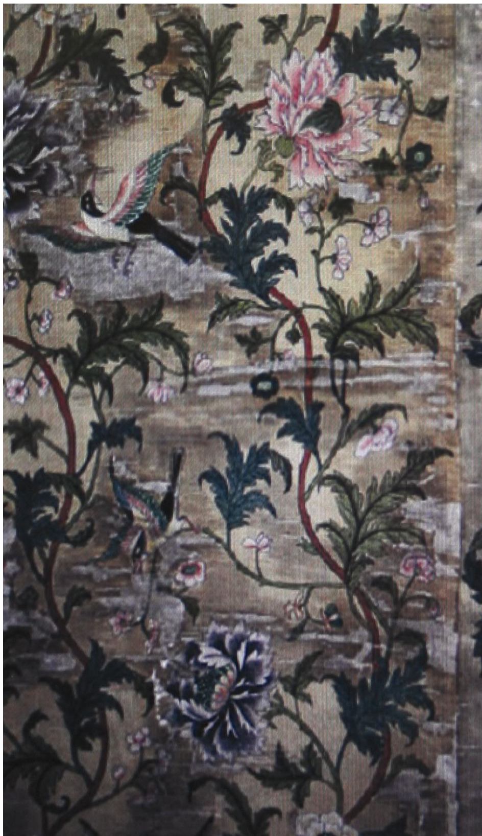
Obr. 67: Detail hedvábná látka zdobena malbou s dekorem nekonečného stromu života, Malý kabinet, SZ Veltrusy, Foto: PhDr. Eva Lukášová