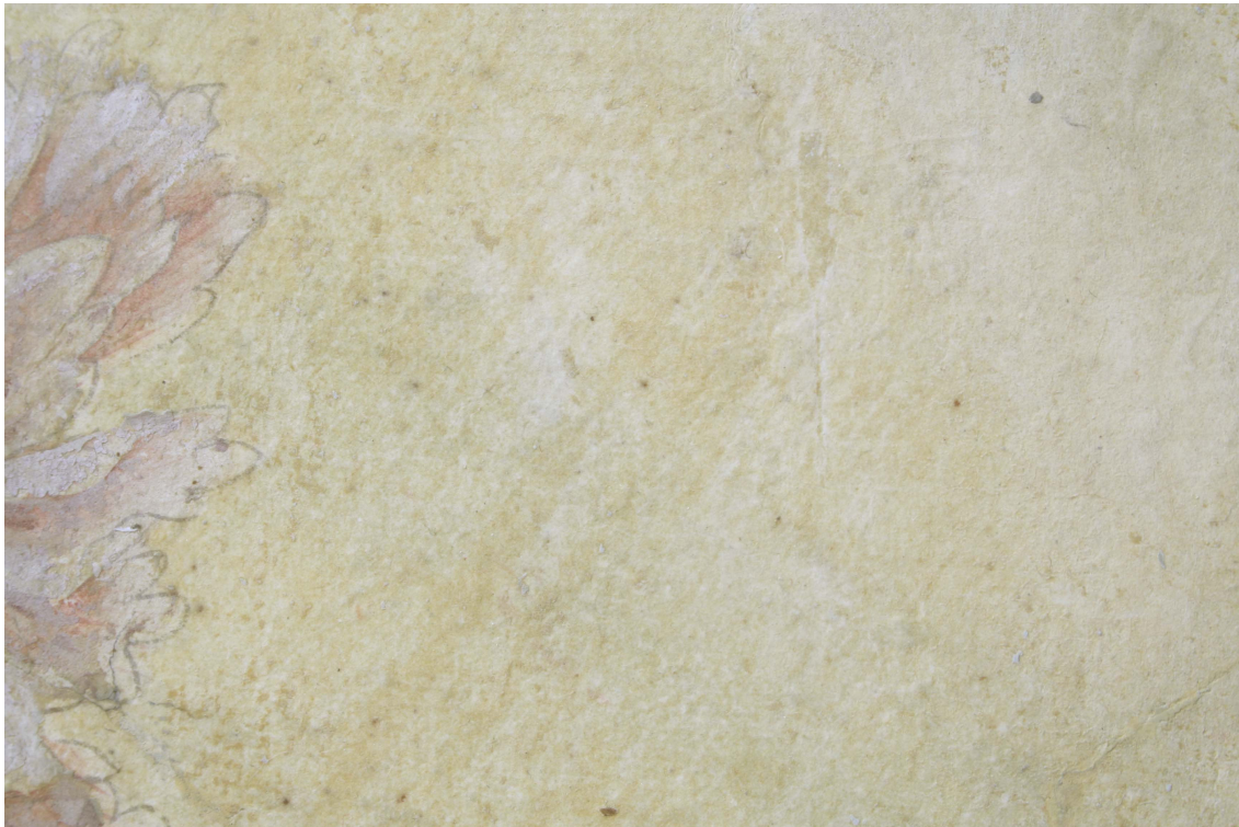
Obr.15: P13A, detail šelakové vrstvy v pozadí malé papírové aplikace, po sejmutí přemalby, Velký čínský salonek, SZ Veltrusy, Foto: Andrea Havlíčková