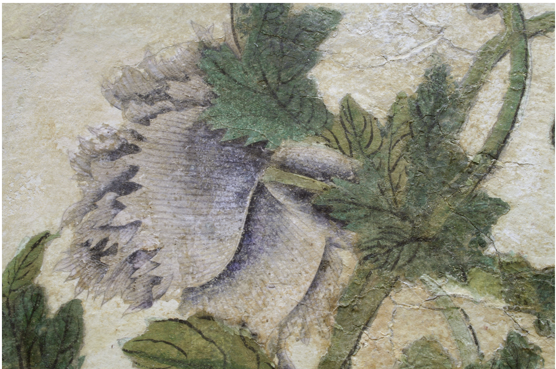
Obr. 26: P15, detail květu, Velký čínský salonek, SZ Veltrusy, Foto: Andrea Havlíčková