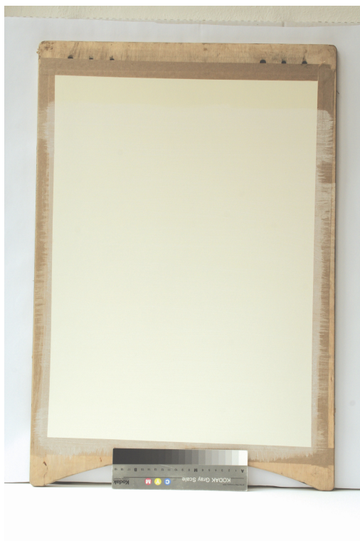
Obr. 44: Arch papíru opatřený podkladovou barvou, příprava papírové aplikace panelu pro technologickou kopii části restaurované malby tapetových dveří na mobilním panelu, Velký čínský salonek, SZ Veltrusy, Foto: Andrea Havlíčková