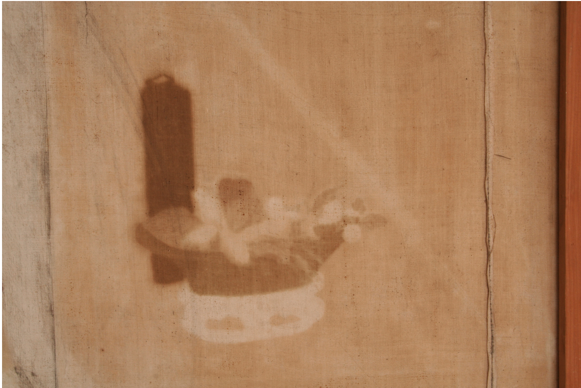
Obr.13: P15, detail změny barevnosti plátna vlivem vlhka migrujícího barviva, Velký čínský salonek, SZ Veltrusy, Foto: Tereza Nedbalová