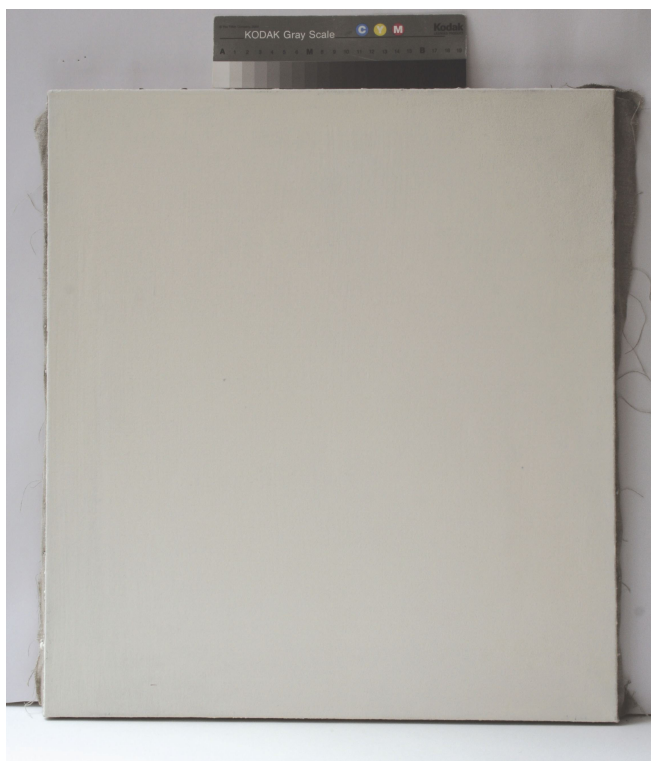
Obr. 42: Plátno opatřené emulzním podkladem, příprava panelu pro technologickou kopii části restaurované malby tapetových dveří na mobilním panelu, Velký čínský salonek, SZ Veltrusy