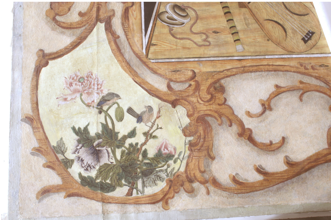
Obr. 20: P15, iluzivní dřevěná kartuše, Velký čínský salonek, SZ Veltrusy, Foto: Andrea Havlíčková