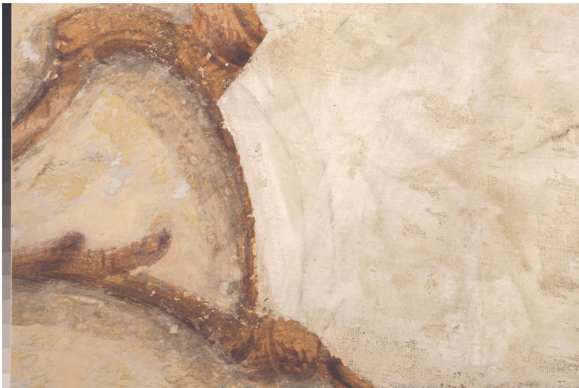
Obr.16: P15, detail podkresby uhlím pod malou papírovou aplikací, Velký čínský salonek, SZ Veltrusy, Foto: Michaela Kudová, Tereza Nedbalová