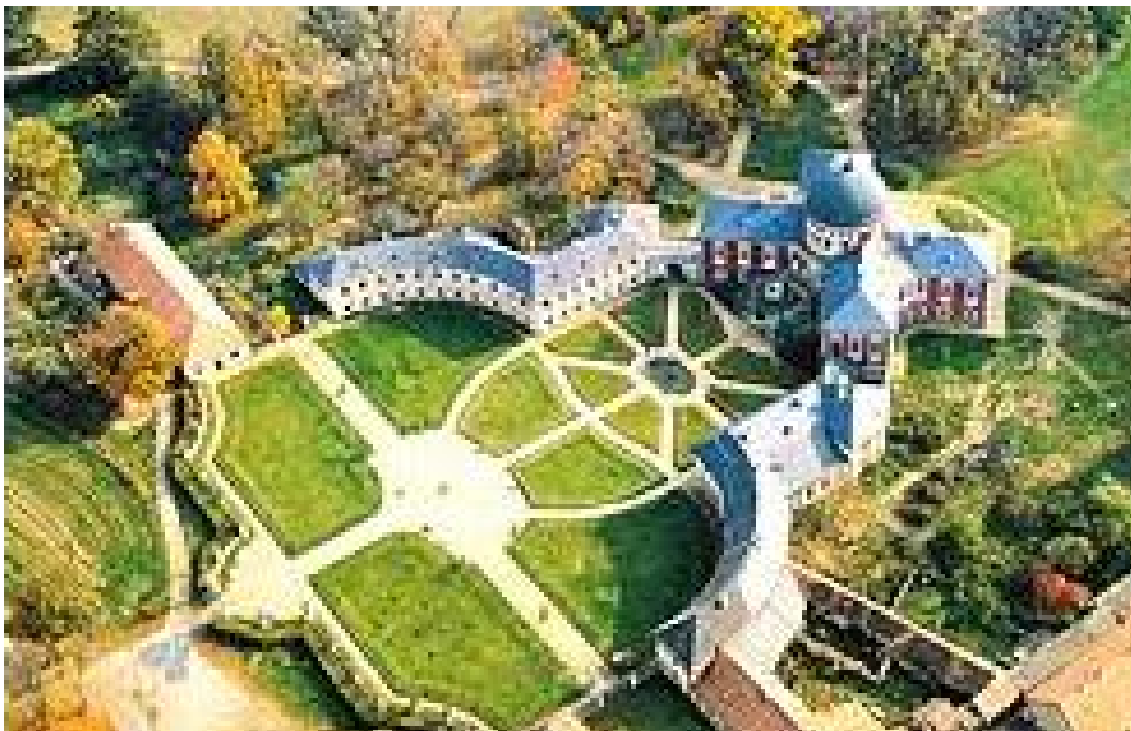
Obr.2: Letecký snímek SZ Veltrusy