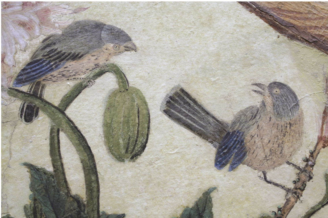
Obr. 30: P15, detail ptáčků, Velký čínský salonek, SZ Veltrusy