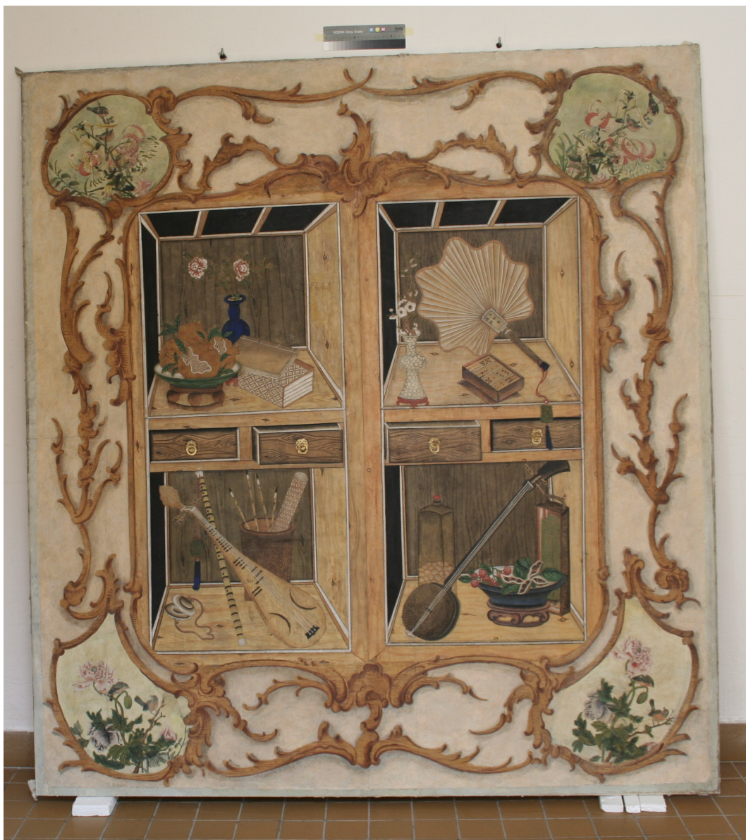
Obr.6: Panel 15 – supraporta, Velký čínský salonek, SZ Veltrusy, stav po restaurování