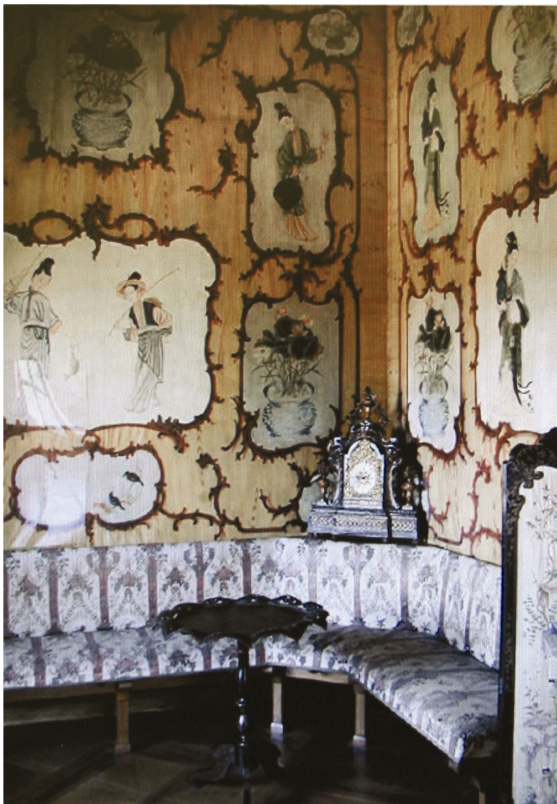
Obr. 64: Malý čínský salonek, SZ Veltrusy, Foto: NPÚ – ÚOP středních Čech v Praze