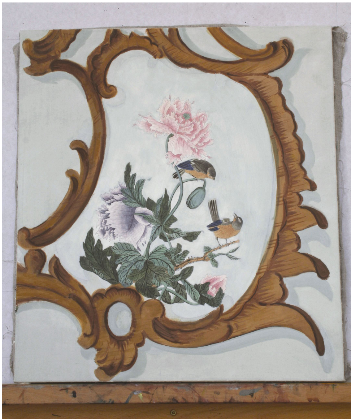
Obr. 56: Po dodělání stínů a doplnění detailů přesahujícího z papírové aplikace na malbu na textilní podložce, průběžný stav technologické kopie části restaurované malby tapetových dveří na mobilním panelu, Velký čínský salonek, SZ Veltrusy, Foto: Andrea Havlíčková