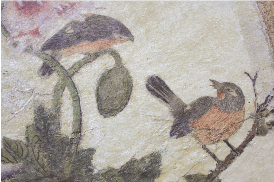
Obr. 29: P15, detail ptáčků, Velký čínský salonek, SZ Veltrusy