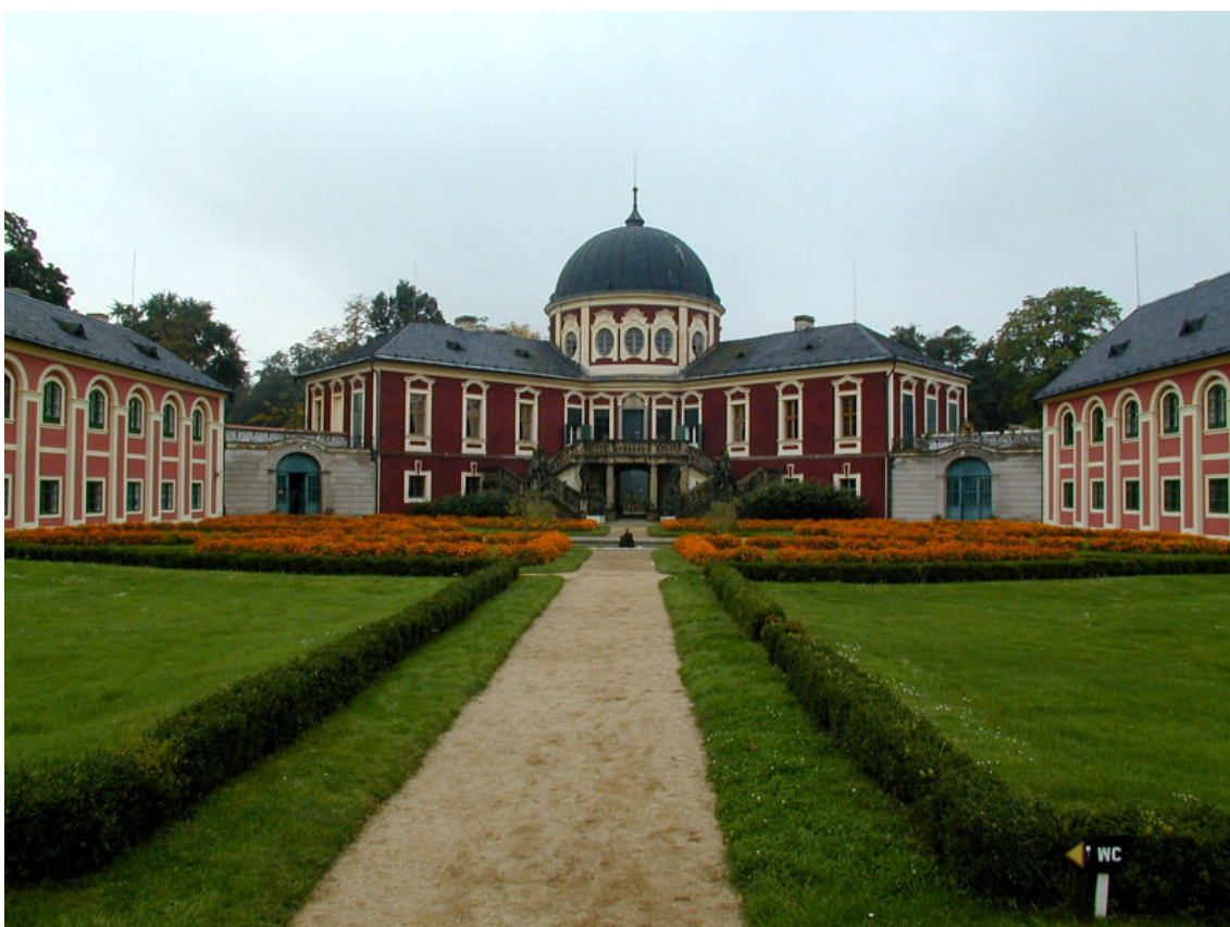
Obr.3: SZ Veltrusy, pohled z čestného dvora