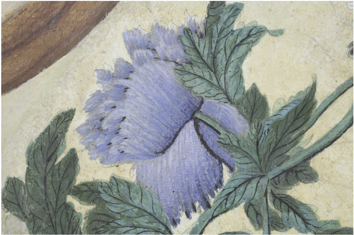
Obr. 25: P13A, detail květu, Velký čínský salonek, SZ Veltrusy, Foto: Andrea Havlíčková