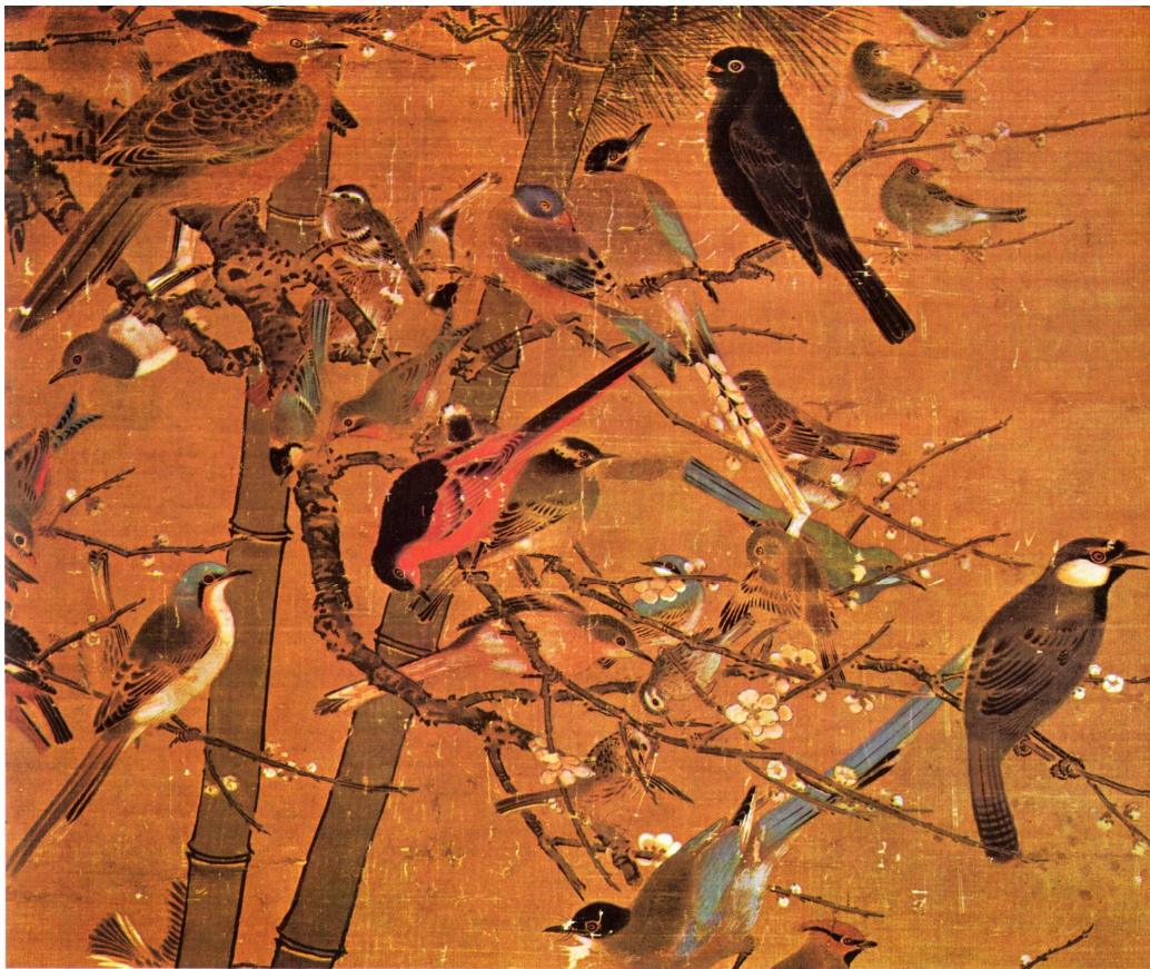
Obr. 51: Bian Jingzhao, detail, studijní materiál Venduly Āopkové, analogické dílo