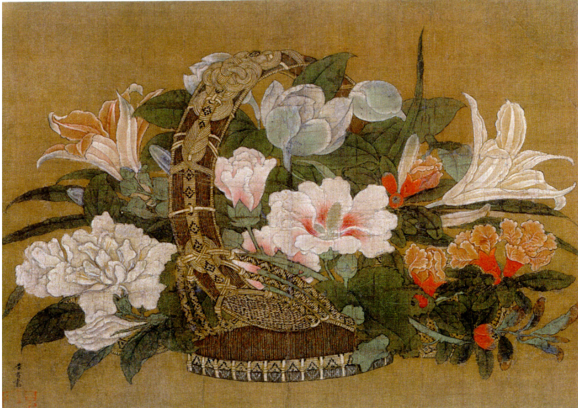
Obr. 50: Li Song, Čína, studijní materiál Venduly Āopkové, analogické dílo