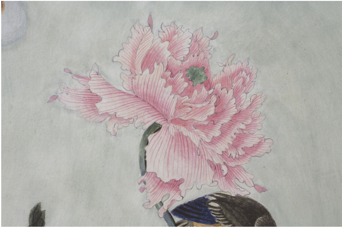
Obr. 58: Technologická kopie části malby tapetových dveří na mobilním panelu po dokončení, detail malby a povrchů, Velký čínský salonek, SZ Veltrusy