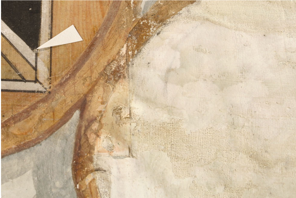
Obr. 63: P15, Malá papírová aplikace překrývá velkou, detail papíru po sejmutí malé aplikace, Velký čínský salonek, SZ Veltrusy