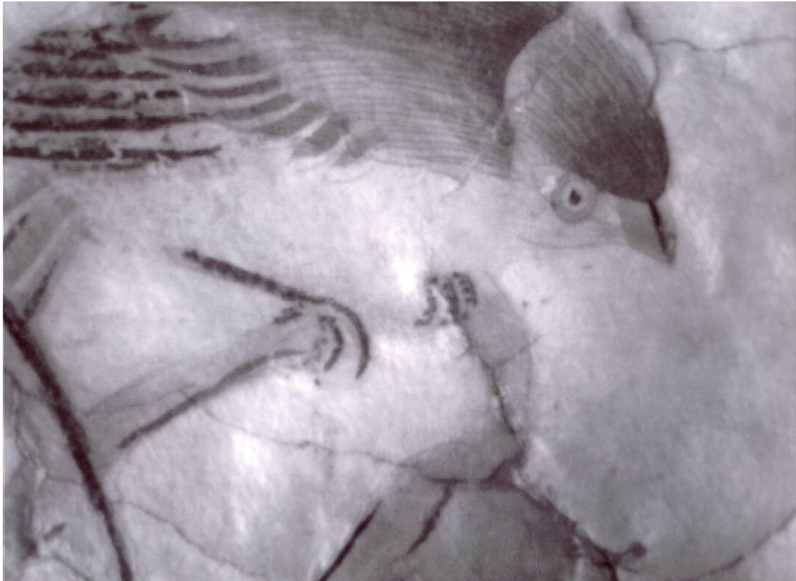
Obr. 35: P13A, snímek pořízený infračervenou kamerou, Velký čínský salonek, SZ Veltrusy