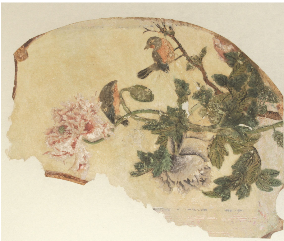
Obr. 31: P15, přemalované a odstřižené detaily na papírové aplikaci, srov. s obr. 19 a 20, Velký čínský salonek, SZ Veltrusy