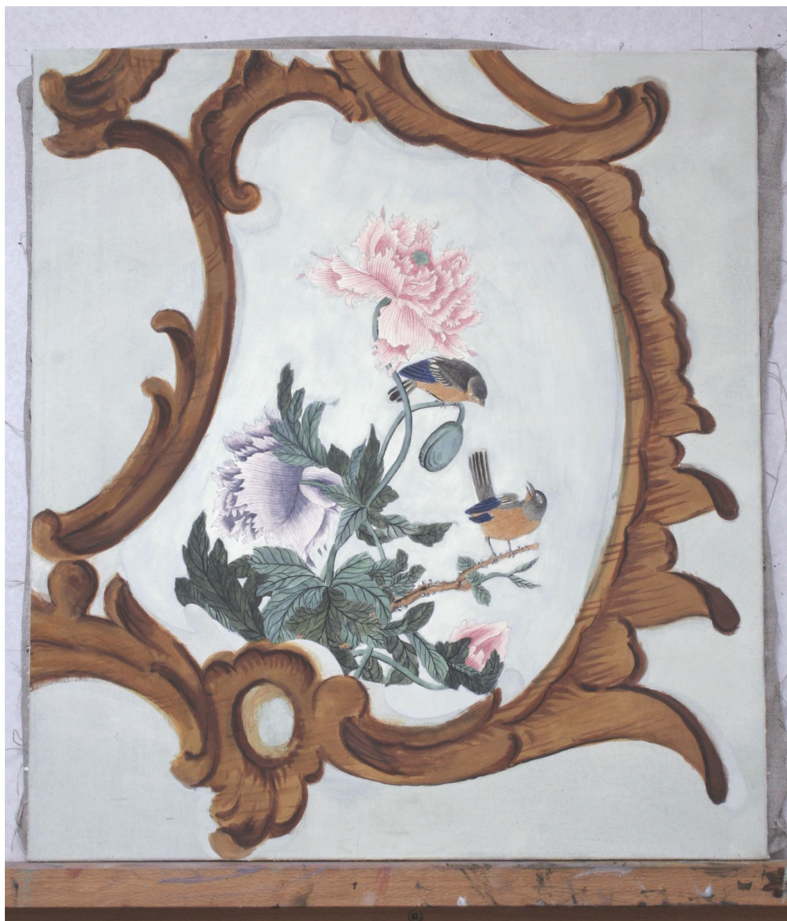
Obr. 55: Po namalování iluzivního dřevěného rámce, průběžný stav technologické kopie části restaurované malby tapetových dveří, Velký čínský salonek, SZ Veltrusy