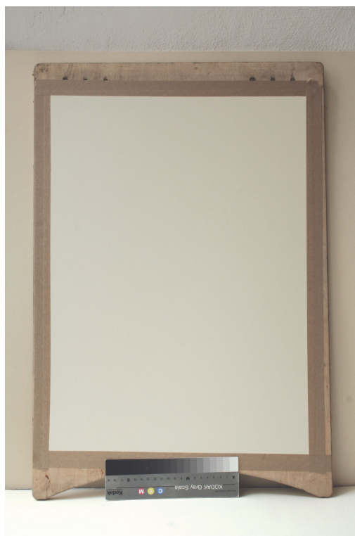
Obr. 43: Napnutý arch papíru, příprava papírové aplikace panelu pro technologickou kopii části restaurované malby tapetových dveří Velký čínský salonek, SZ Veltrusy, Foto: Andrea Havlíčková