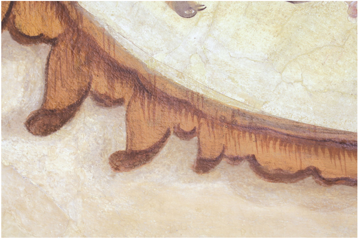
Obr. 21: P13A, detaily rukopisu na iluzivních dřevěných kartuších, Velký čínský salonek, SZ Veltrusy