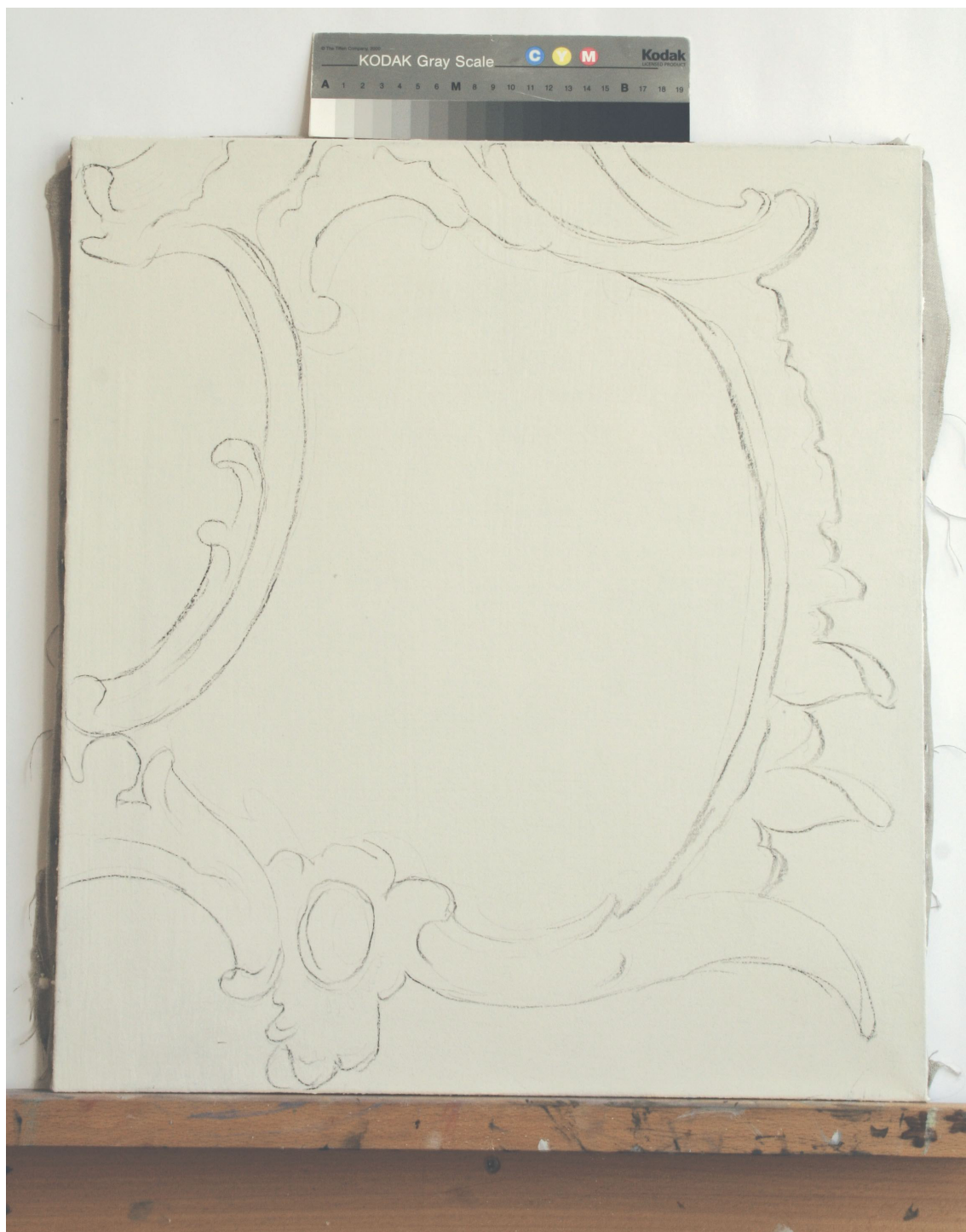
Obr. 52: Podkresba uhlem na podklad na textilní podložce, průběžný stav technologické kopie části restaurované malby tapetových dveří na mobilním panelu, Velký čínský salonek, SZ Veltrusy, Foto: Andrea Havlíčková