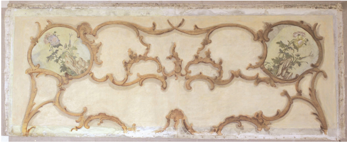
Obr.7: Panel 3 – suprafenestra, Velký čínský salonek, SZ Veltrusy, stav po restaurování