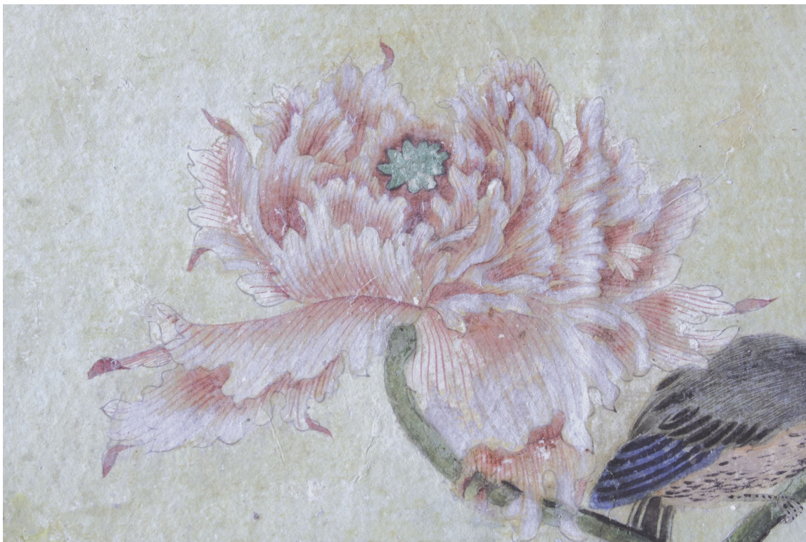
Obr. 24: P15, detail kresby květu, Velký čínský salonek, SZ Veltrusy, Foto: Andrea Havlíčková