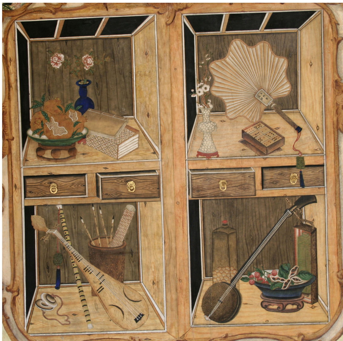
Obr. 39: P15, zátiší, Velký čínský salonek, SZ Veltrusy