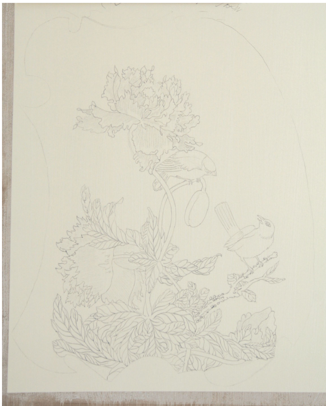
Obr. 46: Podkresba tuší, průběžný stav technologické kopie části restaurované malby tapetových dveří na mobilním panelu, Velký čínský salonek, SZ Veltrusy