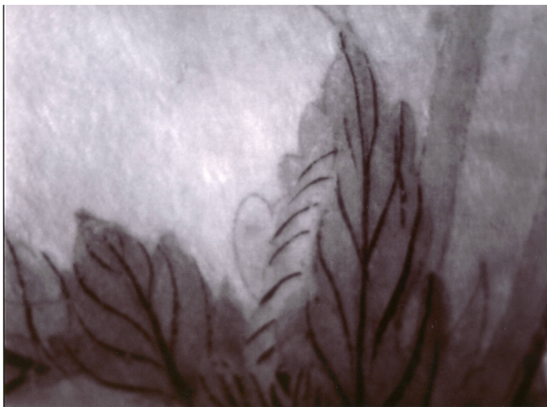
Obr. 34: P13A, snímek pořízený infračervenou kamerou, Velký čínský salonek, SZ Veltrusy, Foto: Martin Martan, ak. mal. rest.