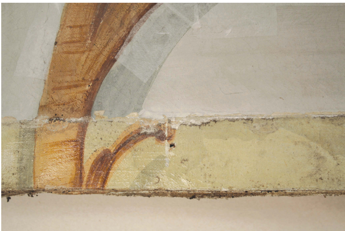
Obr.9: Panel 3, detail rozdílu zpracování stínů, stav před sejmutí přemalby, Velký čínský salonek, SZ Veltrusy, Foto: Veronika Kellerová