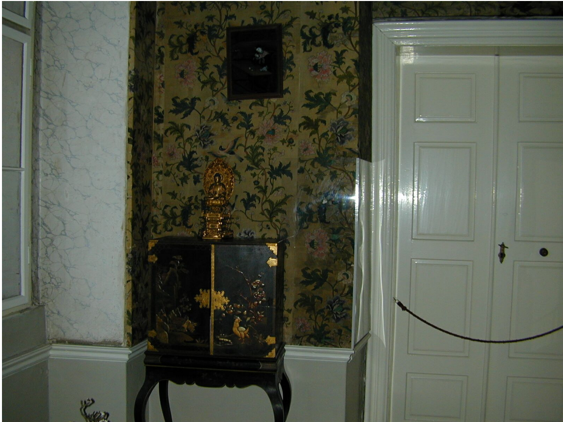
Obr. 68: Textilní tapety, Malý kabinet, SZ Veltrusy, Foto: PhDr. Eva Hájková