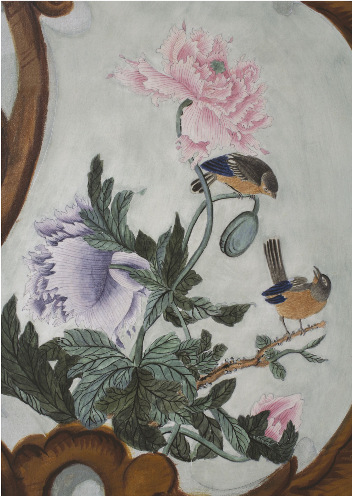
Obr. 62: Technologická kopie části malby tapetových dveří na mobilním panelu po dokončení, detail malby a povrchů, Velký čínský salonek, SZ Veltrusy