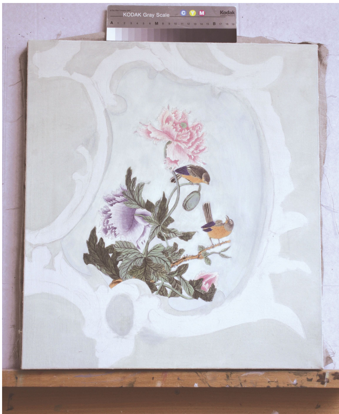
Obr. 54: Po namalování pozadí, průběžný stav technologické kopie části restaurované malby tapetových dveří na mobilním panelu, Velký čínský salonek, SZ Veltrusy, Foto: Andrea Havlíčková