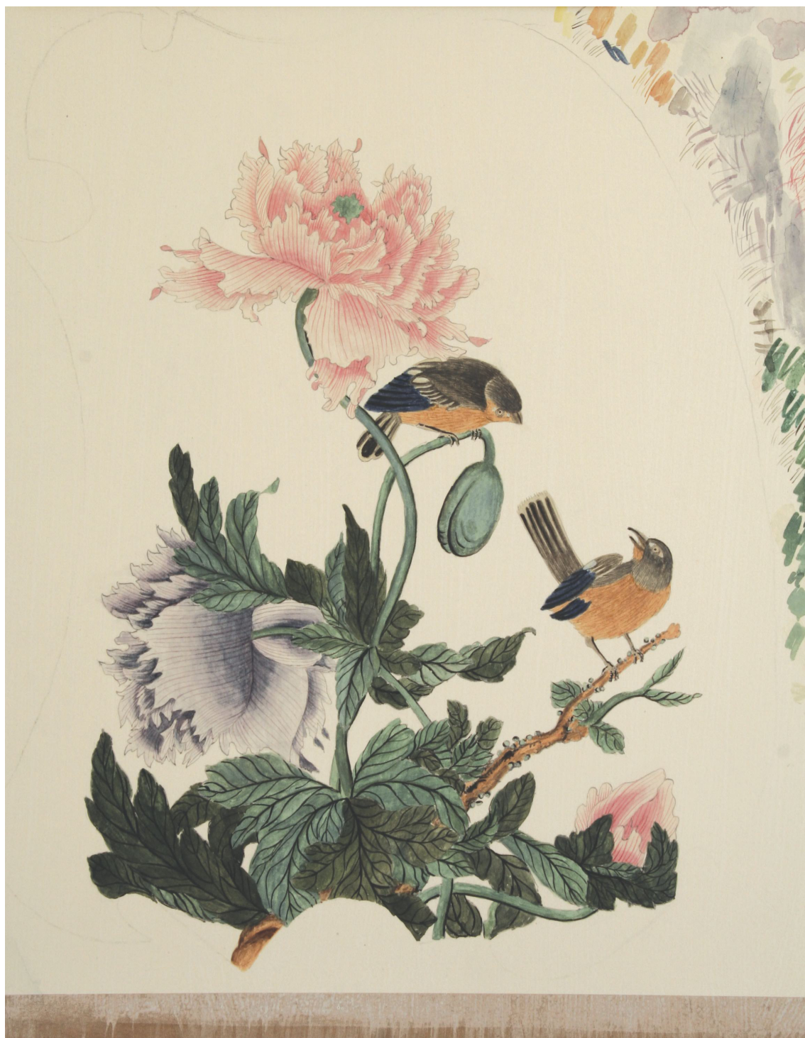
Obr. 47: Papírová aplikace po kolorování, průběžný stav technologické kopie části restaurované malby tapetových dveří na mobilním panelu, Velký čínský salonek, SZ Veltrusy, Foto: Andrea Havlíčková