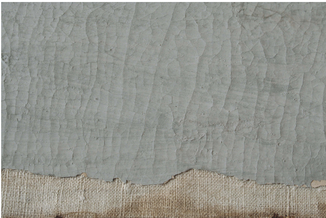
Obr.14: P13A, detail poškození – poškozená barevná vrstva, Velký čínský salonek, SZ Veltrusy, Foto: Andrea Havlíčková