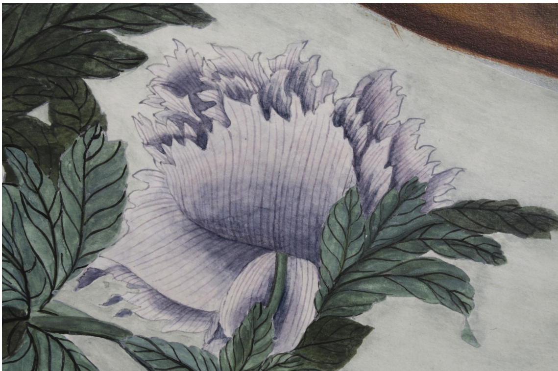
Obr. 59: Technologická kopie části malby tapetových dveří na mobilním panelu po dokončení, detail malby a povrchů, Velký čínský salonek, SZ Veltrusy