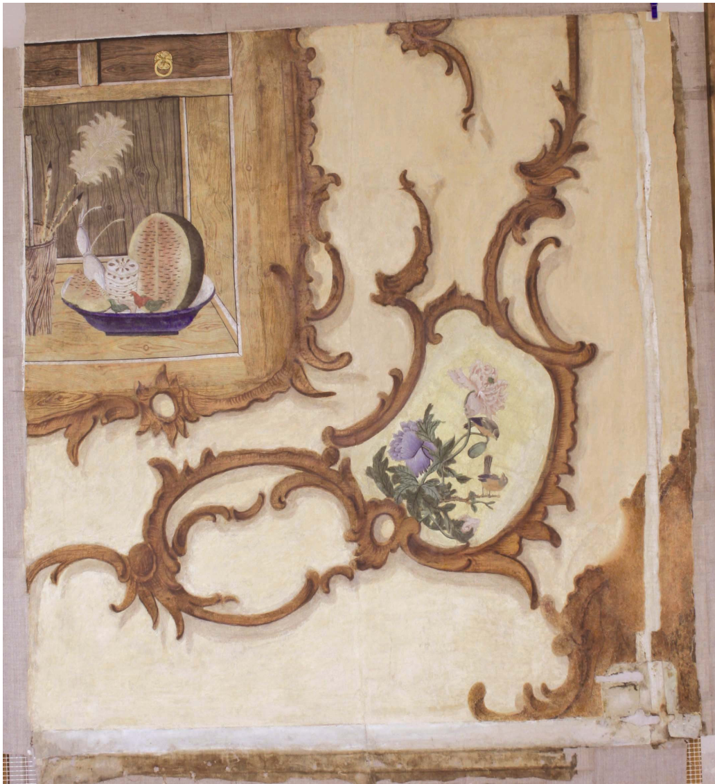
Obr.5: Panel 13A – tapetové dveře, Velký čínský salonek, SZ Veltrusy, stav po restaurování, Foto: Andrea Havlíčková