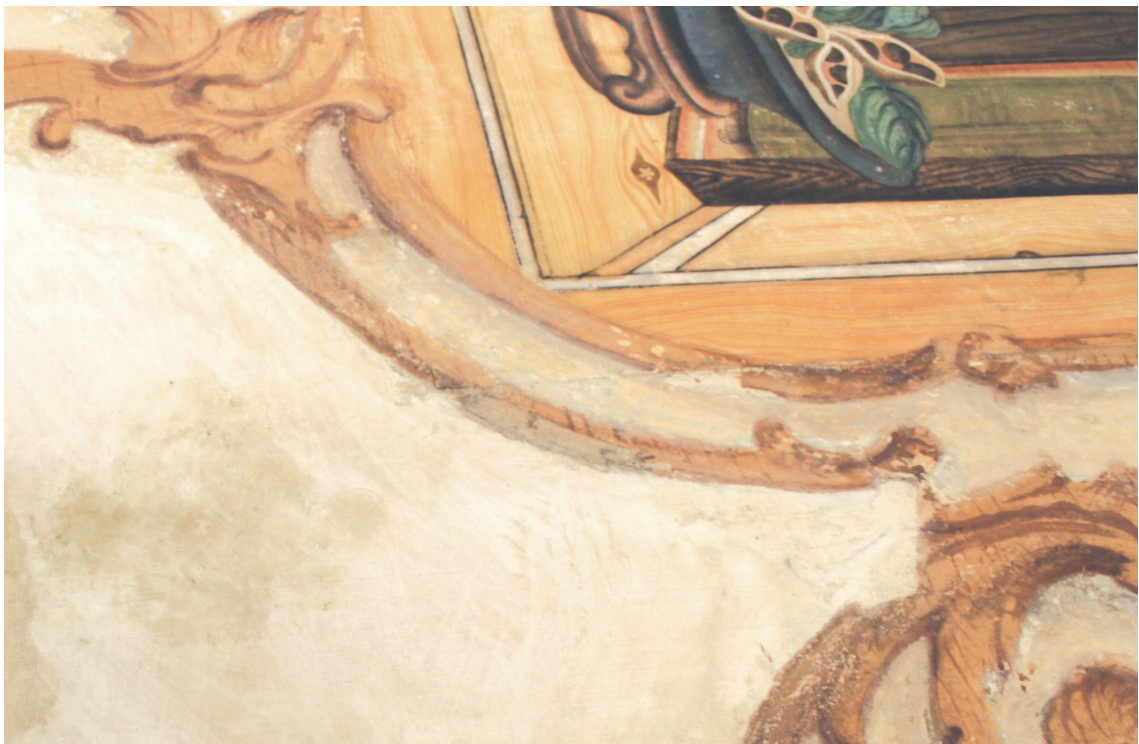
Obr.18: P15, detail iluzivního rámce malovaného přes papírovou aplikaci, Velký čínský salonek, SZ Veltrusy