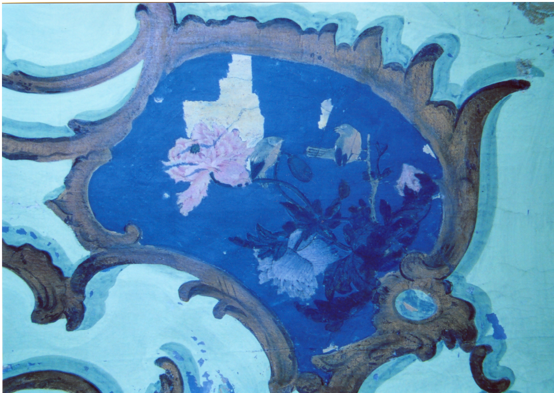
Obr. 33: P13A, pozorování přemaléb v UV luminiscenci, Velký čínský salonek, SZ Veltrusy, Foto: Andrea Havlíčková