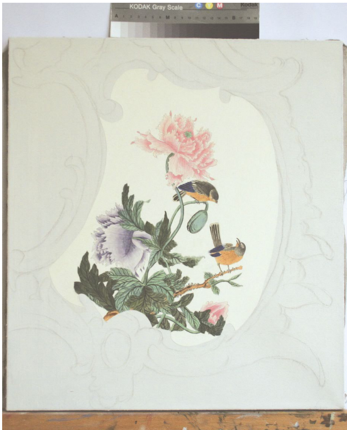
Obr. 53: Papírová aplikace nalepená na podkladu na plátěné podložce, průběžný stav technologické kopie části restaurované malby tapetových dveří na mobilním panelu, Velký čínský salonek, SZ Veltrusy, Foto: Andrea Havlíčková