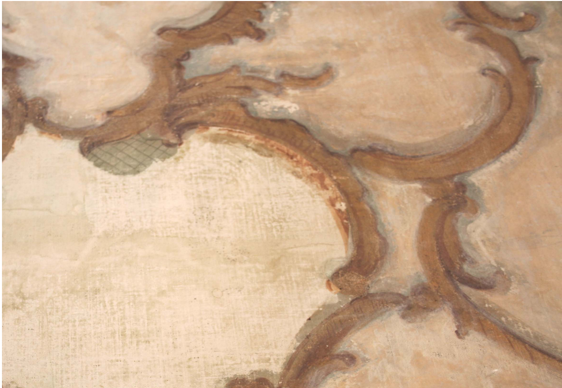
Obr.17: P5, detail malby rámce později přelepeného papírovou aplikací, Velký čínský salonek, SZ Veltrusy, Foto: Jitka Lustyková