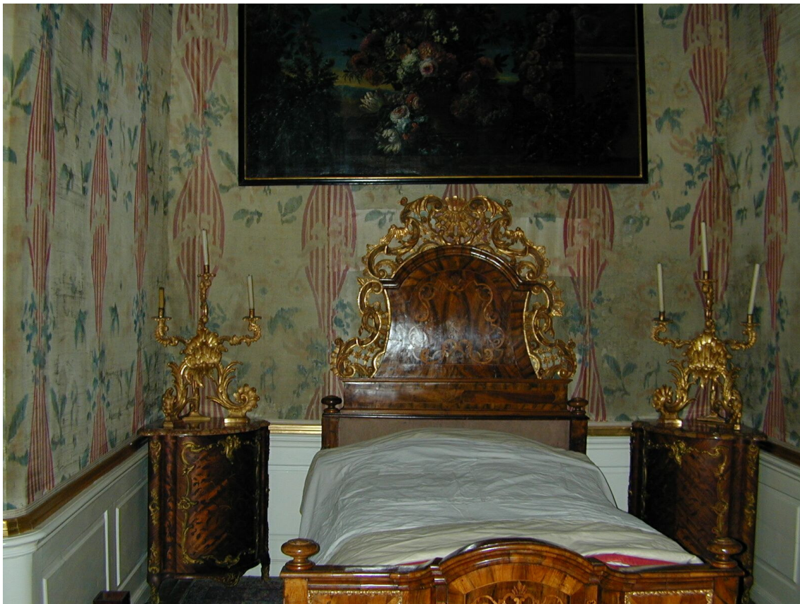
Obr. 65: Textilní tapety, hedvábný taft chiné s melírovaným dekorem květů, broskví a ptáků, ložnice s alkovnou, SZ Veltrusy, Foto: PhDr. Eva Hájková