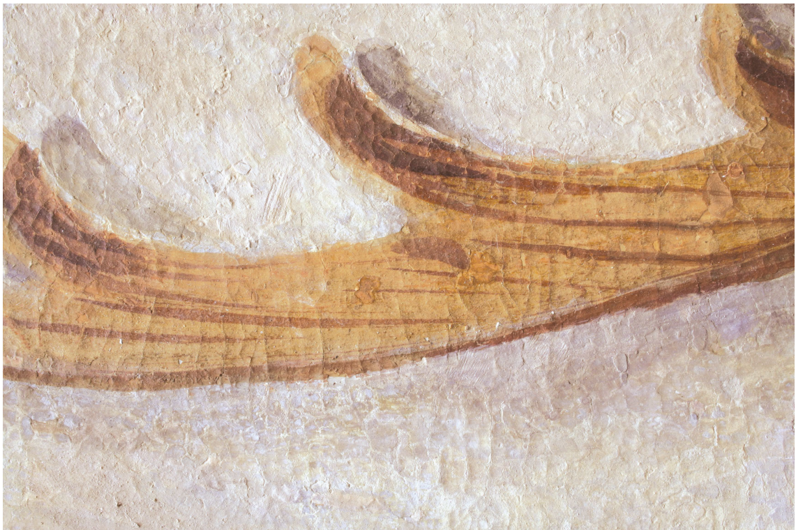
Obr. 22: P15, detaily rukopisu na iluzivních dřevěných kartuších, Velký čínský salonek, SZ Veltrusy