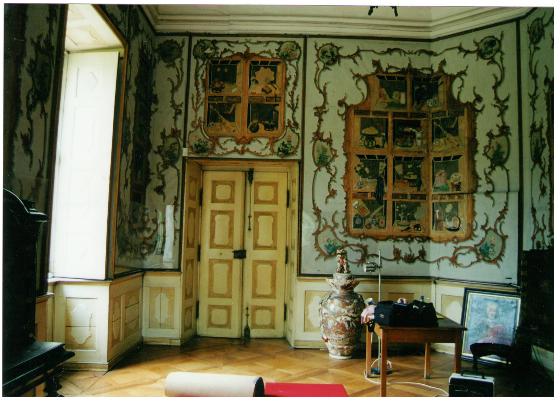
Obr. 36: Velký čínský salonek, SZ Veltrusy, pohled na stěnu s dveřmi před restaurováním tapet, Foto: PhDr. Eva Hájková