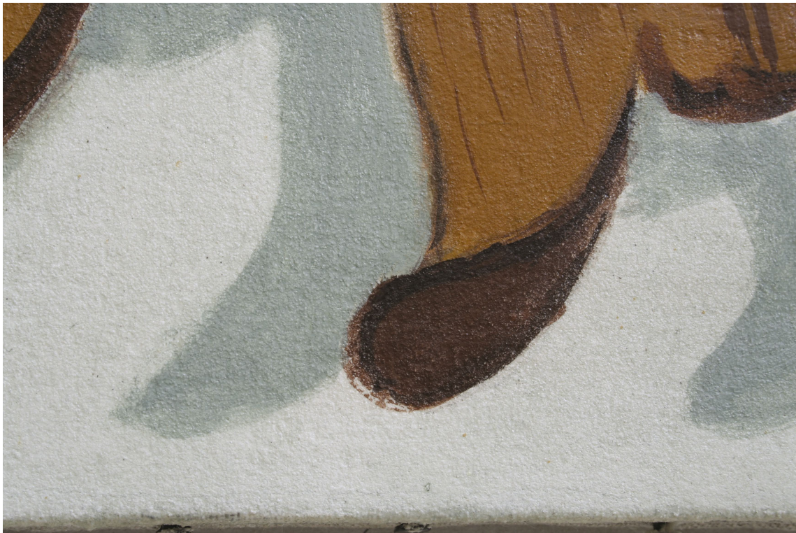
Obr. 61: Technologická kopie části malby tapetových dveří na mobilním panelu po dokončení, detail malby a povrchů, Velký čínský salonek, SZ Veltrusy, Foto: Andrea Havlíčková