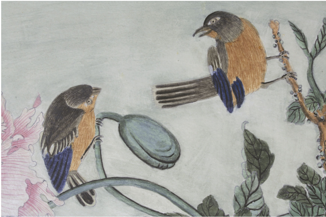
Obr. 60: Technologická kopie části malby tapetových dveří na mobilním panelu po dokončení, detail malby a povrchů, Velký čínský salonek, SZ Veltrusy, Foto: Andrea Havlíčková