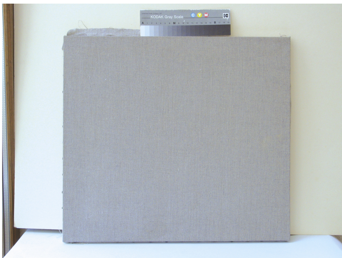
Obr. 41: Napnuté a naklížené plátno, příprava panelu pro technologickou kopii části restaurované malby tapetových dveří na mobilním panelu, Velký čínský salonek, SZ Veltrusy, Foto: Andrea Havlíčková