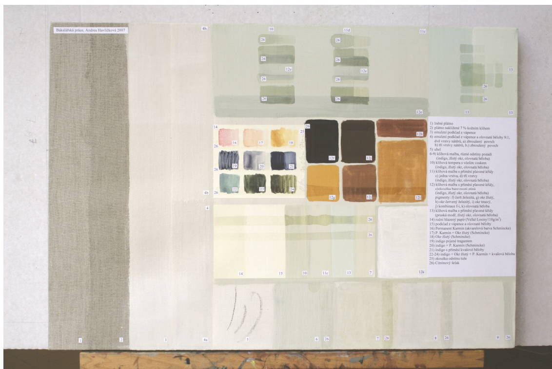
Obr. 40: Zkušební panel pro technologickou kopii části restaurované malby tapetových dveří, Velký čínský salonek, SZ Veltrusy, Foto: Andrea Havlíčková