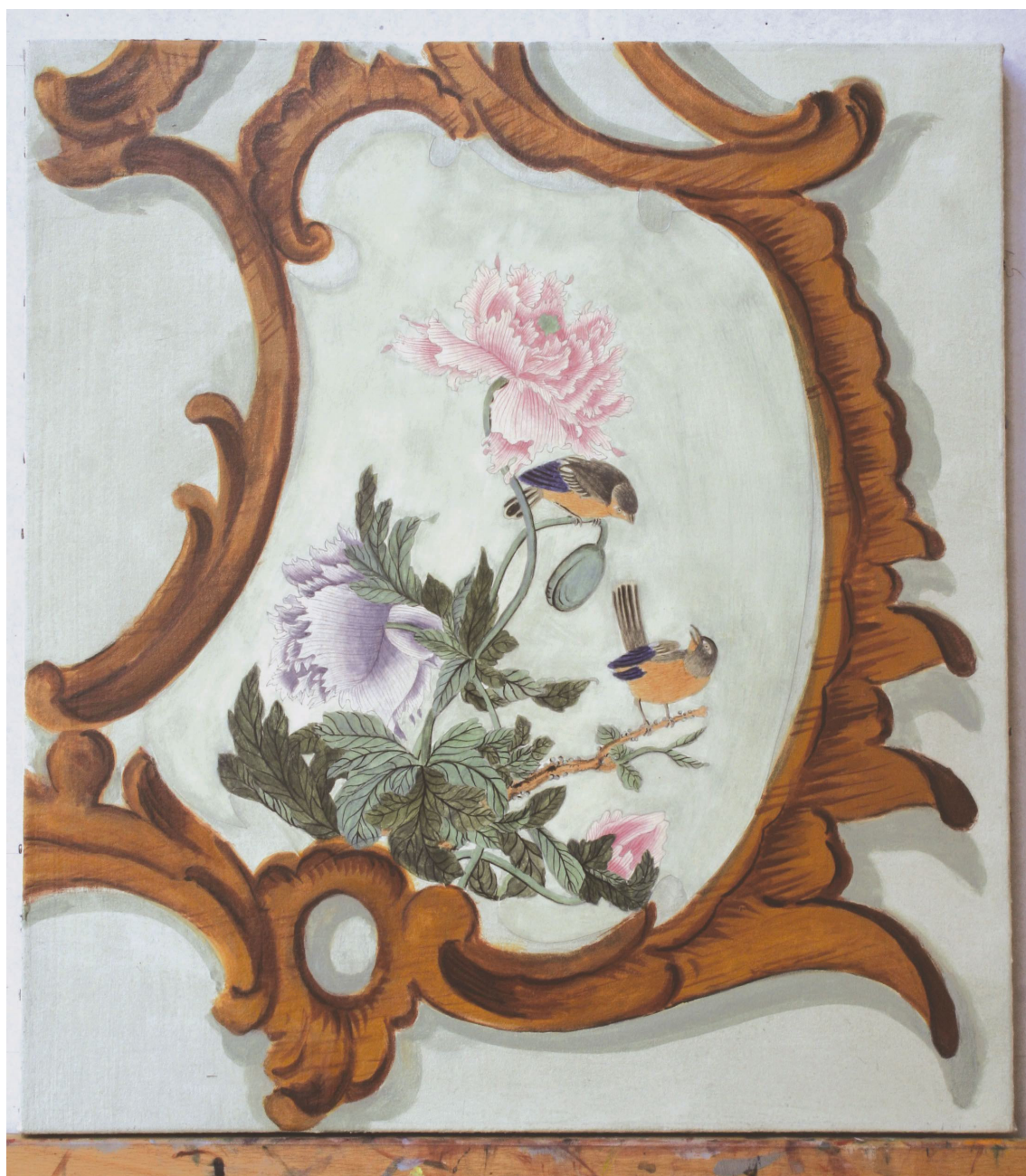
Obr. 57: Technologická kopie části malby tapetových dveří na mobilním panelu po dokončení úpravy povrchu šelakem, Velký čínský salonek, SZ Veltrusy