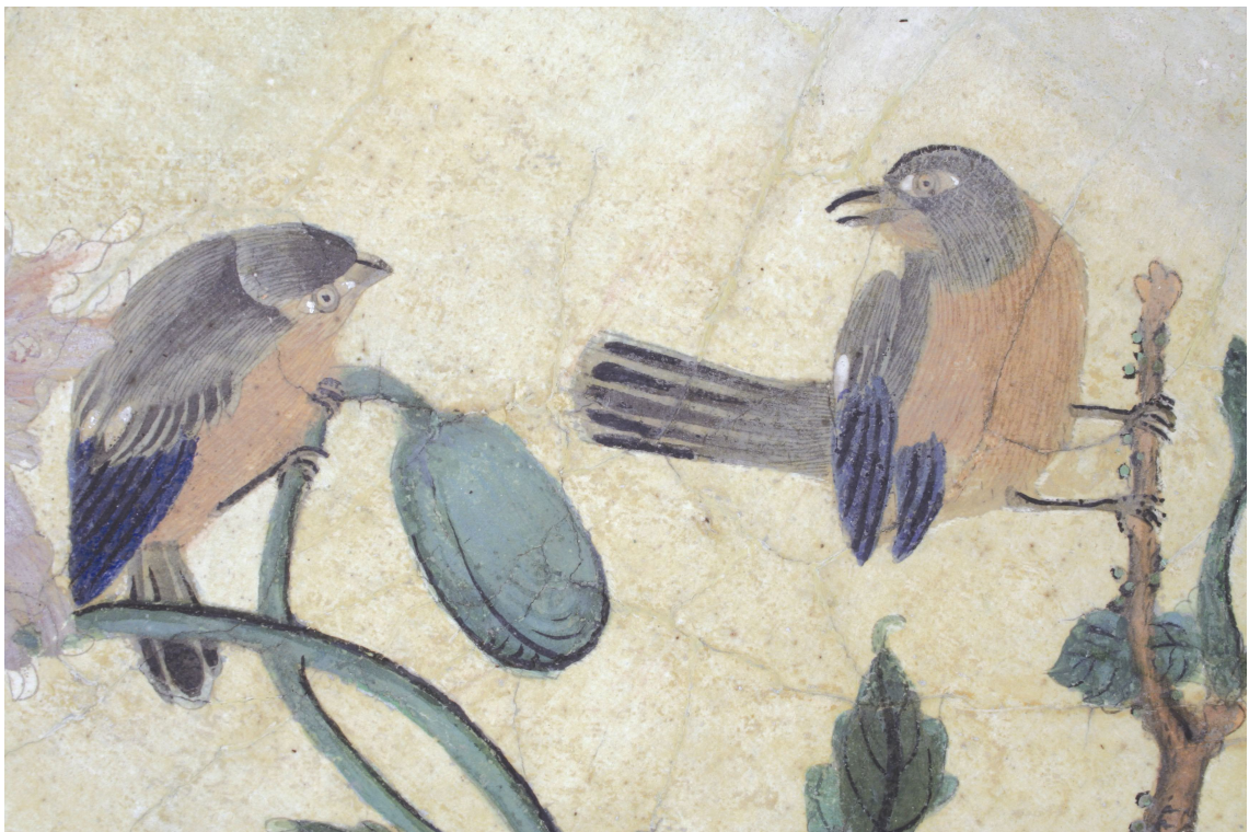
Obr. 28: P13A, detail ptáčků, Velký čínský salonek, SZ Veltrusy, Foto: Andrea Havlíčková