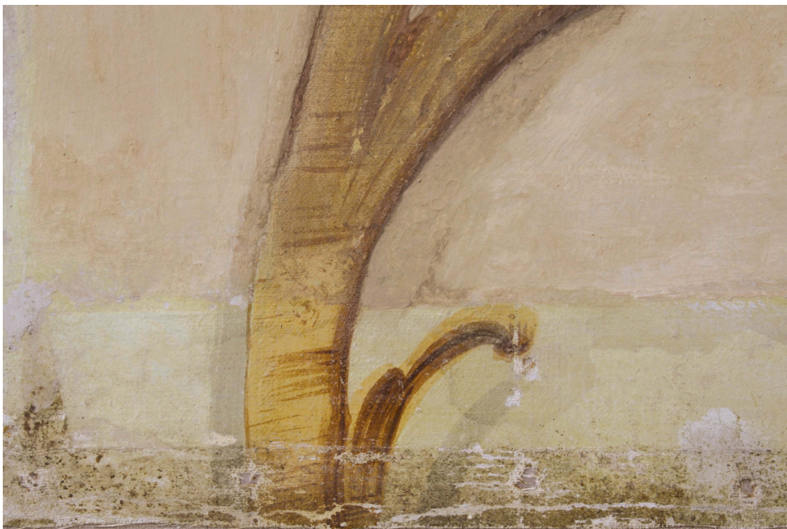
Obr.10: Panel 3, detail rozdílu zpracování stínů, stav po sejmutí přemalby, Velký čínský salonek, zámek Veltrusy, Foto: Andrea Havlíčková