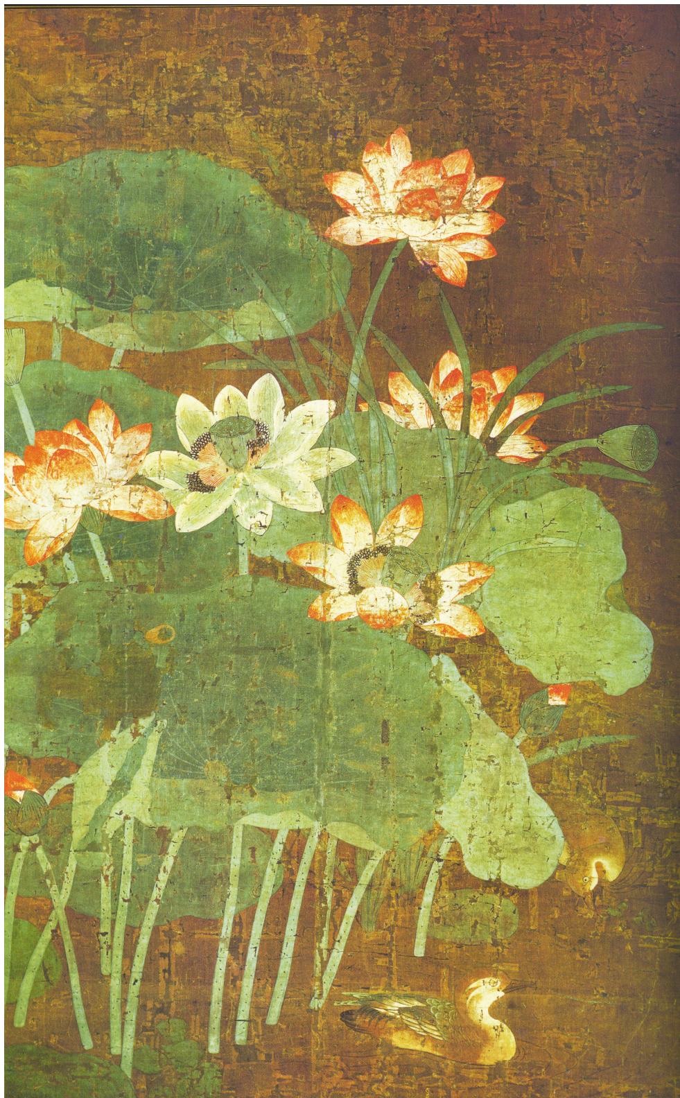
Obr. 48: Lotos s kachny, dílo malba na hedvábí, Čína 13.–14. stol., Auboyer, J., Goepper, R., Umění světa - Umění dálného východu, Praha 1972, obr. 63, s. 110, analogické dílo