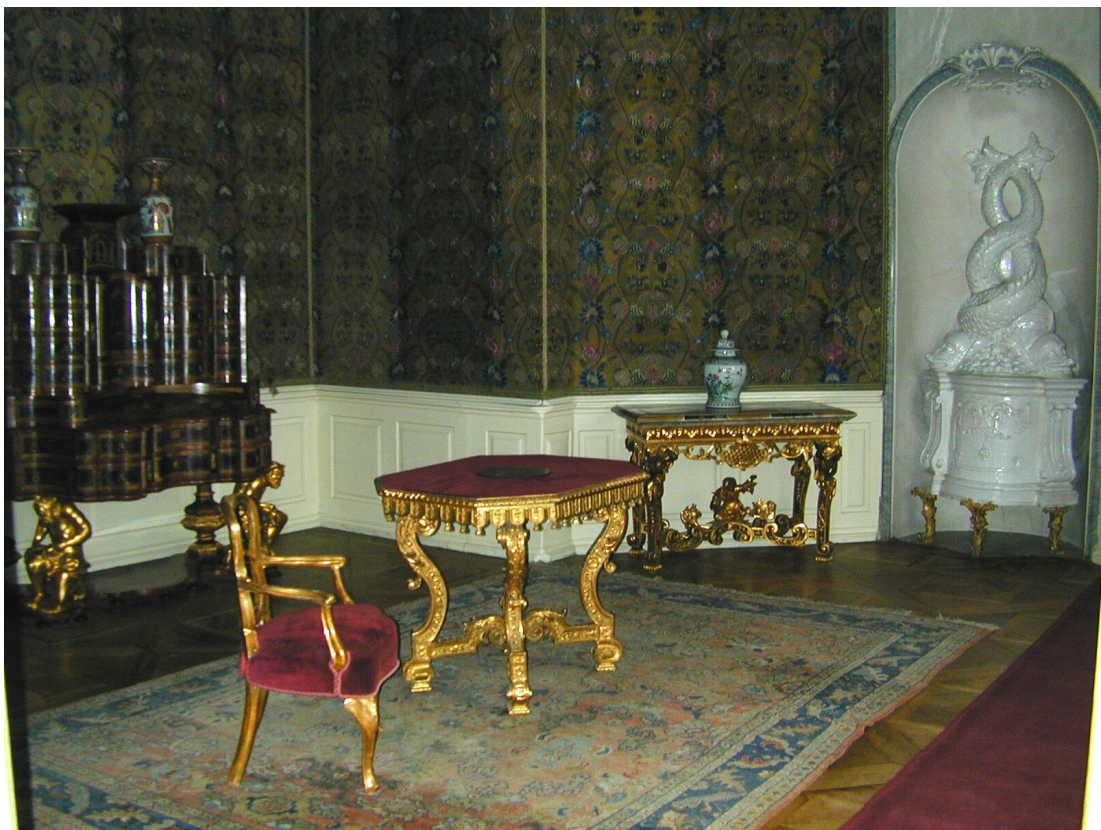
Obr. 69: Textilní tapety, Druhá zrcadlově orientovaná ložnice s alkovnou a kartušemi s aliančním znakem, SZ Veltrusy