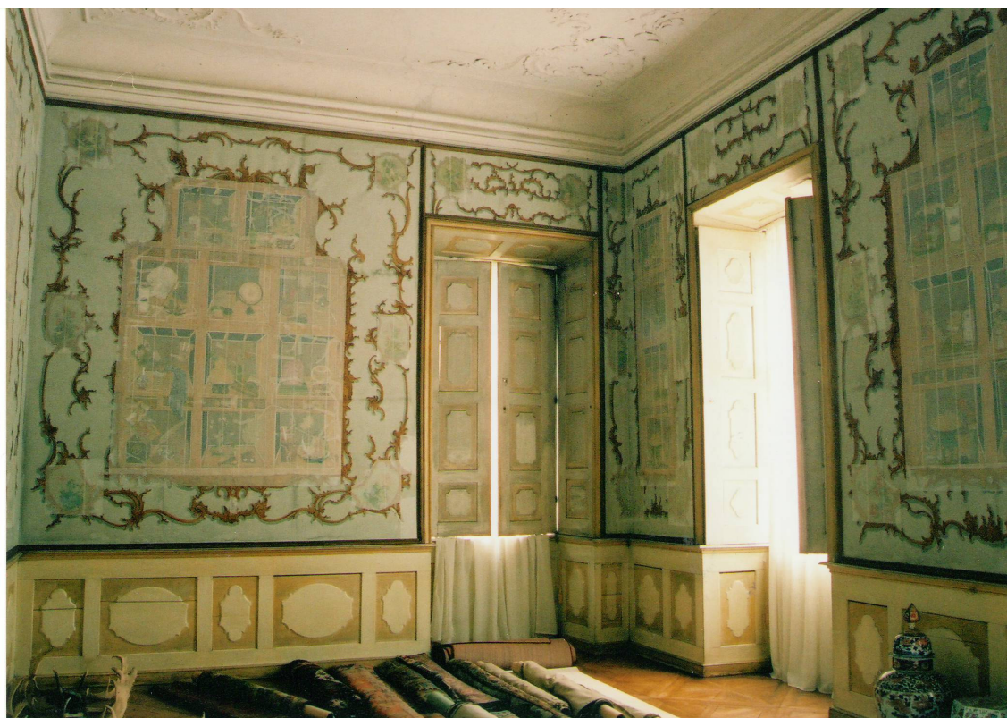
Obr. 38: Velký čínský salonek, SZ Veltrusy, pohled na jihovýchodní stěnu před restaurováním tapet, Foto: Kateřina Opatová