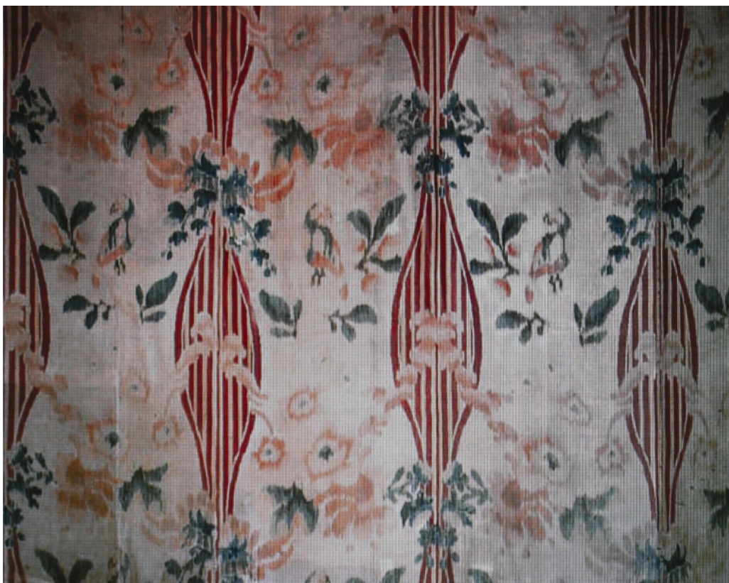
Obr. 66: Detail, hedvábný taft s melírovaným dekorem květů, broskví a ptáků, ložnice s alkovnou, SZ Veltrusy, Foto: PhDr. Eva Lukášová