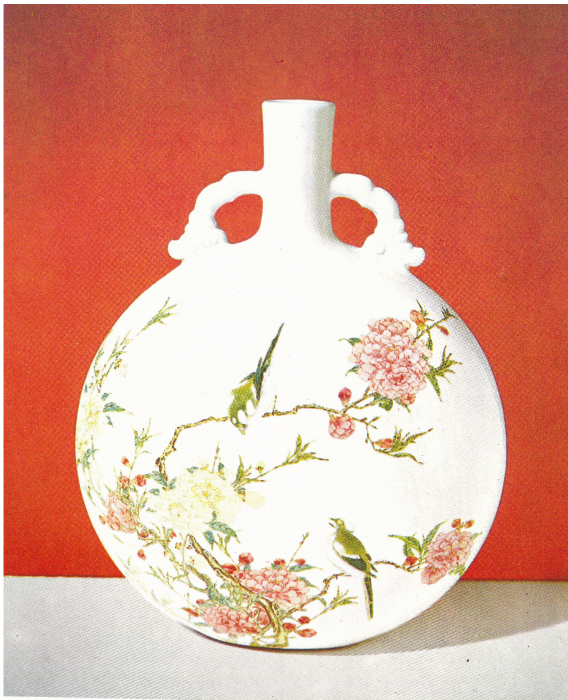
Obr. 49: Láhev s dekorací „Famille rose“ Čína 1723–1735, Auboyer, J., Goepper, R., Umění světa - Umění dálného východu, Praha 1972, obr. 77, s. 120, analogické dílo